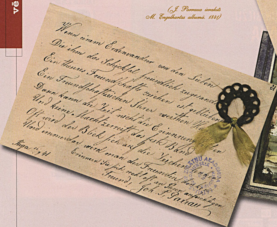
J. Parraua ieraksts M. Engelhartas albumā, 1841