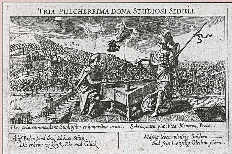
«Trīs lietas pasaulē ir, kas ved pie mākslas, laimes un goda – dzīvot ar mēru, cītīgi studēt un Dievu pielūgt». D.Meisnera gravīra ar Heidelbergas prospektu no R.Hemsinga albuma (ap 1625. gadu.)

Kāds, kas dziļi izjutis dzīves likumsakarības, zināja, ka vienīgais, ko mums nevar atņemt, ir mūsu atmiņas. Mazajos oktāvfōrmāta albumos tad nu koncentrējusies augstvērtīga gaišu atmiņu esence. «Skaistums mirdz man /