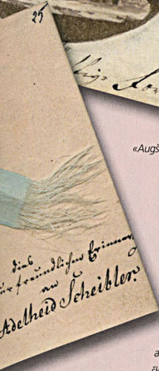
Matildes Engelhartas atmiņu albuma lapa ar matu šķipsnu rotājumu, Rīga, 1839