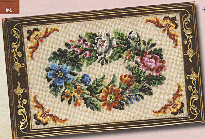
T. Dēbnera albuma vāks ar 1851. gadā darinātu stikla pērlišu izšuvumu

Teoloģijas students, virsnieks, tirgotāja kundze, meitene no senas, dižciltīgas dzimtas, topošais ārsts, augstākās sabiedrības dāma, ķīmiķis–farmaceits, universitātes profesors un mūslaiku skolniece tinīte , vēl citi un citi... Kam tāds uzskaitījums un kas gan varētu būt kopīgs tik atšķirīgiem ļaudīm? Tos nevieno nedz nodarbošanās, nedz vieta sabiedrībā, arī ne dzīves laiks.