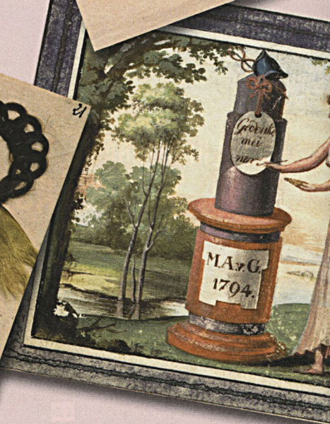
Draudzības pieminēklis. Akvarelis no M.A. Galanderes albuma, Rīga, 1794