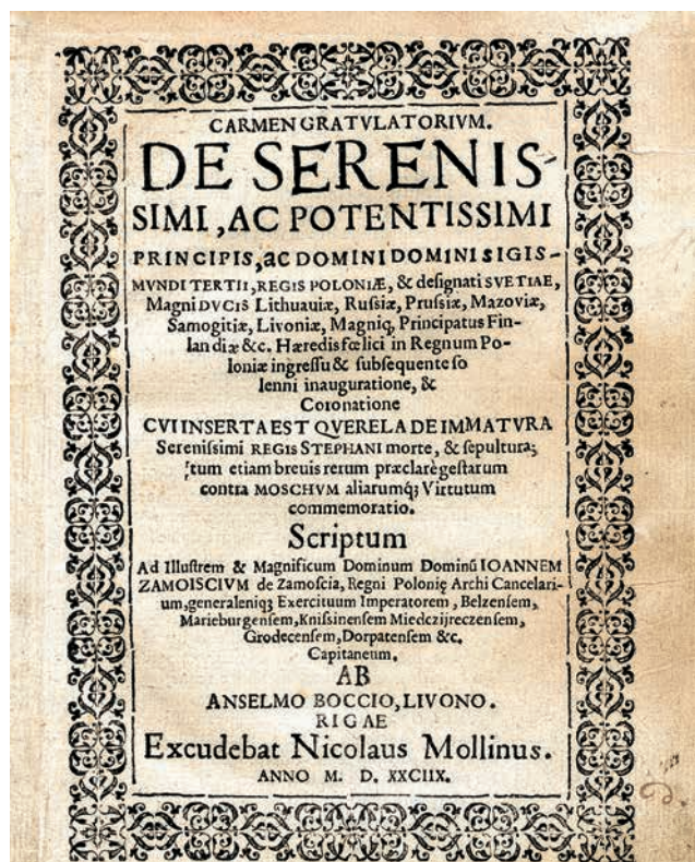
Vecākais Rīgas iespieddarbs Carmen Gratulatorium, Nikolauss Mollīns, 1588.

Ar Mollīna tipogrāfiju saistīta pirmo divu zināmo Rīgas grāmatasēju darbība. Pateicoties tam, ka turpmāk meistarų skaits pieauga un to kvalifikācija bija atbilstoša, 1630. gadā tika iedibināts Rīgas grāmatasēju amats