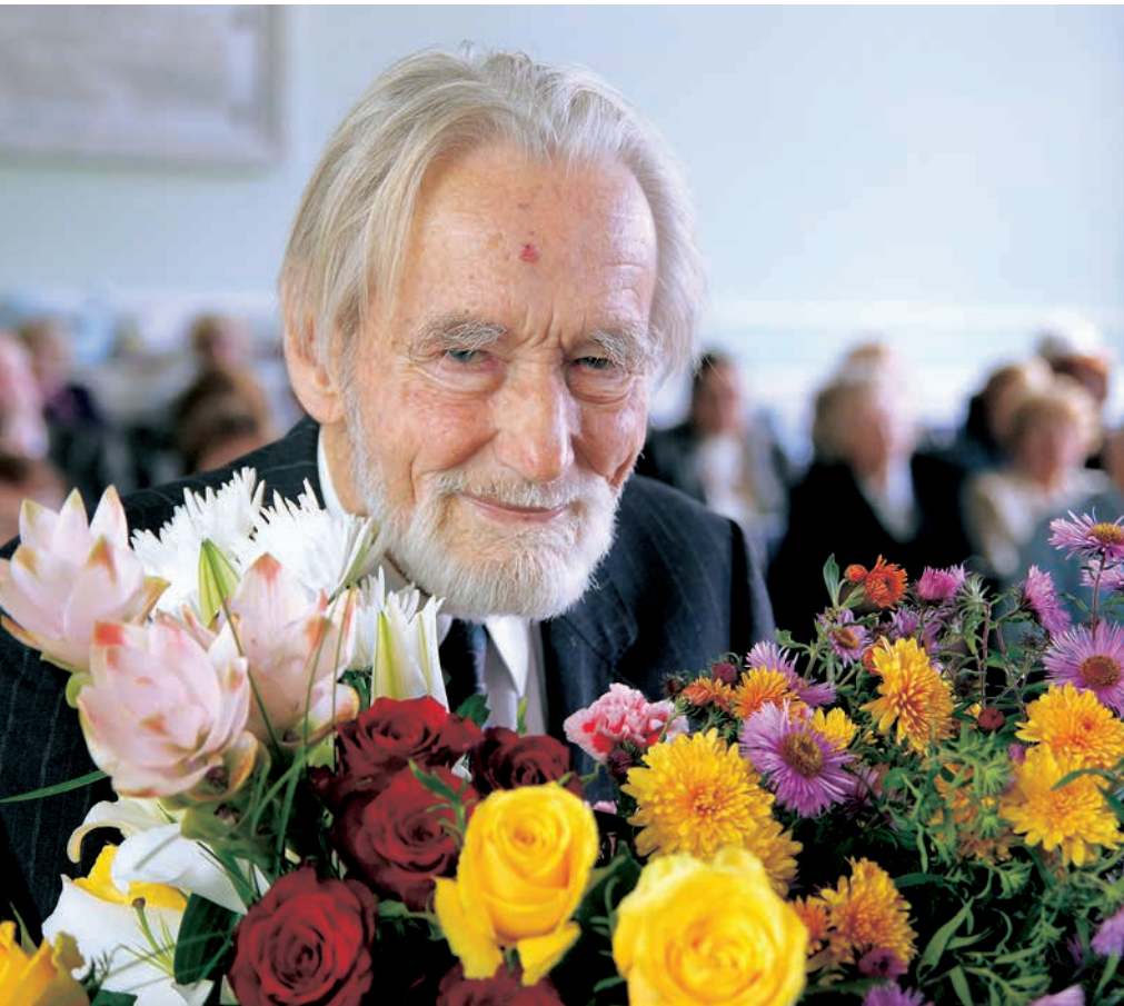
Latvijas Universitātes senioru jubileju svinībās 2013. gada 15. oktobrī