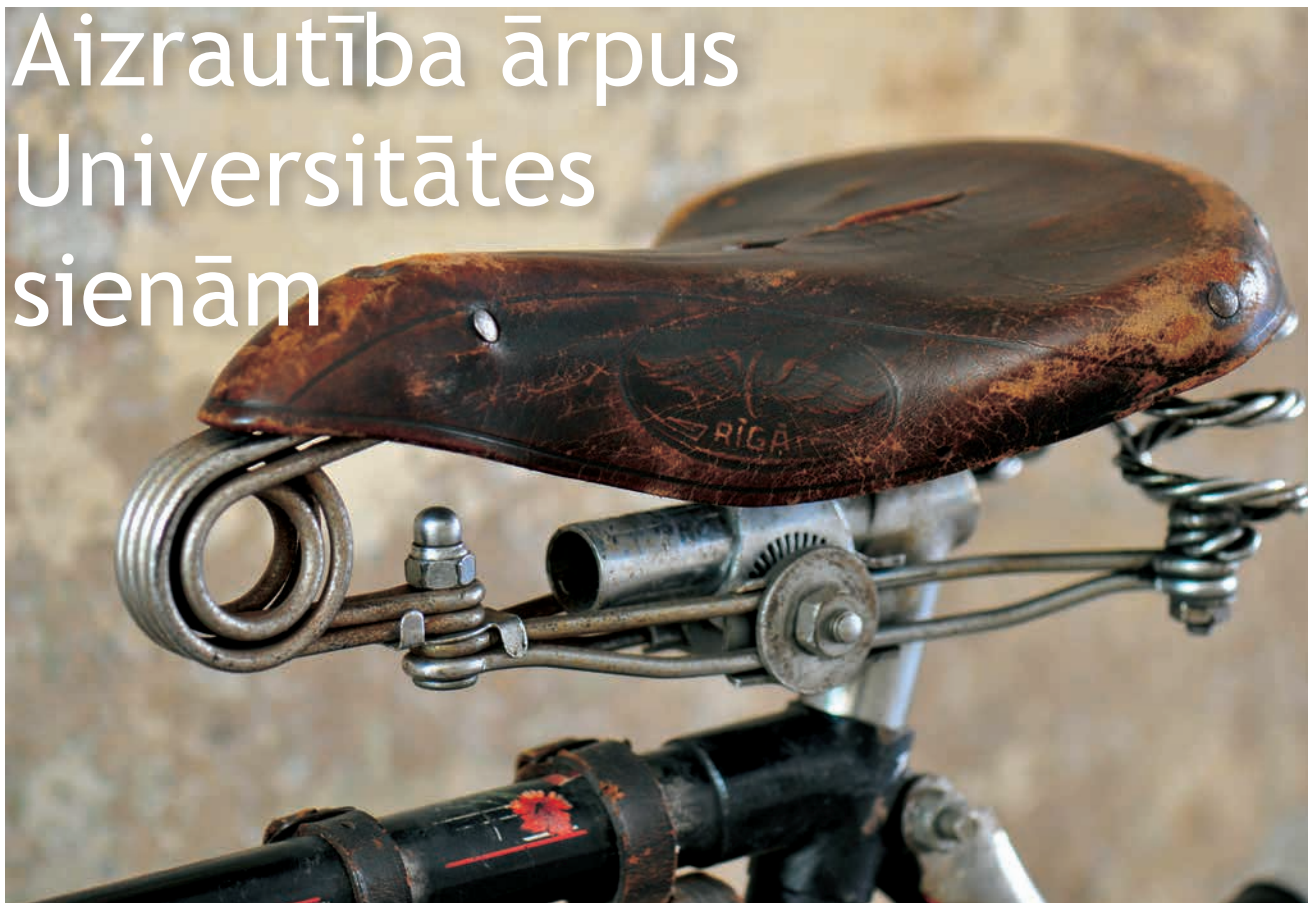
Raksta tapšanas laikā velosipēds bijis izjaukts, tāpēc arī «kopbilde» izpalika.