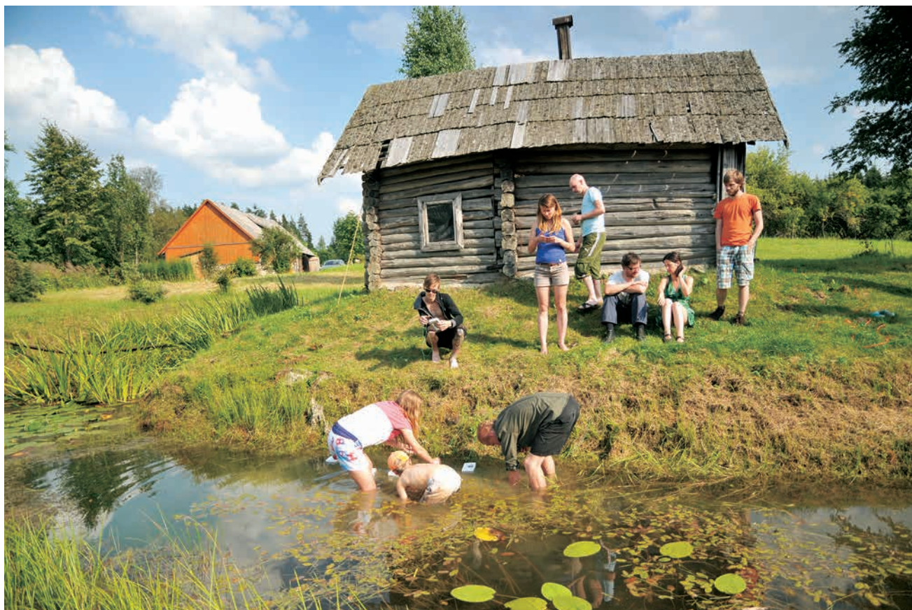
Diņa baterijas izveidošana starptautiskā simpozija Renewable Lab laikā Kurzemē 2012. gada jūlijā.

«Zinātnieku nakts piedāvā platformu mūsu nozares pārstāvjiem satikties ar pasākuma apmeklētājiem un domāt, meklēt, kā