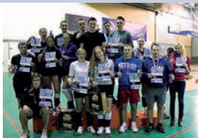
Volejbola turnīra laureāti.

14. novembrī vairākās Olimpiskā sporta centra zālēs norisinājās Latvijas Universitātes Sporta nakts turnīrs «LU Sporta nakts 2013». Tas bija līdz šim lielākais augstskolas nakts sporta pasākums, jo vienlaikus notika izspēles četros dažādos sporta veidos: strītbolā, futbolā, florbolā un volejbolā. Visvairāk komandu bija pieteikušās strītbola sacensībām – pavisam 18 komandas, futbola sacensībās piedalījās 9 studentu komandas, florbolā – 5, volejbolā savā starpā sacentās 6 komandas.