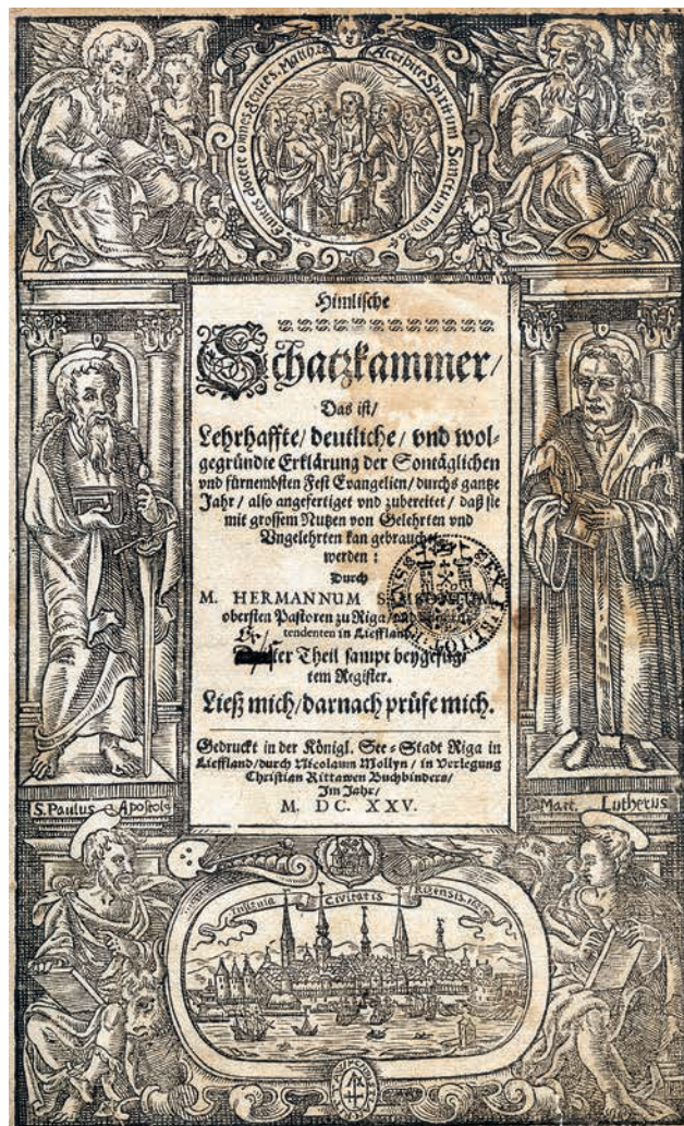
Samsonius, Hermann. Himmliche Schatzkammer... Riga: Gedruckt durch Nicolaum Mollyn In Verlegung Christian Rittawen Buchbinders Im Jahr 1625. Titullapa.

Cēlonis, kādēļ Niklāsam Mollijnsam nācās pamest Spānijas karalistei pakļauto protestantisko Antverpeni un Flandriju uz vieniem laikiem, ir jāmeklē reliģisku, politisku, militāru kaislību plosītās pilsētas vēsturē Nīderlandes revolūcijas jeb 80. gadu kara sākumposmā (1568–1648). Mollijnsa tipogrāfiju repertuārs konsekventi