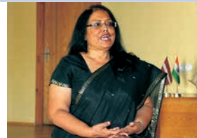
Indijas vēstniece Zviedrijā un Latvijā Banašri Bose Harisona (Banashri Bose Harrison)

9. septembrī LU Akadēmiskajā bibliotēkā Rūpniecības ielā 10 atklāts LU Indijas studiju un kultūras centrs. Jaunizveidotā centra mērķis ir veidot Latvijas sabiedrības zināšanas par mūsdienu Indijas kultūru, biznesu un politiku, kā arī veicināt sadarbību starp Latvijas un Indijas pētniekiem un mācībspēkiem. Centrs piedāvā arī hindi valodas kursus visiem interesentiem.