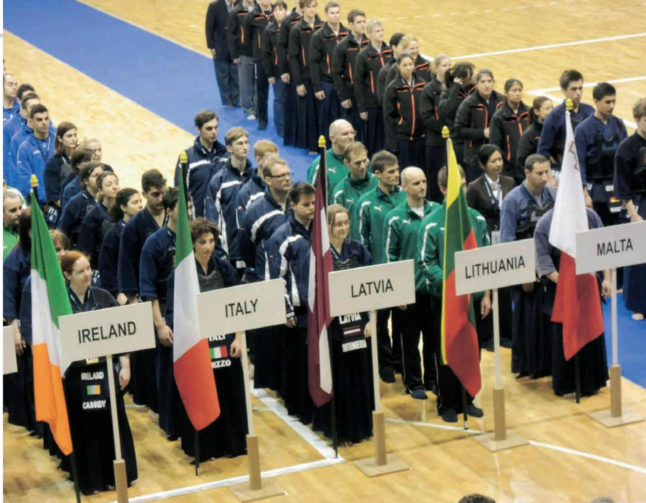
LU Kendo klubā reģistrēti 14 biedri.