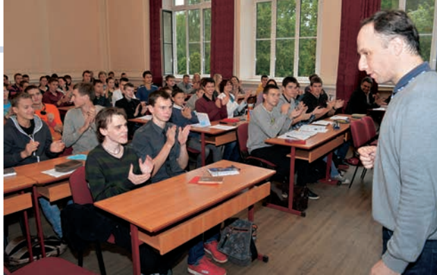
Vadot teorijas lekciju Jauno fiziķu skolā.

Zinātnē nav jākautrējas saukt lietas istajos vārdos. Nereti gan zinātnes vārds tiek nelietīgi valkāts – pseidozinātnē. Ir dažādi tukši pseidozinātniski sacerējumi, kas nav balstīti zinātnē, piemēram, par hologrāfisko visumu, torsiona laukiem, kvantu psiholoģiju u. tml. Tos varbūt ir interesanti lasīt, bet tam nav nekāda sakara ar zinātni. Runājot par populāro zinātni, tā gan jānodala no pseidozinātnes.