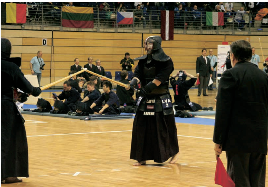
Caur kendo tērpu ne vecumu, ne dzimumu nevar noteikt, ja vien kādai dāmai no aizsargķiveres ( men ) nerēgojas sapītā bize.