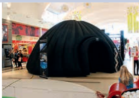
Noršēpinas zinātnes Vizualizācijas centra publicitātes materiāli

No 3. līdz 4. septembrim Baltadapta projekta ietvaros Latvijas Universitātē notika starptautiska konference «Adaptācija klimata pārmaiņām Baltijas jūras reģionā». Tās laikā Mazajā aulā varēja ielūkoties neparastā kinoteātri – Ģeodomā, kurā jebkurš apmeklētājs varēja noskatīties īsfilmas par klimata pārmaiņām, kas tika projicētas uz piepūšamā kinoteātra griestiem, un piedalīties interaktīvās nodarbībās.