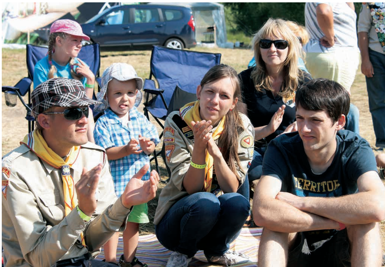
Jauniešu nometnē.