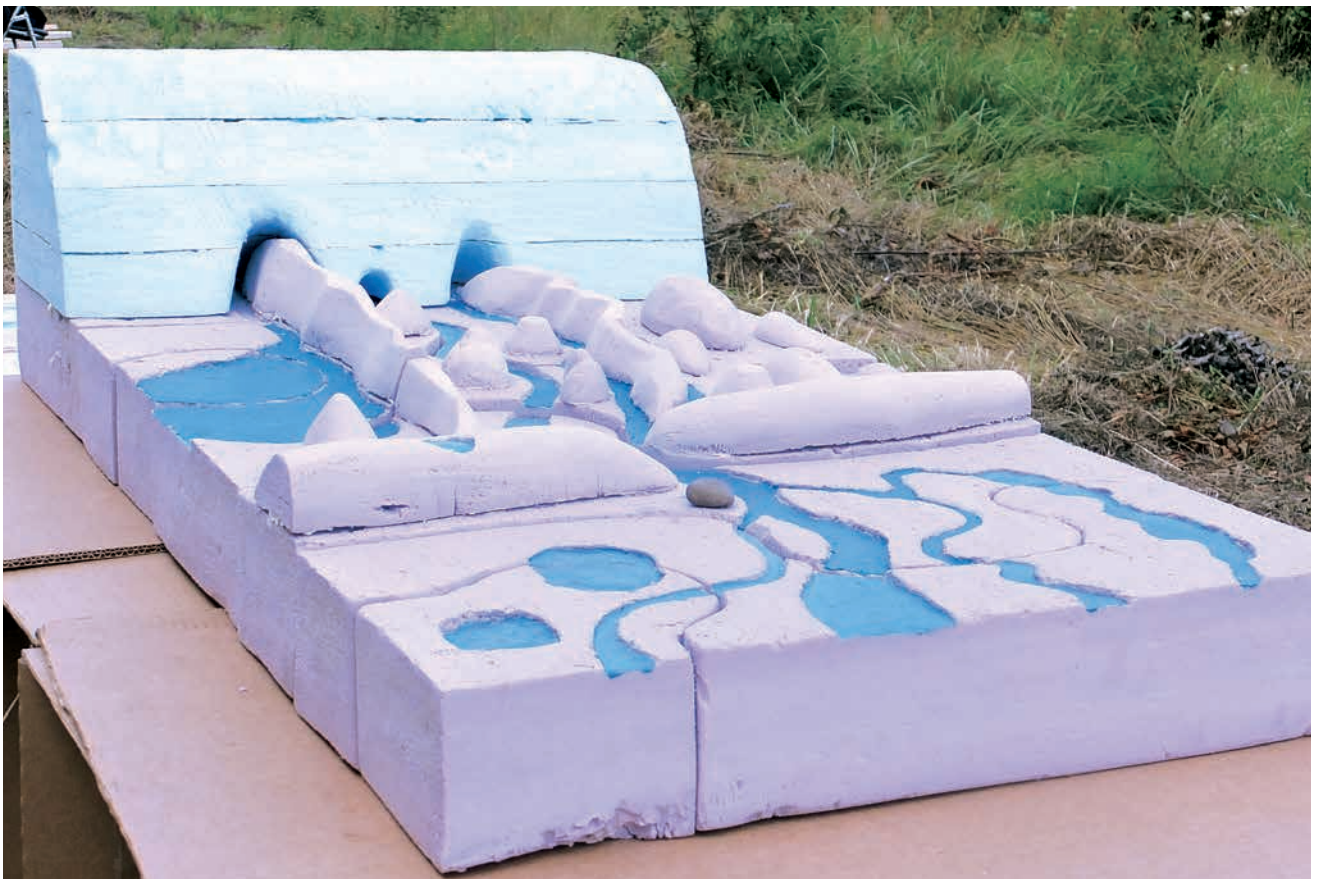
Osa dabas koncertzāle Vilkenē.

Science and culture complement and facilitate each other. Nowadays concerts are impossible without microphones and sound equipment developed by scientists, while culture and art can be used to explain and promote complicated scientific issues. Although cooperation between science and art seems easy, the obvious and enjoyable end result implies hard work by both scientists and artists. Dispensing with foreign words and industry specifics is impossible—the obvious 'exterior' or end result is based on serious and substantial scientific and artistic work. The result is worth it, since it invites people to think, participate and learn. Alma Mater offers a few notable examples of the interaction between scientists of the University of Latvia and artists.