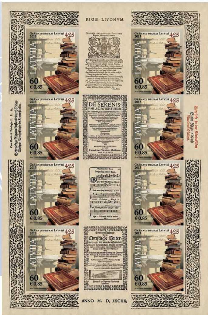
Mollina tipogrāfijai veltītās markas.