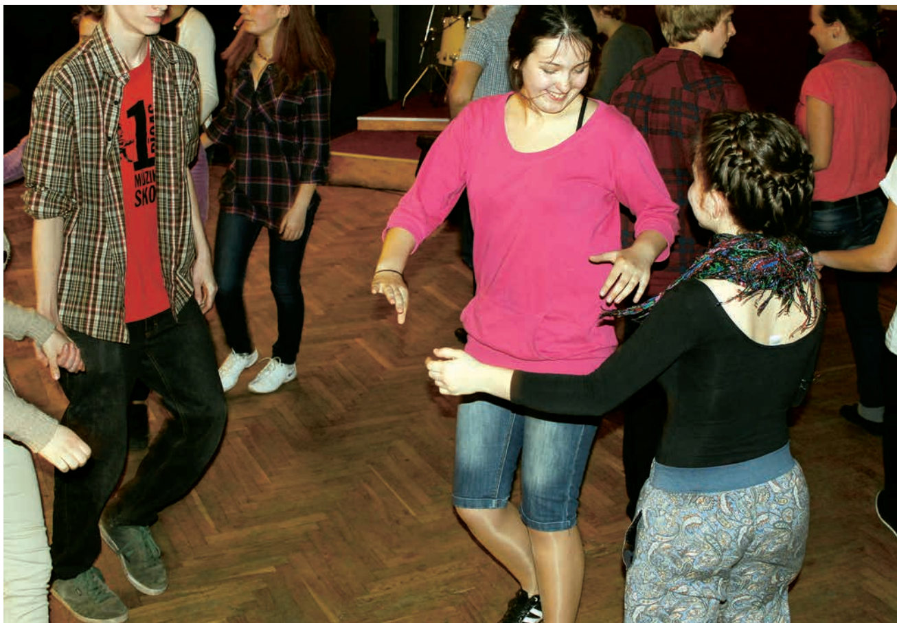
Nacionālās dejas baznīcā.