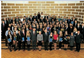
2013./2014. akad. gada stipendiāti, mecenāti un viņu pārstāvji, stipendiju komisiju pārstāvji, LU Fonda pārstāvji un LU rektors

LU Fonds sadarbībā ar mecenātiem 2013./2014. akad. gadā piešķir 91 stipendiju par kopējo summu 178 000 latu. Vienas stipendijas apjoms ir 750–7000 latu gadā. Stipendijas ieguvuši LU, Rīgas Tehniskās universitātes, Rīgas Stradiņa universitātes, Latvijas Lauksaimniecības universitātes un Liepājas Universitātes studenti. LU Fonds piešķir izcilības stipendijas, novadu stipendijas visu Latvijas augstskolu studentiem, jauno pētnieku stipendijas, korporāciju un akadēmisko mūžorganizāciju stipendijas, kā arī stipendijas 1. kursa studentiem.