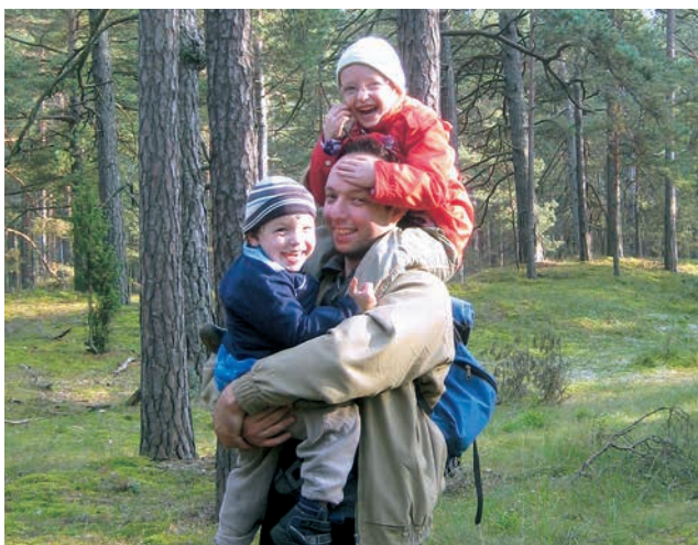
lecinātākais brīvā laika pavadīšanas veids – sēņot kopā ar ģimeni.

Katra saruna liek aizdomāties par jaunām lietām, tās sniedz garīgu enerģiju. Turklāt zinātnieks ir atbildīgs nodokļu maksātāju priekšā, jo no tā saņemam algu.