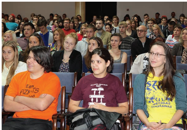
Pasākuma «Iepazīsti LU» lekcija «Mentoringa programma»