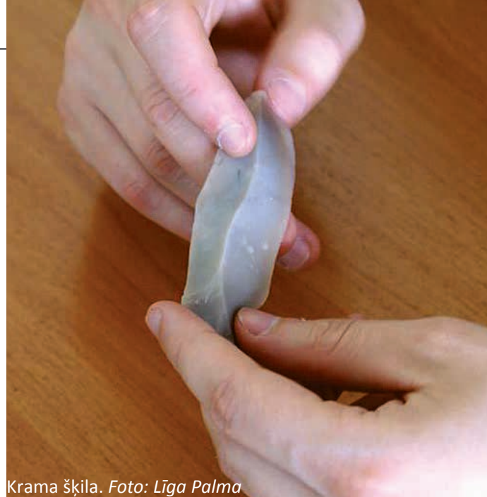
Krama šķila.

rezultātus, ir: 1) krama apstrāde – no kurienes nācis izejmateriāls un kā tā apstrādes tradīcijas iekļaujas Latvijas arheoloģiskajā materiālā; 2) dzelzs ieguve – apkopot informāciju par to, ko pašlaik zinām par dzelzs laikmetu un viduslaikiem, kāds ir pamats jauno laiku dzelzs apstrādes uzplaukumam; 3) detalizētāka statistika – manufaktūru vietas hercogistē, kāds ir to saglabāšanās stāvoklis, potenciālās informācijas apjoms; 4) arheoloģiskie izrakumi un fizikālās un ķīmiskās analīzes, kas sniedz ieskatu par dzelzs izstrādājumu sastāvu un apriti; 5) zināšanas par situāciju jauno laiku Vidzemē – kādas ir šī reģiona atšķirības un kopīgas iezīmes dzelzs ieguvē un apstrādē. Ģeogrāfiski esam ļoti tuvi, bet, no otras puses, ir cita politiskā struktūra un atšķirība saimnieciskajā pārvaldē un struktūrās. Shēma nebūs 1 pret 1, bet ceram atrast kādas iezīmes; 6) eksperimentālā arheoloģija un dzelzs ieguves krāsns rekonstrukcijas mēģinājums,» tā A. Šnē.