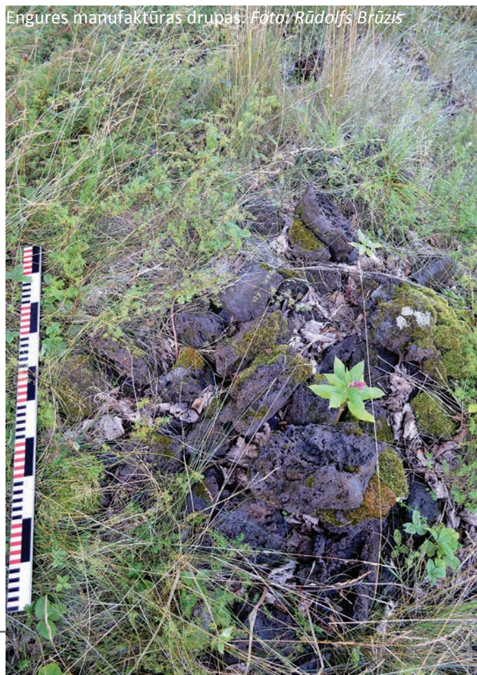
Engures manufaktūras drupas.