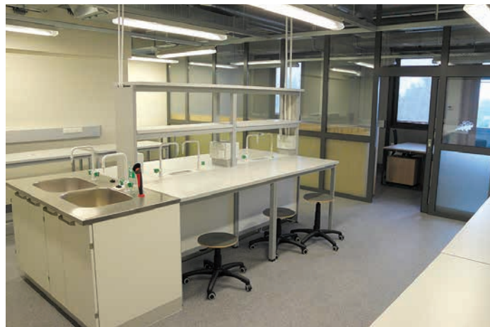
Jaunuzceltajā centrā studentiem un pētniekiem pieejamas modernas laboratorijas

Jaunā ēka ir pirmā kārtā projektā, kas paredz izveidot Latvijas Universitātes studentu pilsētiņu Torņakalnā. Nākamajās kārtās plānots izveidot Humanitāro un sociālo zinātņu centru, kā arī Eksakto un dzīvības zinātņu centru. Kompleksā paredzēta arī apartamentu apbūves daļa, kur tiks piedāvāti visi ikdienā nepieciešamie pakalpojumi, piemēram, frizētava, veļas mazgātava, ēdināšana un citi pakalpojumi, kā arī tiks nodrošināta vieta dažādām brīvā laika pavadīšanas iespējām. Plānots, ka kompleksa apartamentu daļā būs aptuveni 3000 vietas. Viss pašreizējais teritorijas labiekārtojuma risinājums ir veidots ar domu, ka nākotnē šeit tiks būvētas jaunas ēkas.