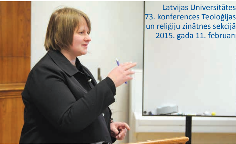
Latvijas Universitātes 73. konferences Teoloģijas un reliģiju zinātnes sekcijā 2015. gada 11. februārī