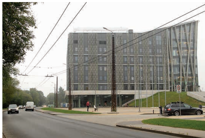
LU Dabaszinātņu akadēmiskais centrs 2015. gada 2. septembrī

piektajā – Bioloģijas fakultāte, bet sestajā – Ķīmijas fakultāte. Savukārt septītajā stāvā oktobrī vai novembrī tiks atklāta Bioloģijas fakultātes zinātniskā laboratorija – siltumnīca, kurā pētnieki varēs kontrolēt mikroklimatu, apgaismojumu, augu laistīšanu un apēnojumu, lai varētu pētīt optimālos augu audzēšanas apstākļus.