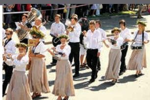
LU pūtēju orķestris piedalās XXV Vispārējo latviešu dziesmu un XV deju svētku gājienā