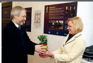
Latvijas Universitātes Teoloģijas fakultātes studentu, LU Fonda stipendiātu izstādes atklāšana

2014./2015. akadēmiskajā gadā Latvijas Universitātes Fonds ir piešķīris studentiem 121 stipendiju, t. sk. 21 Kristapa Morberga stipendiju (no tām 6 RTU studentiem), 12 stipendijas «Ceļmaize», 15 M. M. V. Petkevičs piemiņas stipendijas, 23 novadu stipendijas (4 – Salaspils novada, 8 – Jelgavas novada, 9 – Saldus novada un 2 – Engures novada jauniešiem), kā arī 9 Žaņa Lapuļa piemiņas stipendijas u. c. 80% šī akadēmiskā gada LU Fonda stipendiātu ir LU studenti, 9% studē Rīgas Tehniskajā universitātē, 4% ir Rīgas Straidiņa universitātes studenti, tāpat stipendijas tika izmaksātas Latvijas Lauksaimniecības universitātes, Liepājas Universitātes, Latvijas Kultūras akadēmijas, Ventspils Augstskolas un Rīgas Tehniskās koledžas studentiem.