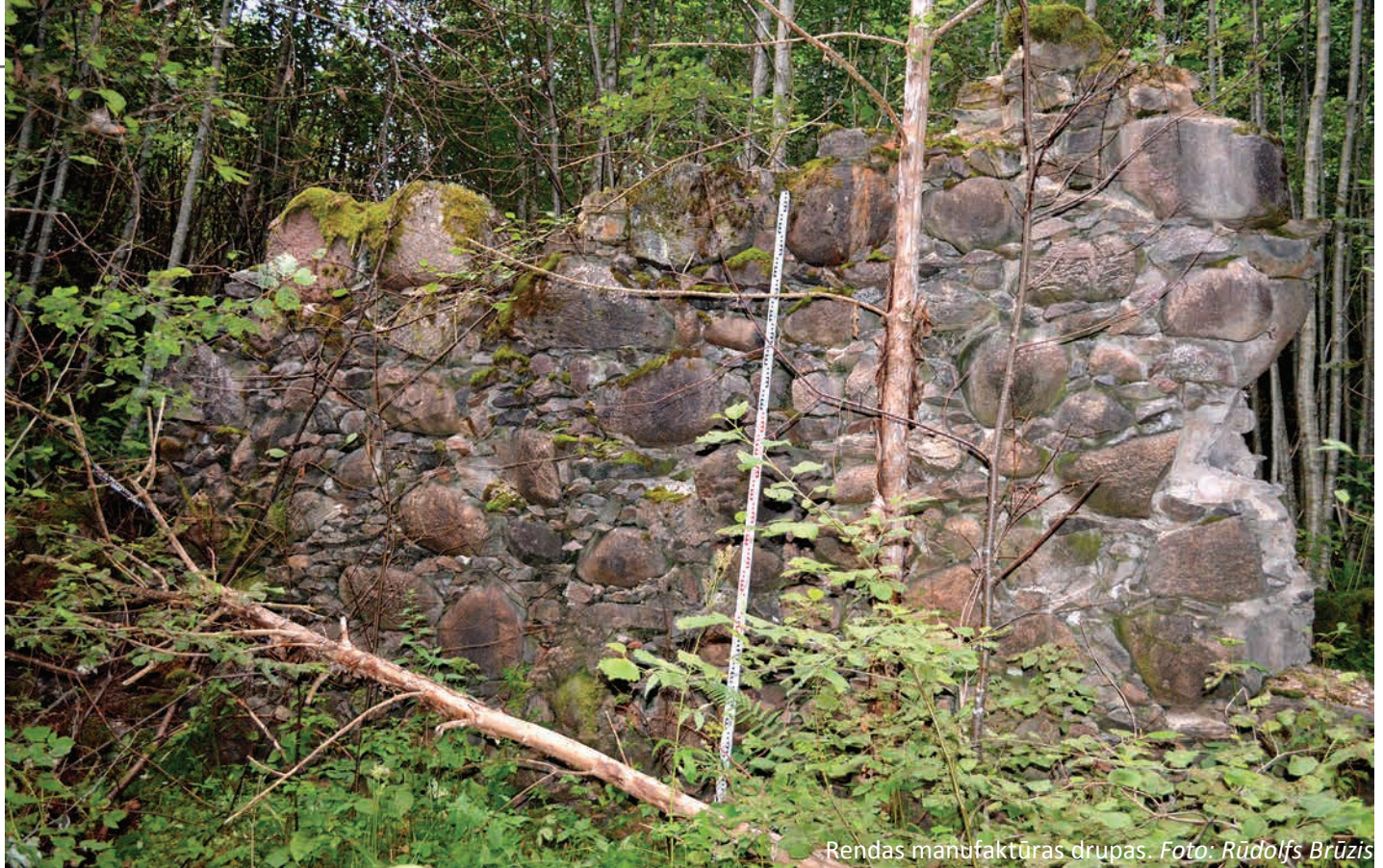
Rendas manufaktūras drupas.