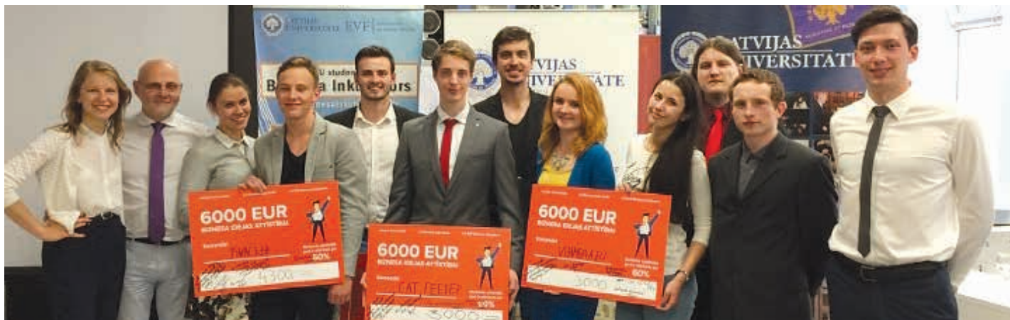
Iniciatīvas «Studenta uzņēmēja gars» uzvarētājkomandas kopā ar LU studentu Biznesa inkubatora un LU Biznesa ideju fonda komandu, 2015. gada jūnijs

zīmējumu 3D modeli un, izmantojot 3D drukas tehnoloģijas, izgatavot reālu objektu – suvenīru vai rotaļlietu. Idejas realizācijai komanda ieguva 2500 EUR, ar kuru palīdzību jau izveidojusi projekta mājaslapu un izstrādā mārketinga stratēģiju produkta virzīšanai.