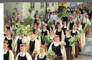
«Minjona» piedalās XXV Vispārējo latviešu dziesmu un XV deju svētku gājienā