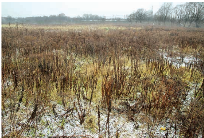
Vieta Torņakalnā, kur šobrīd jau ir uzbūvēts LU Dabaszinātņu akadēmiskais centrs, 2013. gada 27. novembrī