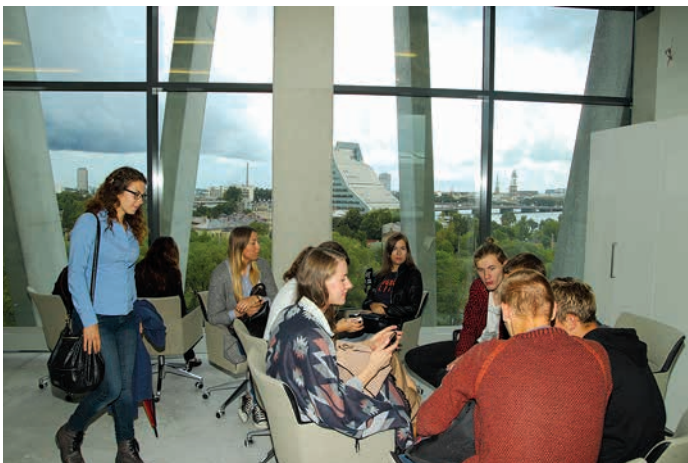
Studenti jaunatklātajā LU Dabaszinātņu akadēmiskajā centrā 2015. gada 7. septembrī

Ēkai ir universālā piekļuves sistēma, kas nozīmē, ka ar vienu atslēgu būs iespējams atslēgt visas telpas. Katrā telpā izvietoti gaismas slēdži, kas reaģē uz cilvēka klātbūtni. Ārējā dobē, kur aug vītenaugi, uzstādīta laistīšanas sistēma, kas darbojas automātiski. Savukārt dekoratīvais fasādes elements – dzelzsbetona žalūzijas – pilda vairākas funkcijas: kad ēku apspīd saule, tad dzelzsbetona žalūzijas daļēji noēno ēku, lai saule pārāk neuzkarsē stikloto fasādes daļu. Tas ir arī energoefektīvāk.