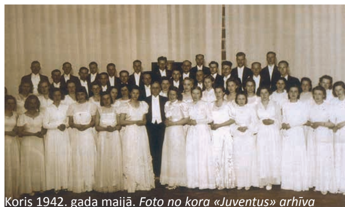
Koris 1942. gada maijā.

Pagājušogad 51. gadskārtu atzīmēja diriģenta Daumanta Gaiļa dibinātā Šašliku balle, kas bija pirmais jaunā «Juventus»