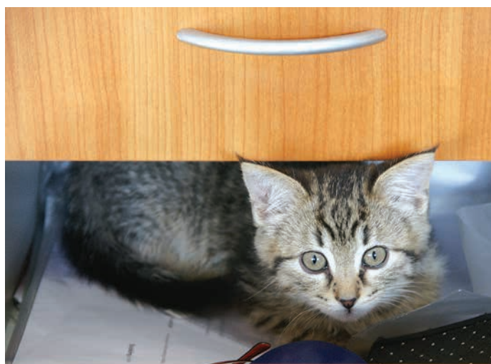
HZF kaķis Rainis.