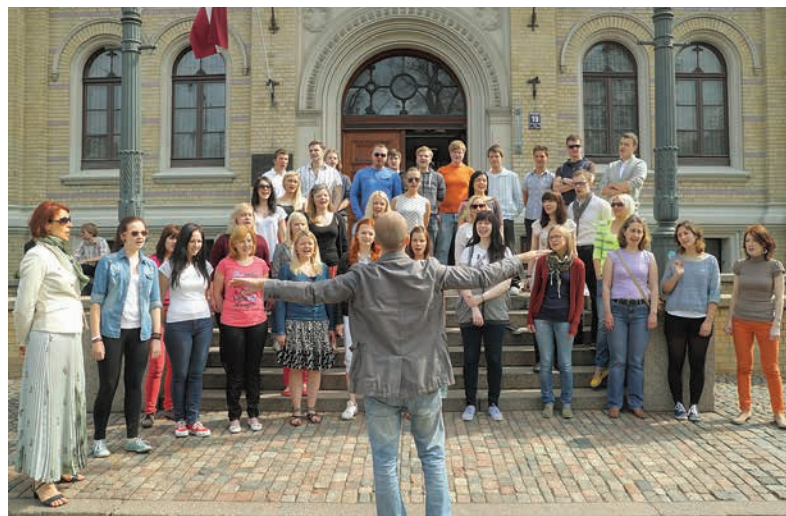
Latvijas Universitātes koris «Juventus» uzstājas pirms došanās uz IX starptautisko jaukto kora konkursu «Juventus 2013» Kauņā, Lietuvā