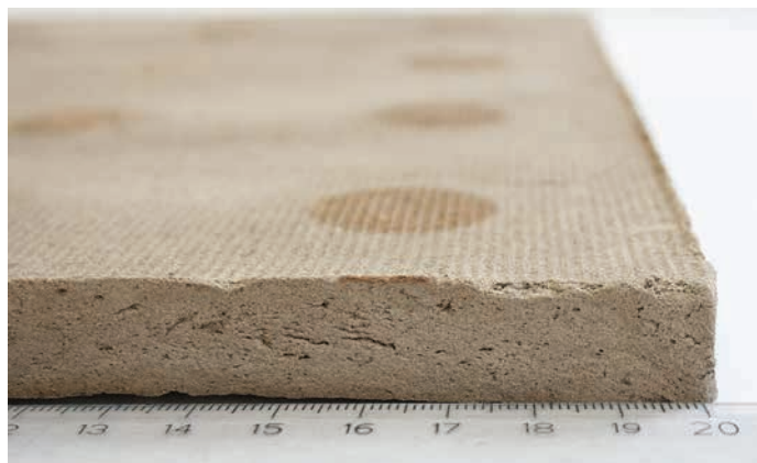
«SaproGlue» ar koksnes putekļiem.