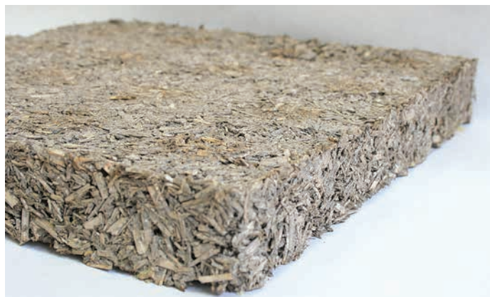
Kaņepju spaļi.