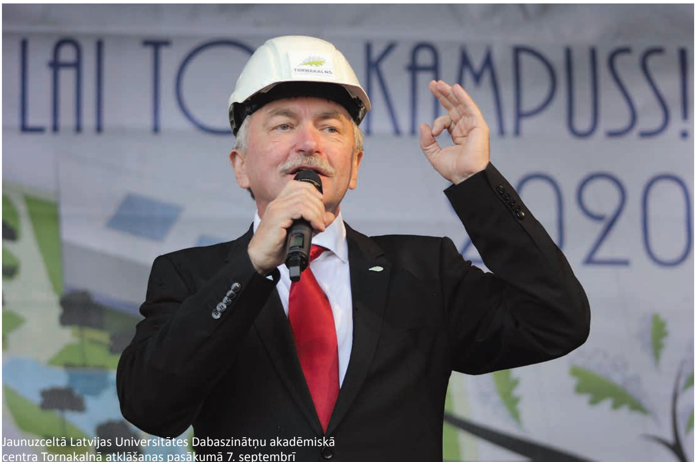
Jaunuzceltā Latvijas Universitātes Dabaszinātņu akadēmiskā centra Torņakalnā atklāšanas pasākumā 7. septembrī

Jārada starptautiski konkurējoša vide, tādēļ nozīmīga ir ne tikai studiju programma un pasniedzēji, bet arī infrastruktūra. Telpas, kur iepriekš atradās ķīmiķi, viennozīmīgi nebija konkurētspējīga studiju vide. LU akadēmiskais centrs Torņakalnā ir nozīmīgs sasniegums, kas pierāda, ka spējam izveidot modernu un studijām patīkamu vidi. Apmeklēju 18. novembra svētku koncertu, kur skolēni lasīja esesjas, ko viņi teiktu svētkos, ja būtu Valsts prezidenta amatā. Sarunā pēc pasākuma kāda 9. klases skolniece teica, ka bijusi Torņakalnā un ir pārliecināta, ka mācīsies dabaszinātnes. Tātad Torņakalns uzrunā mūsu potenciālos studentus! Attīstot studentu pilsētīņu tālāk, panāksim ne tikai studiju vides sakārtošanu, bet arī efektīvāku resursu izmantošanu. Tieša studenta un pasniedzēja saziņa ir ļoti svarīga, tikai