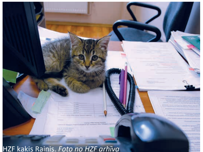
HZF kaķis Rainis.