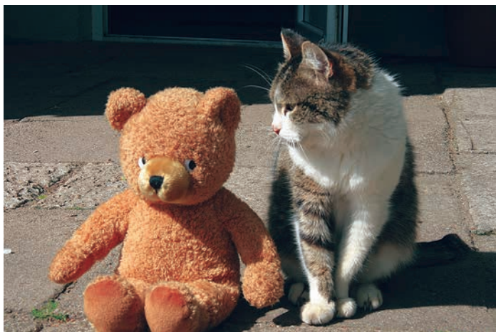
LU Botāniskā dārza Murene.

ka Murenei īpaši patīk sēdēt pie ozola, kas aug blakus Palmu mājai, jo tur ir daudz peļu alu.