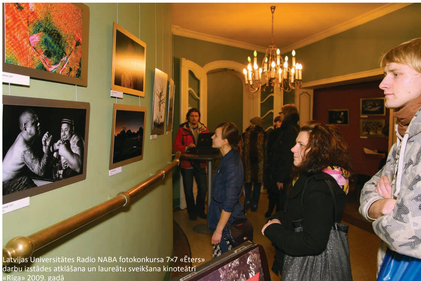
Latvijas Universitātes Radio NABA fotokonkursa 7x7 «Ēters» darbu izstādes atklāšana un laureātu sveikšana kinoteātrī «Rīga» 2009. gadā

Fotogrāfi galvenokārt vērtē gaismu kontrastu, centrējumu, krāsas, montāžu, turpretī radio un LU pārstāvji galvenokārt uzmanību pievērš kompozīcijai, vietas izvēlei, idejai, tēmas atbilstībai, kā arī sajūtām – konkursā tiek apbalvoti ne tikai kvalitatīvāko fotogrāfiju, bet arī labāko, oriģinālāko ideju autori. Kopumā žūrija skatās, kā konceptuāli fotogrāfija ir