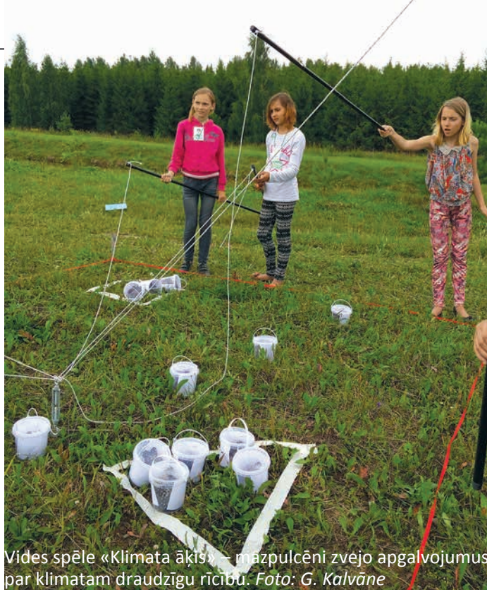
Vides spēle «Klimata āķis» – mazpulcēni zvejo apgalvojumus par klimatam draudzīgu rīcību.

Kopumā Gunta Kalvāne skolēnu zināšanas par klimatu un dabas procesiem vērtē kā zemas, jo tās esot fragmentāras – trūkst izpratnes par «lielo bildi». Tāpat gan skolās, gan sabiedrībā kopumā valdot uzskats, ka tas, kas būs pēc simt gadiem, uz mums neattiecas.