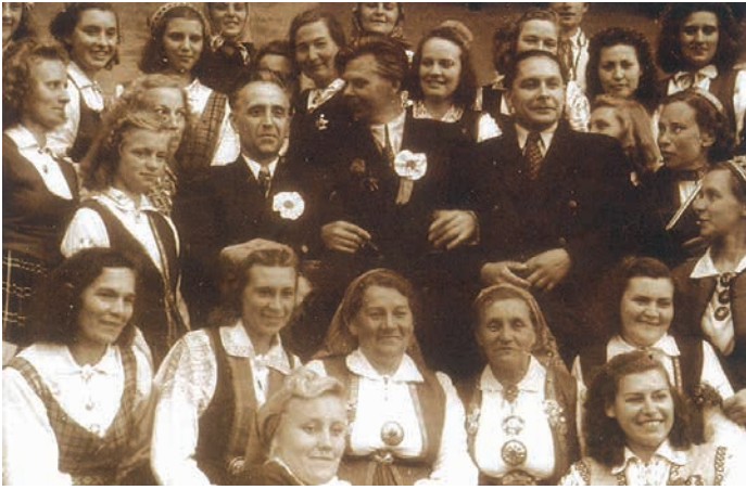
Pērnavā 1953. gada vasarā.

2014./2015. gada sastāva neoficiālais pasākums. Tā radusies tālajā 1963. gadā pēc toreizējā diriģenta viesošanās Armēnijā, jo koris vēlēties izvērtēt sava vadītāja ceļojumā iegūtās kulinārijas prasmes. Līdz pat mūsdienām tradīcija ir saglabājusies, tāpēc katru gadu oktobra pirmajās nedēļās koristes sadalās Gaļas griešanas meitenēs, Tomātu sulas meitenēs u. c., lai kopā pagatavotu īstenu armēņu šašliku.