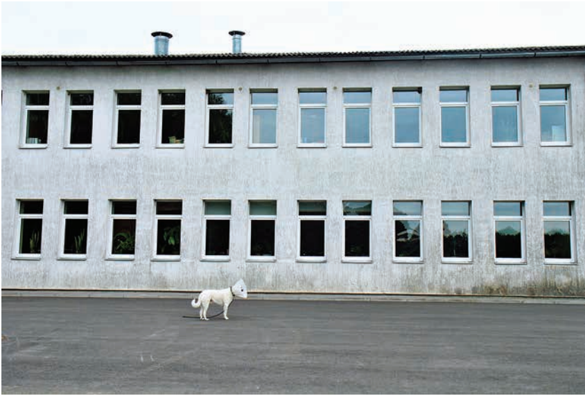
Katrīna Ķepule Hear me out