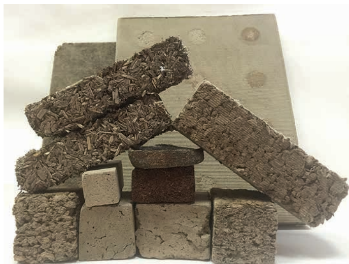
«SaproGlue» būvniecības materiālu prototipi.