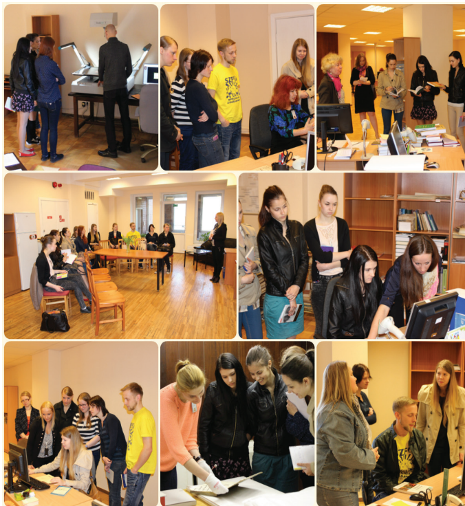
LU Sociālo zinātņu fakultātes Bibliotēkas Repoitārijā.

• 29. aprīlī LU Bibliotēkas Krājuma izmantošanas un attīstības departamentā Lielvārdes ielā 24 viesojās LU Sociālo zinātņu fakultātes Informācijas pārvaldības bakalaura studijas programmas 1. kursa studenti ar mērķi gūt priekšstatu par bibliotēkas darbu krājuma veidošanā un saglabāšanā. Studenti ne tikai saņēma informāciju par departamenta darbības virzieniem, krājuma veidošanas politiku u.c. jautājumiem, bet arī praktiski ieguva jaunas iemaņas informācijas resursu apstrādē. Mācību nodarbības noslēgumā studenti iepazīnās ar Reto izdevumu un rokrakstu kolekciju un viesojās LU Bibliotēkas Repoitārijā.