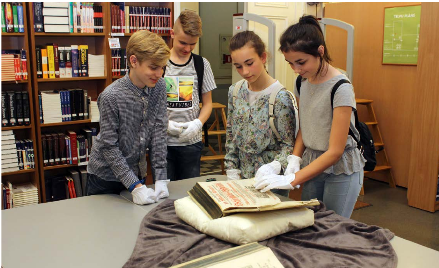
19. gs. senizdevumu drīkst uzmanīgi pārlapot, izmantojot kokvilnas cimdsus.

Ja arī jūs vēlaties piedalīties kādā no LU Bibliotēkas rīkotajiem pasākumiem, aicinām sekot LU Bibliotēkas informācijai . Būsiet laipni gaidīti!