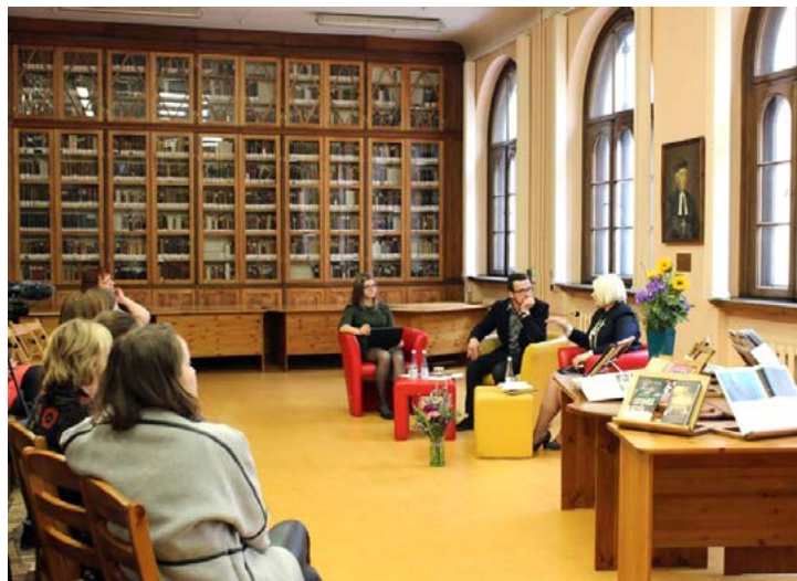
Dzejnieku diskusija pasākuma gaitā.