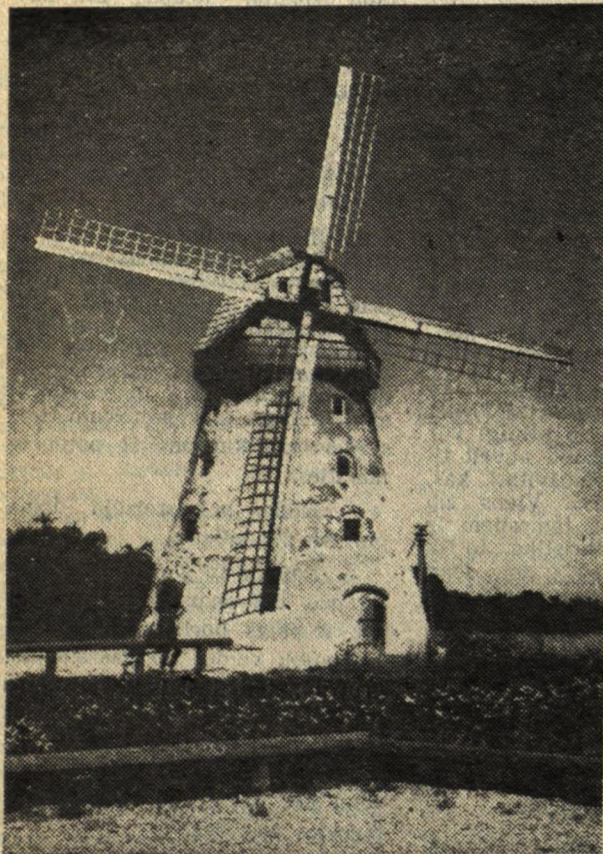
* Drabešu vējdzirnavas.