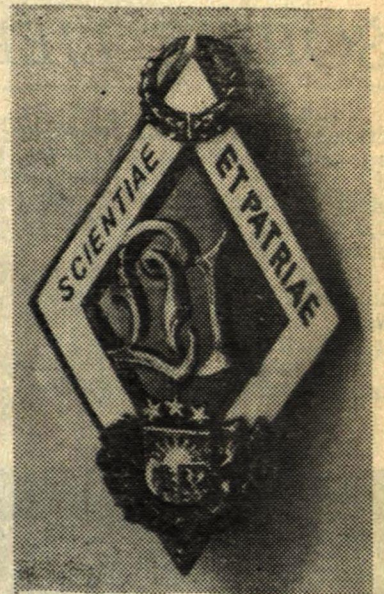
* LU absolventa nozīme.

Nozīmes, īpaši dārgmetāla, varētu iegādāties no personīgiem