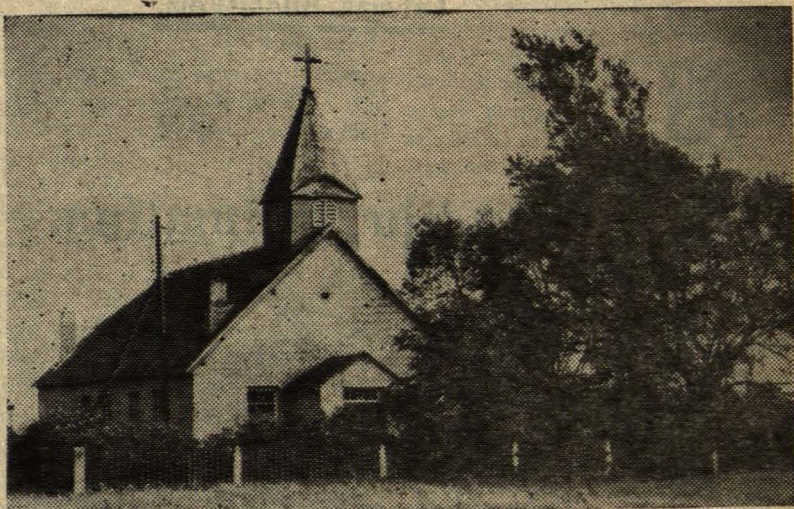
* Rolātu baznīca.

straumes (upes) lejtecē. Pašreiz — Bārtas lejtecē.