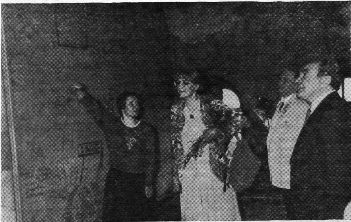
* Iepazīšanās ar kādreizējo studentu soda izciešanas vietu — Universitātes karceri.

Tieslietu sistēmā advokātiem ir svarīga loma. Tiesiskā valstī advokātiem kā grupai jāstāv pilnīgi brīviem no pārbūves iestāžu darbības. Advokāts ir atbil-