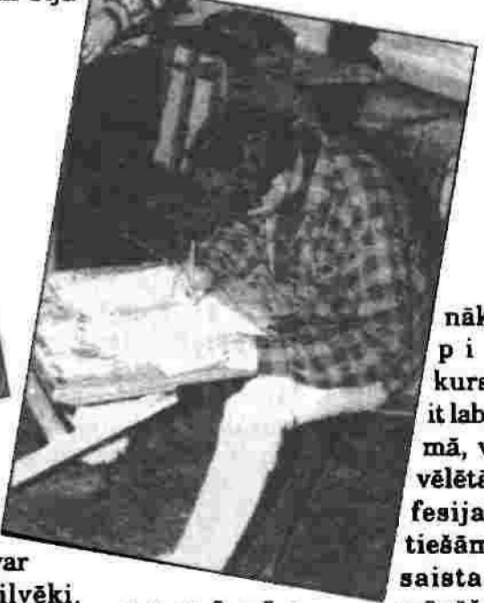
Lai nākamie pirmkursnieki it labi izdomā, vai izvēlēta profesija patiešām piešķir prieku.

n e m ā c ā s m ā c ī š a n ā s p ē c, b e t a r l i e l u i n t e r e s i, k ā t o d a r ā m m ē s!