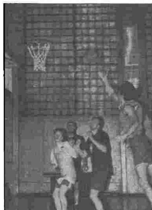
Sporta pedagoģijas zēni rāda ko var spēlēt par 1. vietu – ar fizmatiem