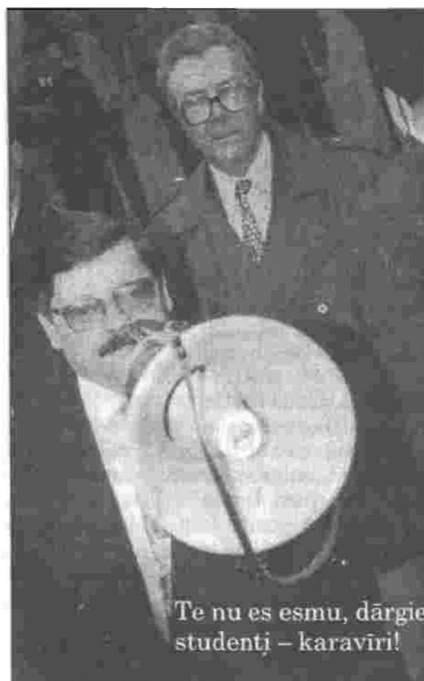
Te nu es esmu, dārgie studentj - karavīri!