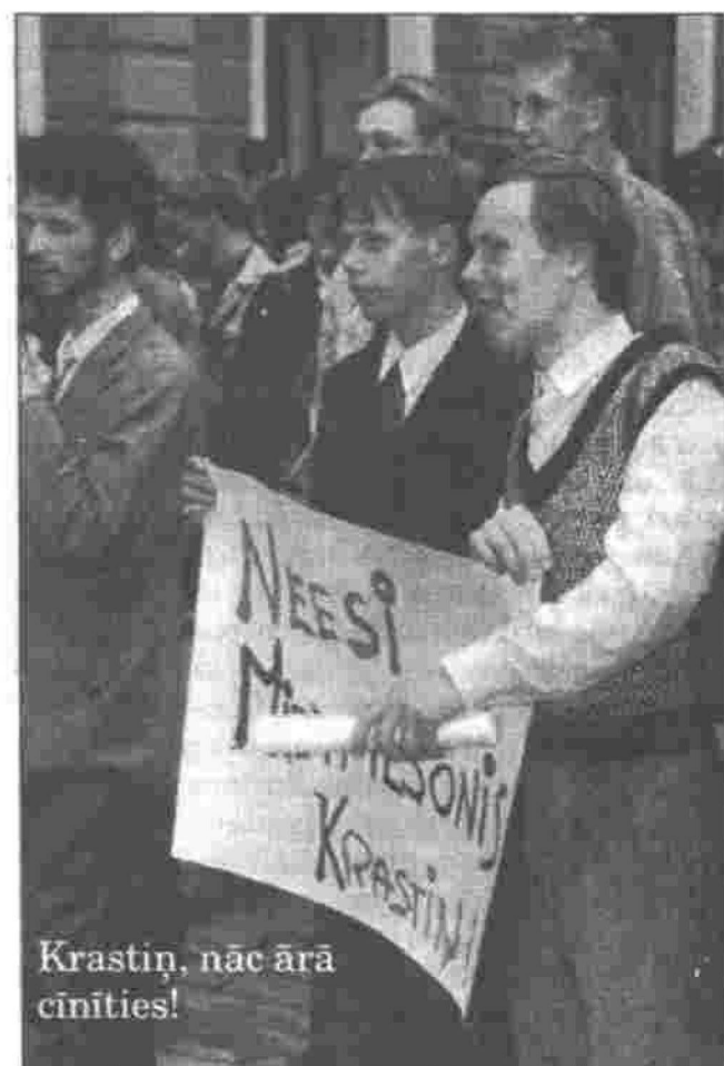
Krastiņ, nāc ārā cīnīties!