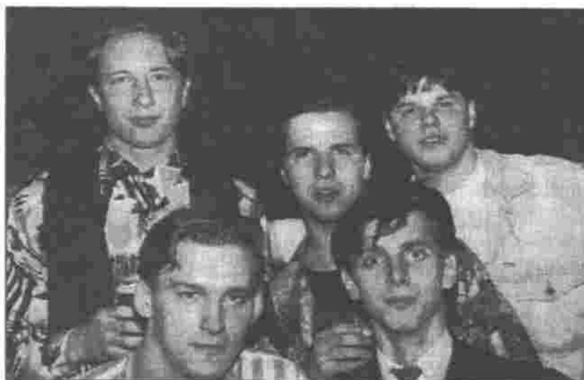
Šie puisi vienmēr teiks: "AIESEC – tas ir kolosāli!"

Savukārt pasākuma organizētāji uzskata, ka savu galveno mērķi – informācijas apmaiņu starp studen-