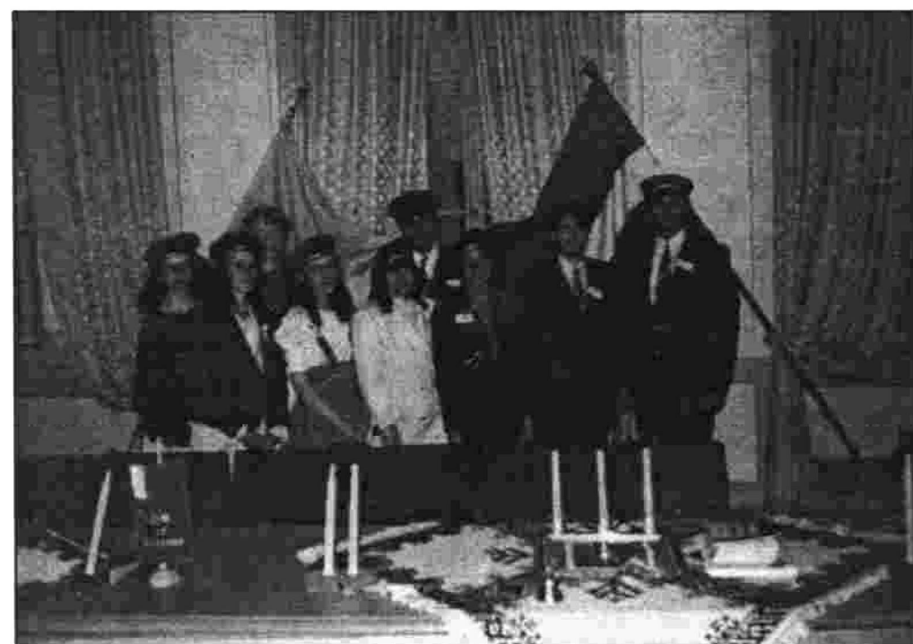
"Dzintara" jaunie krāsneši 1993.g. Reiterņa namā

Latvijas "Dzintars" uztur sakarus ar dāņu jauno katoļu organizāciju. Pagājušajā gadā notika dzintariešu organizētā dāņu-latviešu jauniešu nometne Subatē. Tajā varēja izglīties,