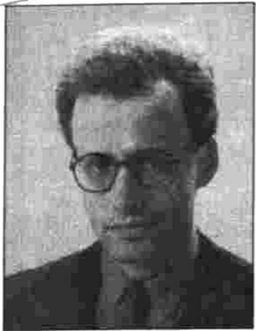
(Turpinājums no 1. lpp.)

Atradu savas iespējas kustībā "Latvijai". Tā ir labēji orientēta partija, kas ir par tirgus ekonomiku. Tajā pat laikā, nostājoties pret pārprastām tās izpausmēm, kad notiek valsts īpašuma izvazāšana un arī liela mēroga dažādas finansiālas afēras, "Latvijai" iestājas par godīgumu. Šis partijas kristīgi sociāli konservatīvā nostāja man kā kristietiem, ir ļoti svarīga. Tajā redzu pamatu savai darbībai, un politiski centīšos stiprināt šo spēku.