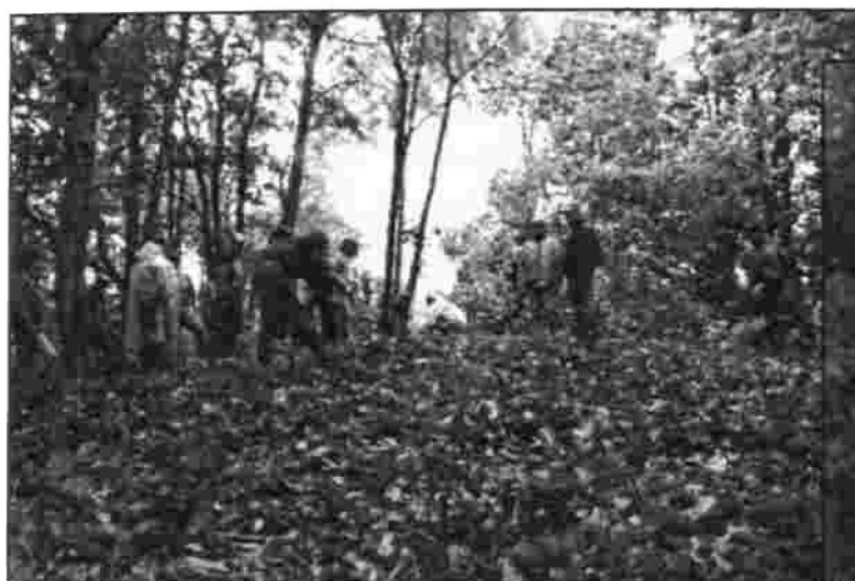
Strādājot Sērpiņu pilskalnā, kopējā devīze bija: "Ikvienam roka jāpieliek..."

Viesīte – līdz šim man nezināma vieta Latvijā. Tagad iepazīta un liekas jauka, sakopta un sirsnīga, jo ļoti viesmīlīgi ir tās ļaudis. "UA" uz turieni doties pa-