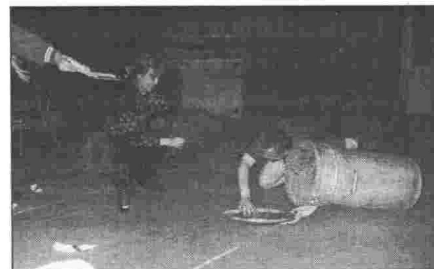
Savas radošās spējas pašpārvalžu dalībnieki apliecināja, iestudējot priekšnesumus un spēles, piemēram, atveidojot Annas Saksas ziedu pasakas.