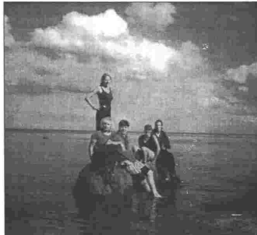
Uz akmeņiem jūrmalā satupuši Ekonomikas fakultātes pašpārvaldes pārstāvji. Viņiem ir par ko smaidīt – citas fakultātes no viņām ir mācījušās, un pašpārvalžu darbs LU ir aktivizējies.

Vasarā nesnauda arī LU Studentu Padome. Lai kalpu jaunus plānus šim mācību gadam un labi atpūstos, no 5. līdz 7. jūlijam Studentu Padome kopā ar fakultāšu pašpārvaldēm un studentu organizāciju pārstāvjiem rīkoja radošu atpūtas semināru Engurē.