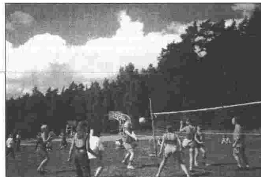
To, kura pašpārvalde ir visstiprākā, visātrākā un visveicīgākā, palīdzēja noskaidrot sporta spēle. Pārsteigumu nebija – uzvarēja draudzība.