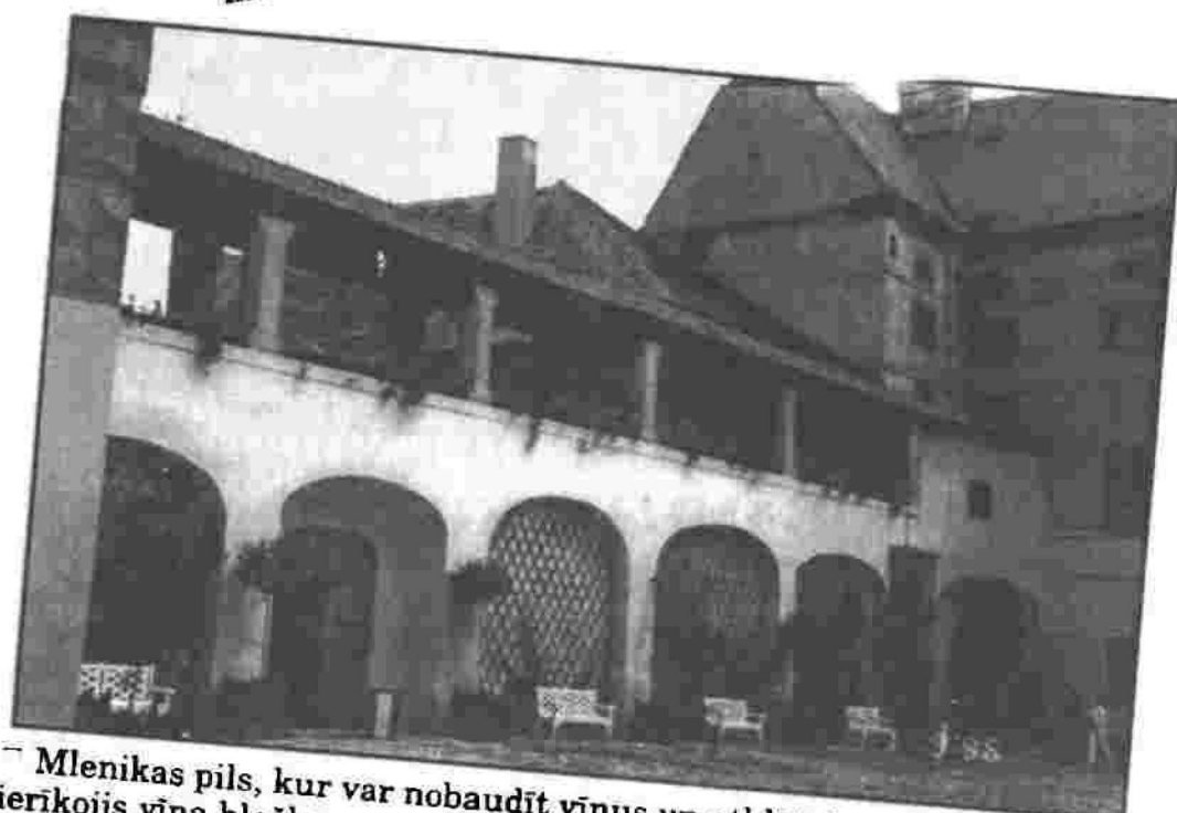
□ Mlenikas pils, kur var nobaudīt vīnus un atklāt, ka pils namatēvs ierīkojis vīna blašķes grāmatas maketā, lai sieva neredzētu.

□ Strahovas klostera Filosofiskajā zālē var atrast senu Eiropas karti, kur Eiropa attēlota kā jaunava un Prāga kā tās sirds.