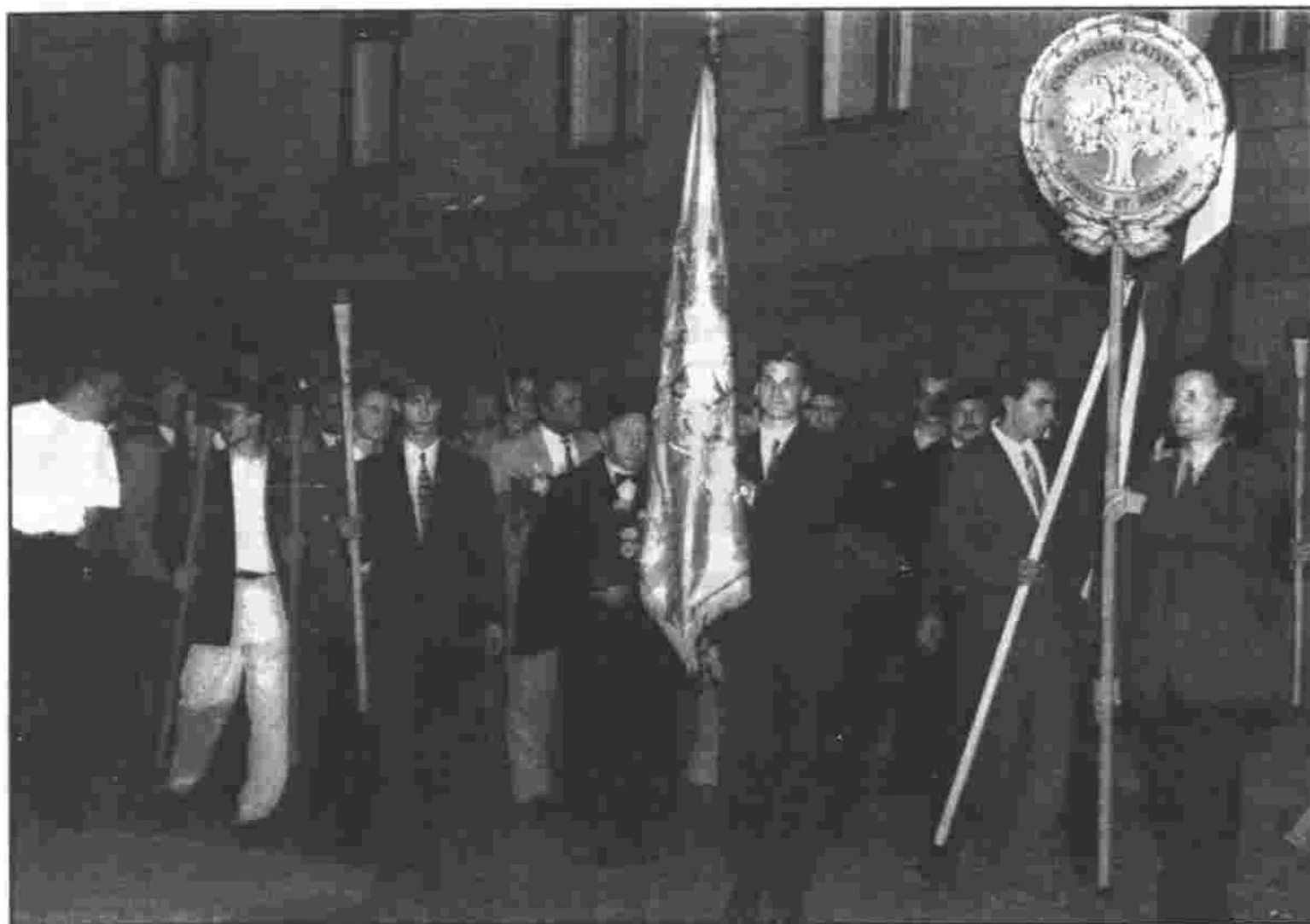
Jaunā studenta svētkos '96

ta attiecības" jeb "ģedovščina" Neticami mežonīga, aizvēsturiska parādība, kuras apzīmēšanai latviešu un citās eiropiešu valodās pat nav attiecīga vārda – gluži tāpat, kā nav adekvātu vārdu krievu "matam"