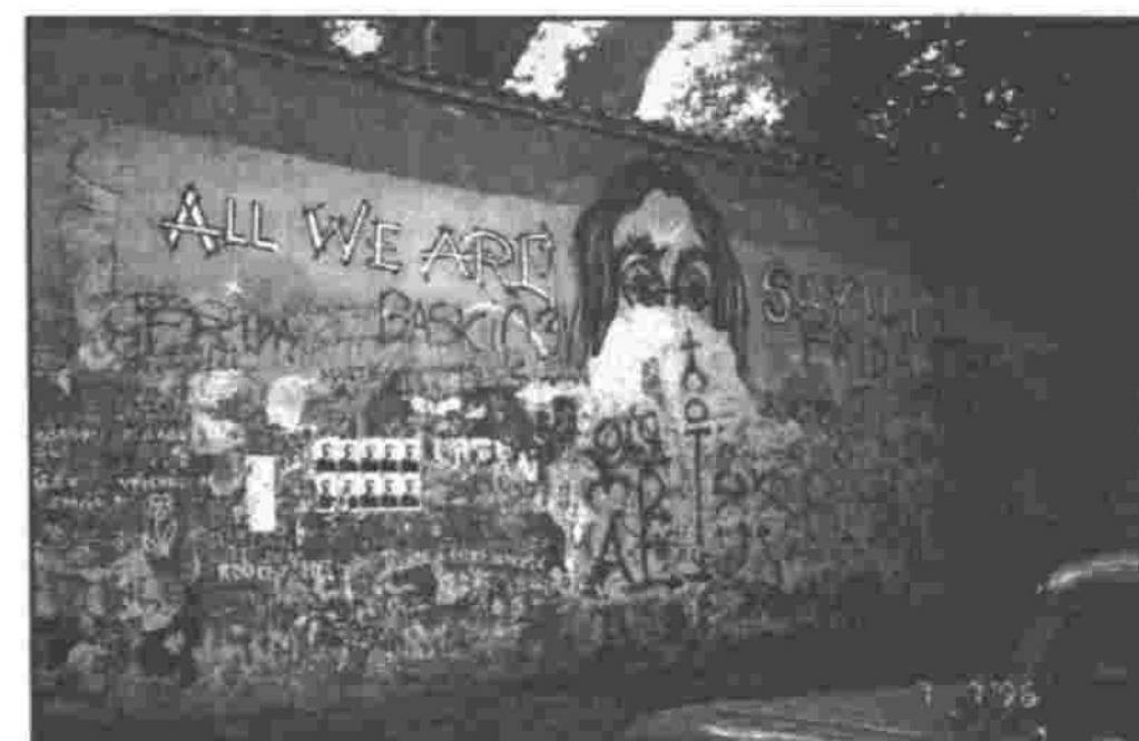
□ Džona Lenona siena – piemineklis brīvībai

□ Bitlu dziesmas un pantomīma, un dejas, un lelles – tas viss Prāgā saucas "melns teātris"