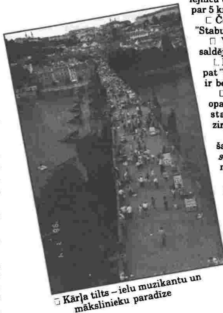
□ Kārļa tilts – ielu muzikantu un mākslinieku paradīze

□ Prāgu nakti var izjust, nopērkot pudeli vīna un baudot to divvientulībā uz Kārļa tilta.