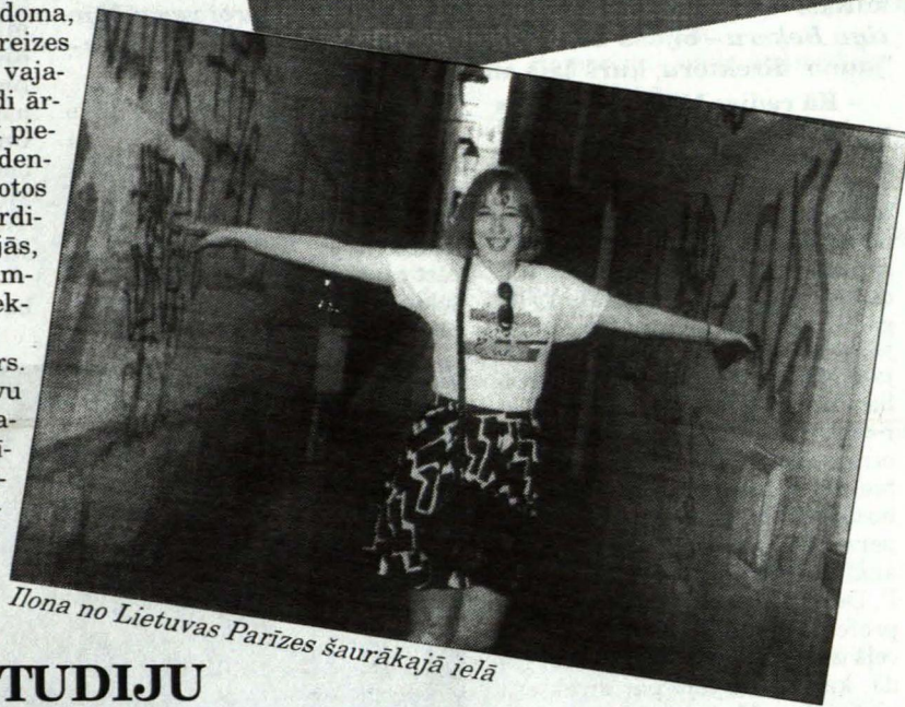
Ilona no Lietuvas Parīzes šaurākajā ielā

MĒS ŠAJĀ PASAULĒ – AR SAVĀM DOMĀM, ILGĀM, TICĪBU, DROSMI, BAILĒM