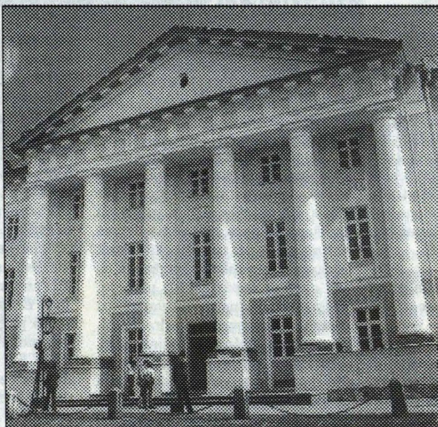
(Turpinājums 2. lpp.)

Profesors Aadu Musts referātā iztirzāja galvenās problēmas Igaunijas un Latvijas vēstures izpētē. Tartu Universitātes mācībspēki ir pētījuši kopīgo starp mūsu vēsturniekiem, kādas ir igauņu un latviešu vēsturnieku problēmas. Kā galvenā problēma tika minēts paralēli veikts darbs, vienam otru nezinot, bet, izmantojot vienus un tos pašus materiālus. Rezultātā var pat rasties