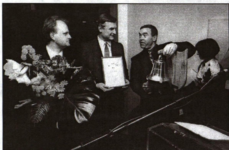
Prēmijas ieguvēji a/s "DATI" pārstāvji

Vācijas Tautsaimniecības prēmiju - 1500 latus šogad saņēma a/s "Dati". Konkurss par prēmiju piedalījās 33 firmas. Žūrijas komisija par labāko atzina to firmu, kurai vissekmiīgāk veicies darbs ar sadarbības partneriem Vācijā.