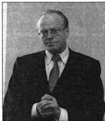
Viesu vidū arī LR tieslietu ministrs Valdis Birkavs