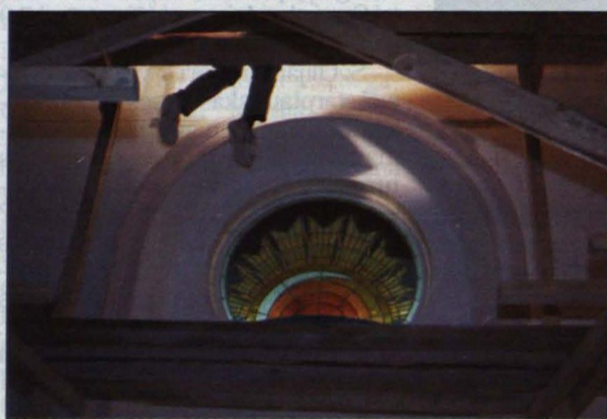
Remonts Lielajā aulā