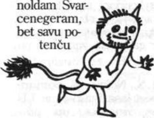
... lai vīrietis pēdējā brīdī nenozustu, nenoziepētu asti

Tas nenozīmē, ka viņam jālidzinās Arnoldam Švarceneram, bet savu pothenču