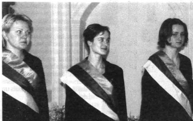
Korp! SPĪDOLA prezidijs

Bez SPĪDOLAS ir vēl 12 studentu korporācijas, 23 studentu korporācijas un piecas akadēmiskās organizācijas.