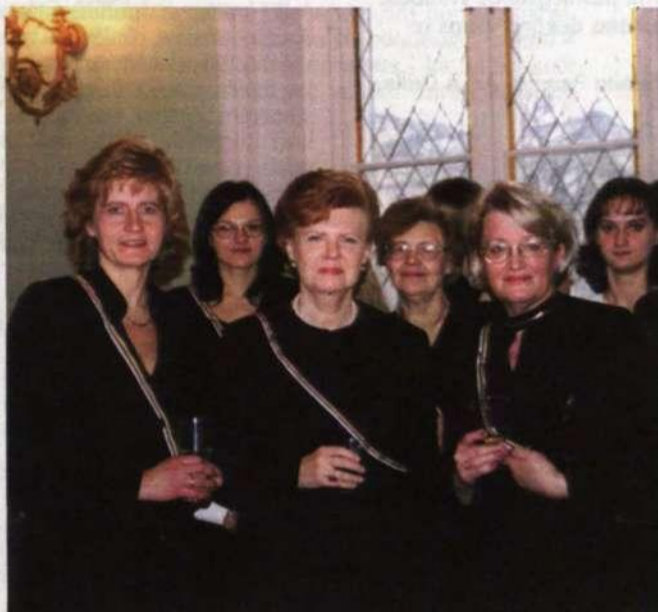
SPĪDOLAS saimē ir arī Valsts prezidente Vaira Viķe - Freiberga (otrā no kreisās)

Korporācija ir kā ģimene - draudzība un atbalsts, piederības izjūta. Tā ir iespēja satikt personības, cilvēkus 18 līdz 84 gadu vecumā, kuri studējuši un strādājuši visos iespējamajos amatos. Tad, kad tikko esi sācis studēt, korporācija ir vislabākais veids, kā iejusties akadē-