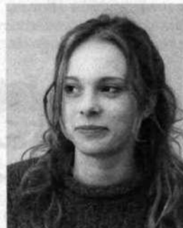
Inese, teoloģijas un reliģijas zinātnes studiju programma

Vieta, par kuru te, Universitātē, varētu teikt, ka man tā patīk, būtu datorklase. Tajā uzturos patiešām bieži.