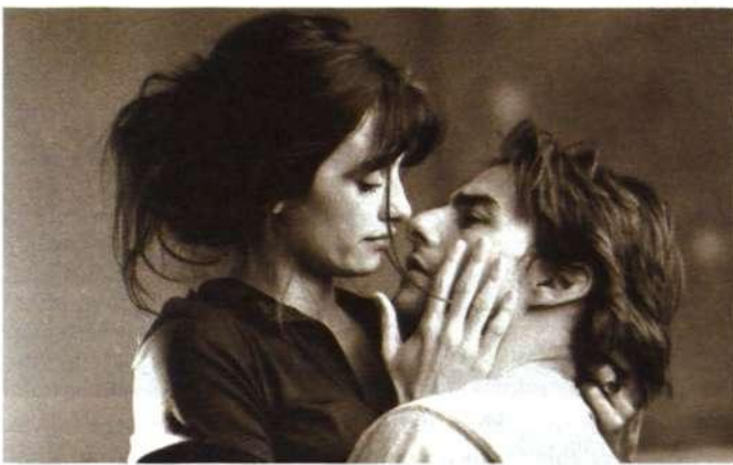
Kadrs no filmas "Vanīļas debesis"

Pavasariņi jauku laiku, milētājiem partnerus, suņiem suņu mātes un konkursantiem konkursus! Tā tas ir bijis, un tā tam būs būt. Pakļaujoties vispārējai likumsakarībai, kārtējais kinokonkurss. Nekas nav mainījies, un, tāpat kā parasti, arī šoreiz "Baltic Cinema" piedāvā nu jau triju filmu apskatu. Bet nu par visu pēc kārtas.