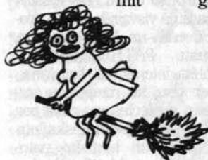
... feministiskā kustība bieži sevi nostāda riebigā pozīcijā

Par sievieti Bibelē ir teikts: "Daiļums viņ, un skaistums paiet!" Kad tu redzi pie melniem mūkiem draiskules divdesmit divu, trīsdesmit gadu