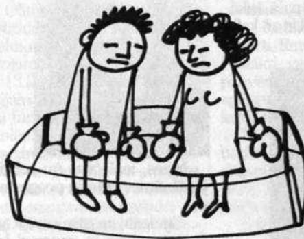
... viss pārvēršas par placdarmu, kurā ierodas divi noguruši radījumi

sūtīja tos pie Ādama, lai viņš dotu tiem vārdus. Vispirms Dievs iemācīja Adamam apkopt Ēdenes dārzu. Adamam bija jāmekā strādāt un būt atbildīgam par to, ko viņš dara. Tikai tad, kad viņš kādu laiku bija nostrādājis Ēdenes dārzā, kad viņš Dieva tuvumā neatrada sev līdzīgu, tikai tad Dievs viņam teica: "Cilvēkam nav labi būt vienam!" un iedeva pasaulē sievieti. Ādams bija nobriedis par vīrieti, kam varēja uzticēt sievieti. Un vēl. Vispirms notika iepazīšanās, nevis: "Wow, tu biji satriecoša! A kā tevi sauc?" Tusiņos tā var gadīties, bet Ēdenes dārzā tā nebija.