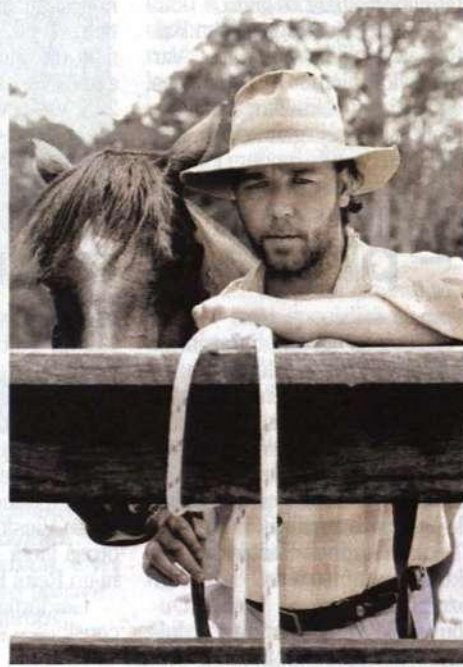
Kadrs no filmas "Brīnišķīgais prāts"

Tas nu pagaidām. Tā kā slēpt adresi ir bezjēdzīgi, atbil-