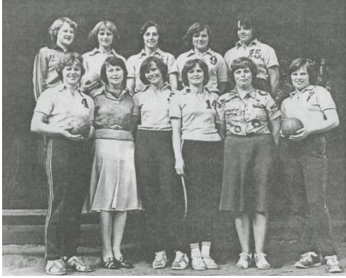
LPSR čempiones LVU rokasbumbas sieviešu komanda.1977.g.