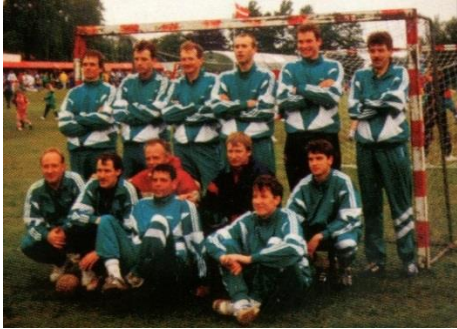
LU vīriešu komanda-handbola festivāla uzvarētāja, 1998 gads Dānijā

Laikā no 1983.gada līdz 1993.gadam vīriešu komanda 4 reizes bijusi LASK čempionu godā.