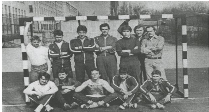
Starptautiskā turnīra uzvarētāja LVU rokasbumbas komanda, 1978.gads. Kišiņeva (Moldova).

1970.gadā tika sasniegti pirmie lielākie panākumi – komanda pirmo reizi iekļuva republikas meistarsacīkšu augstākajā līgā.