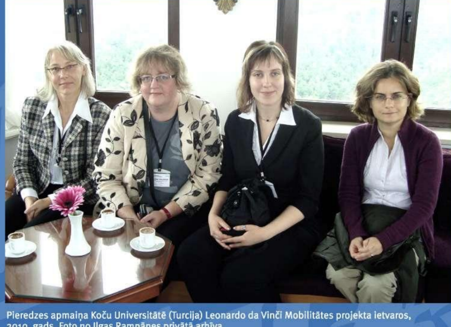
Pieredzes apmaiņa Koča Universitātē (Turcija) Leonardo da Vinči Mobilitātes projekta ieviešanā, 2010. gads.

LU Bibliotēkas pārstāvji regulāri piedalās dažādās konferencēs/semināros gan Latvijā, gan ārzemēs. LU Bibliotēka organizē konferencēs/seminārus/diskusijas bibliotēku darbinieku profesionālai pilnveidei, akadēmisko un pētniecisko iestādē personālam. Tāpat kopīgas konferencēs/semināri/diskusijas katru gadu tiek organizētas sadarbībā ar LU Sociālo zinātņu fakultāti un LU institūtiem.