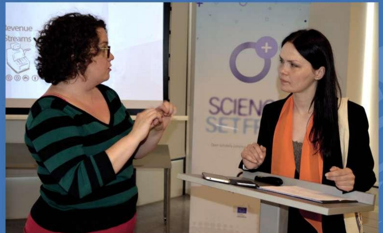
OpenAIRE: Advanced Latvia organizētais seminārs, 2018. gads.