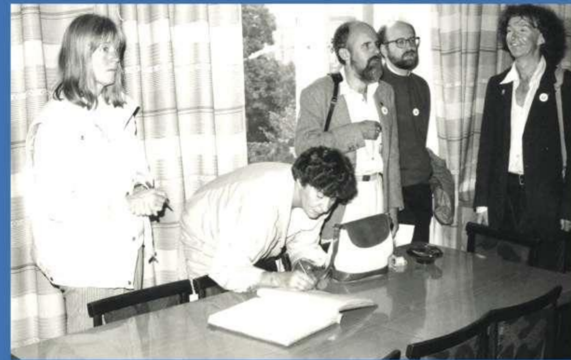
Zviedrijas bibliotēkai LU Zinātniskajā bibliotēkā, 1991. gads.