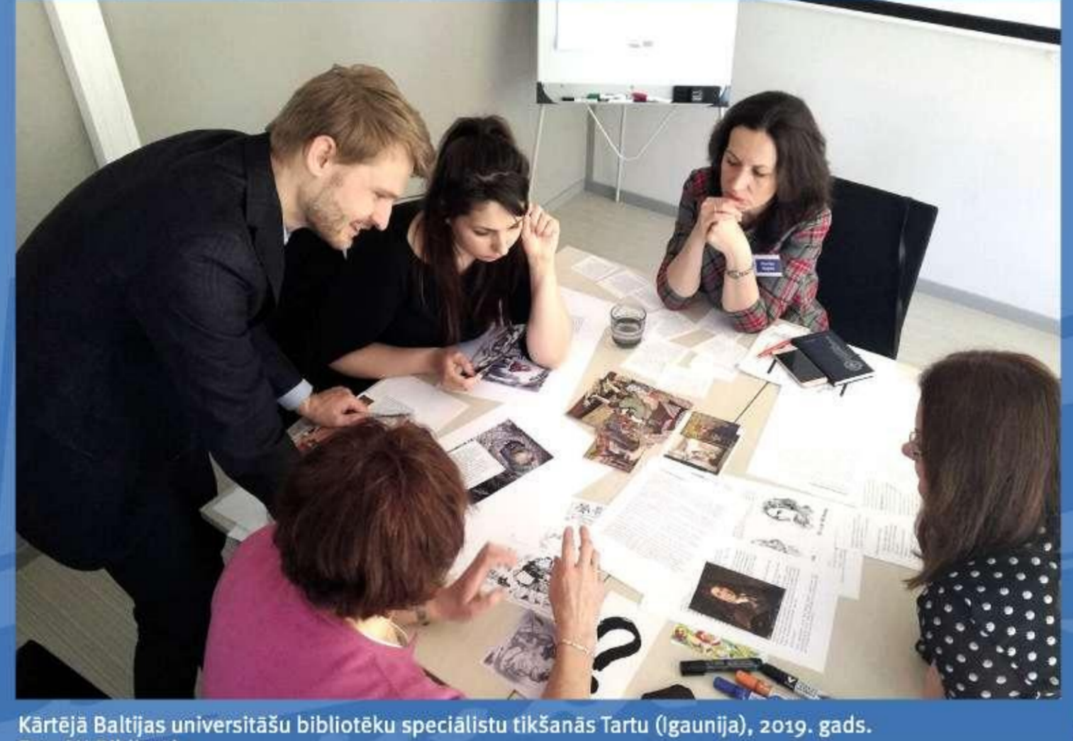
Kijvā Raiļas universitāšu bibliotēku speciālistu tikšanās Tartu (Igaunija), 2019. gads.