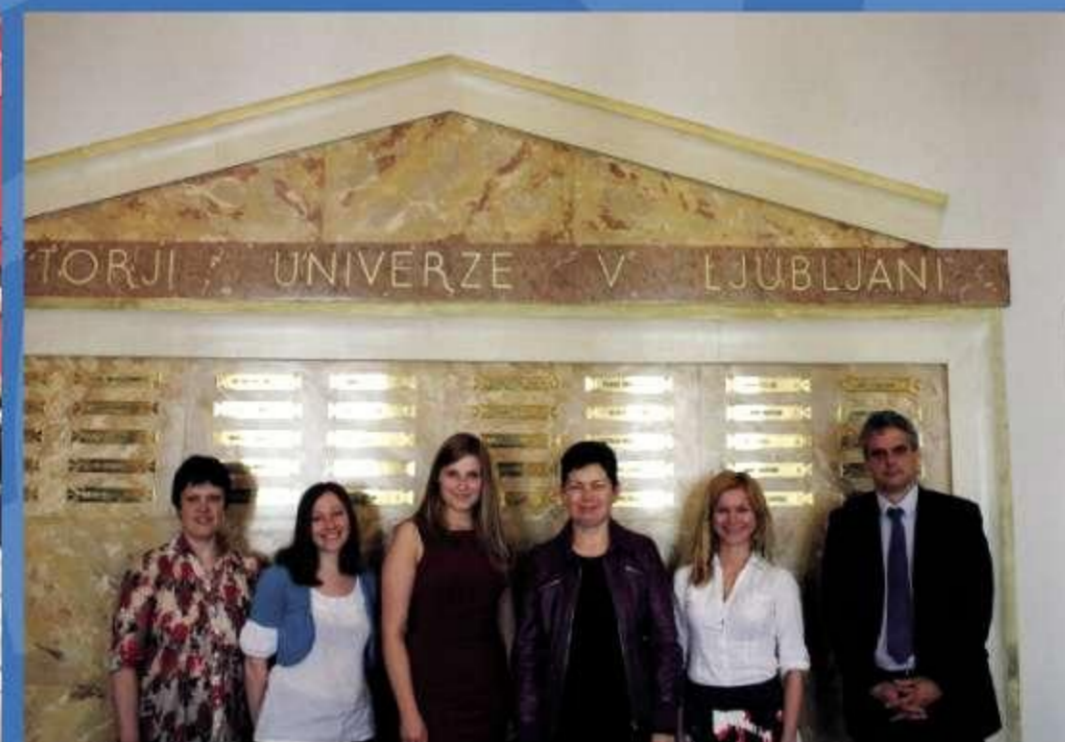
Pieredzes apmaiņa Slovākijā Leonardo da Vinči Mobilitātes projekta ieviešanā, 2012. gads.