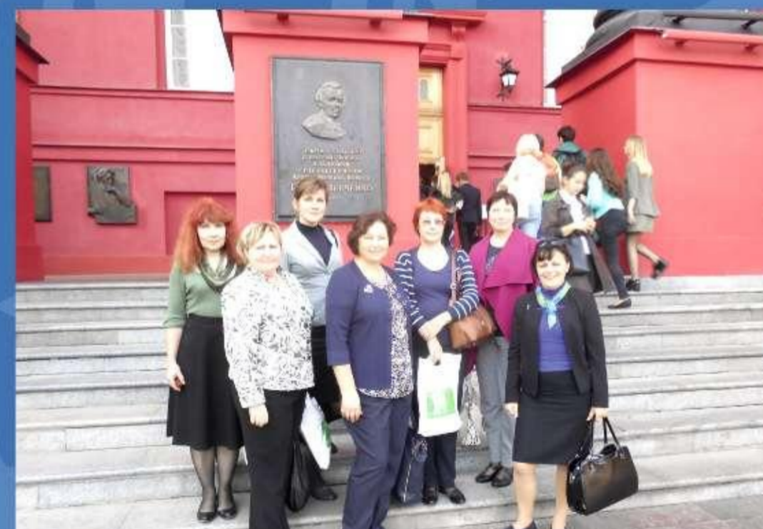
Kijvā (Ukraina), 2016. gads.