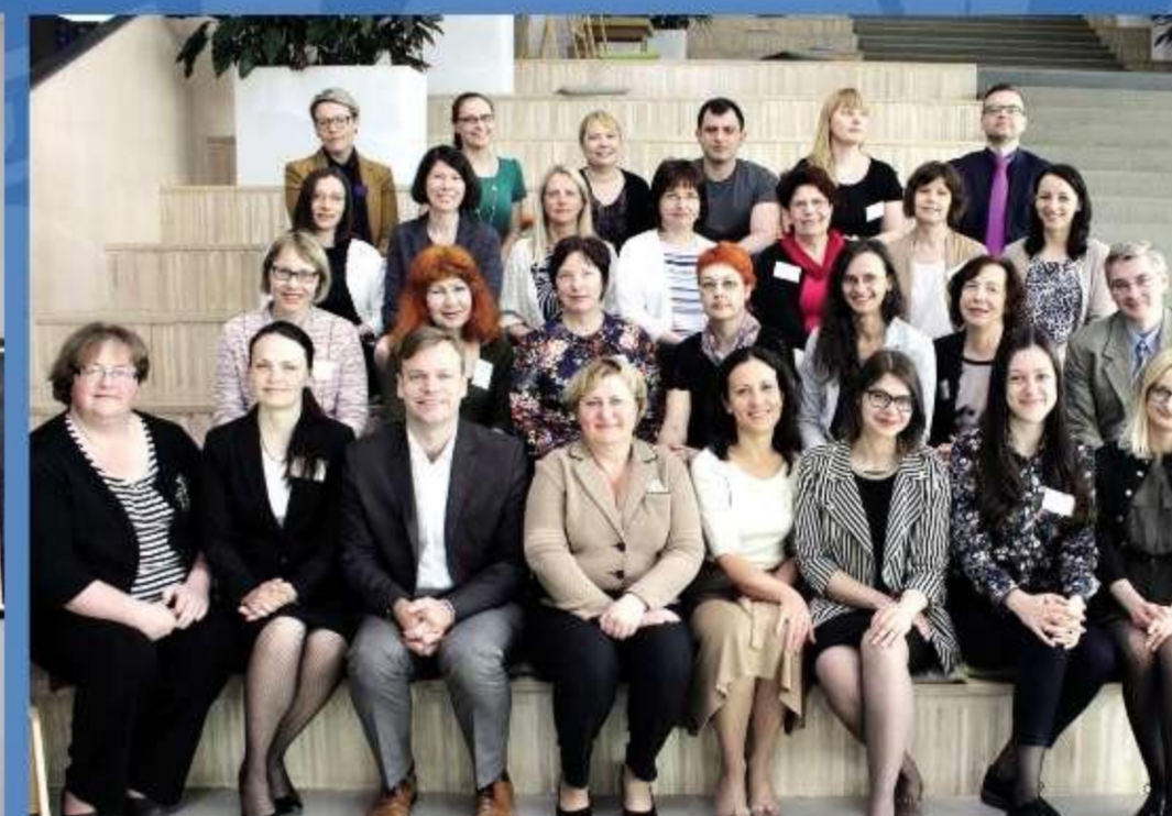
Raiļas universitāšu bibliotēku speciālistu tikšanās Rīgā Arvīta Zindne, atvērta universitāte un atvērta pils, 2017. gads.