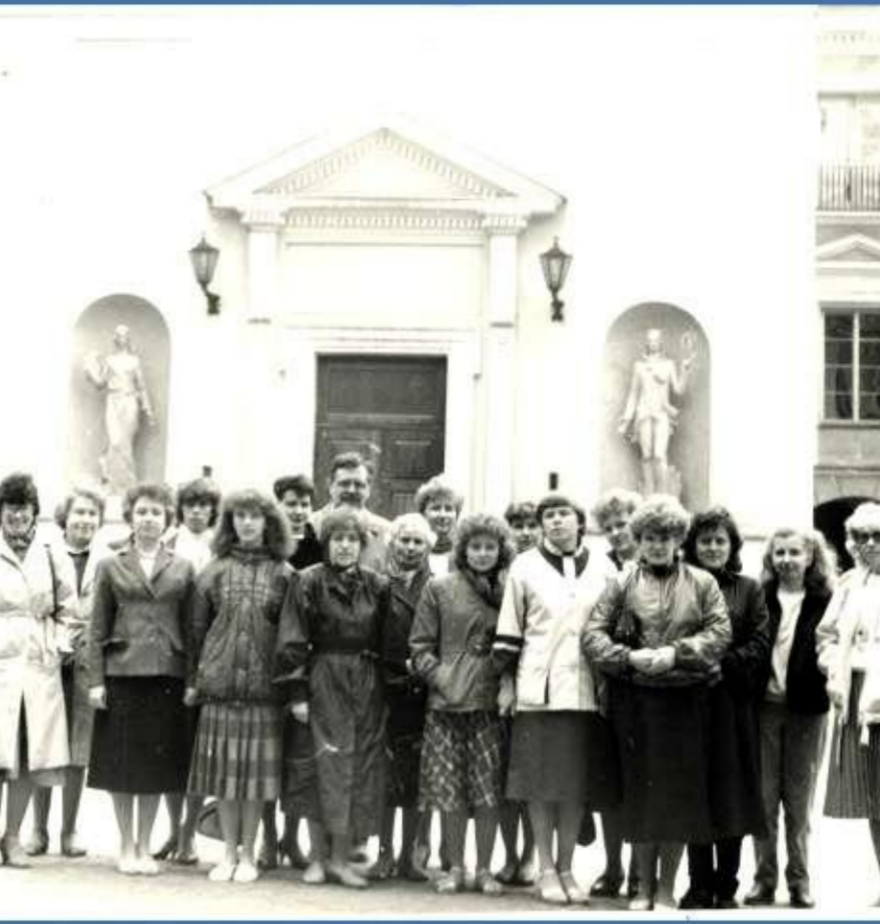
LU Zinātniskās bibliotēkas kolektīva pieredzes apmaiņa Vīļā, 1976. gads.

Latvijā ik dienas ir sūtītiem lasītāji. Šeit sagatavo lekcijas profesori un lektori, šeit ierodas studenti, no visiem desmiti fakultāšu. Bibliotēkā ir vairāk nekā 870 tūkstoši grāmatu visdažādākās zinātnes nozarēs.