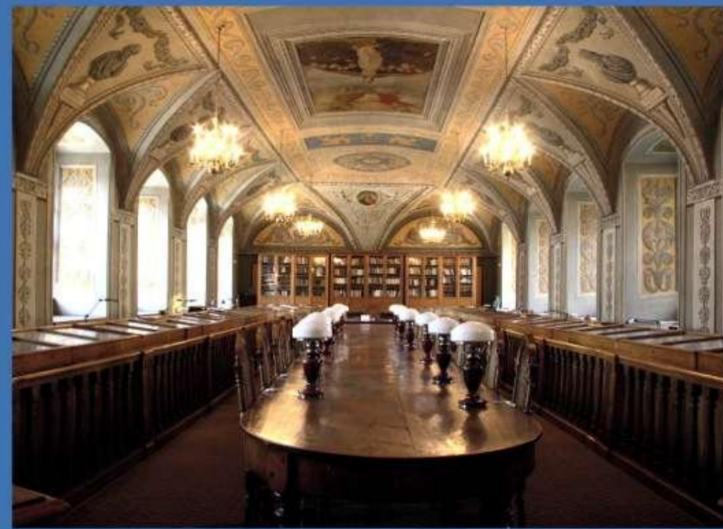
Vīļas Universitātes bibliotēka.