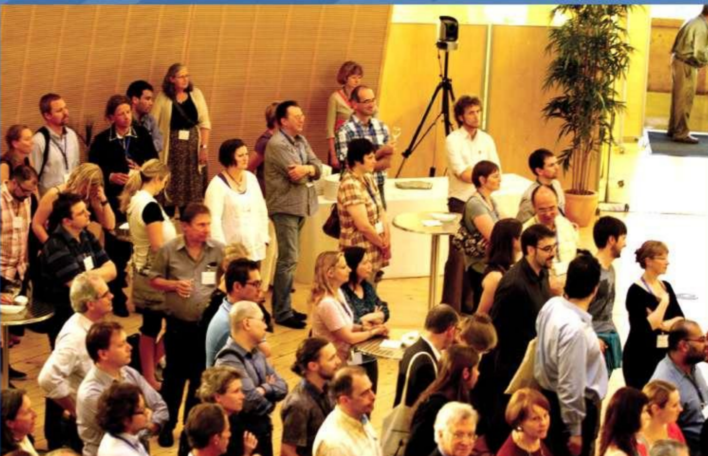
CERN seminārs par inovācijām zinātniskajā komunikācijā Žemica (Slovēnija), 2011. gads.

LU Bibliotēkas pārstāvji regulāri piedalās dažādās konferencēs/semināros gan Latvijā, gan ārzemēs. LU Bibliotēka organizē konferencēs/seminārus/diskusijas bibliotēku darbinieku profesionālai pilnveidei, akadēmisko un pētniecisko iestādē personālam. Tāpat kopīgas konferencēs/semināri/diskusijas katru gadu tiek organizētas sadarbībā ar LU Sociālo zinātņu fakultāti un LU institūtiem.