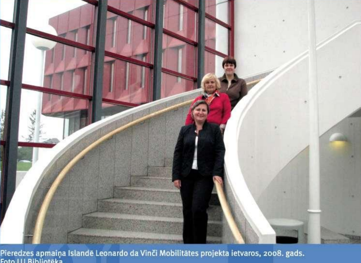
Pieredzes apmaiņa Islandē Leonardo da Vinči Mobilitātes projekta ieviešanā, 2008. gads.