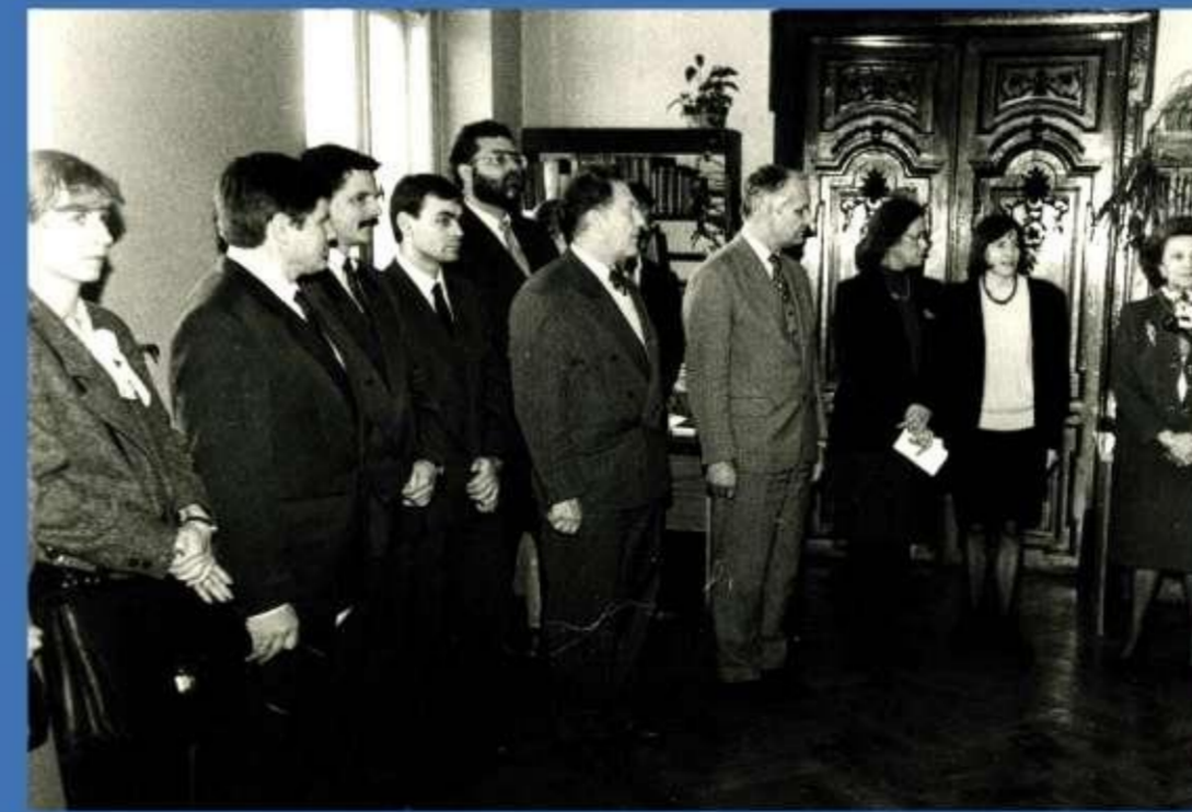
Francijas parlamentāriešu dāvinājumu izstādes atklāšana Lasitavā, Kalpaka bulv. 4, 1992. gads.

Noslēgti sadarbības līgumi ar Vīļas, Tartu, Poznaņas Universitāšu Bibliotēkām, M. Dragomanova Nacionālās pedagoģiskās universitātes Zinātnisko bibliotēku, Latvijas Nacionālo bibliotēku.