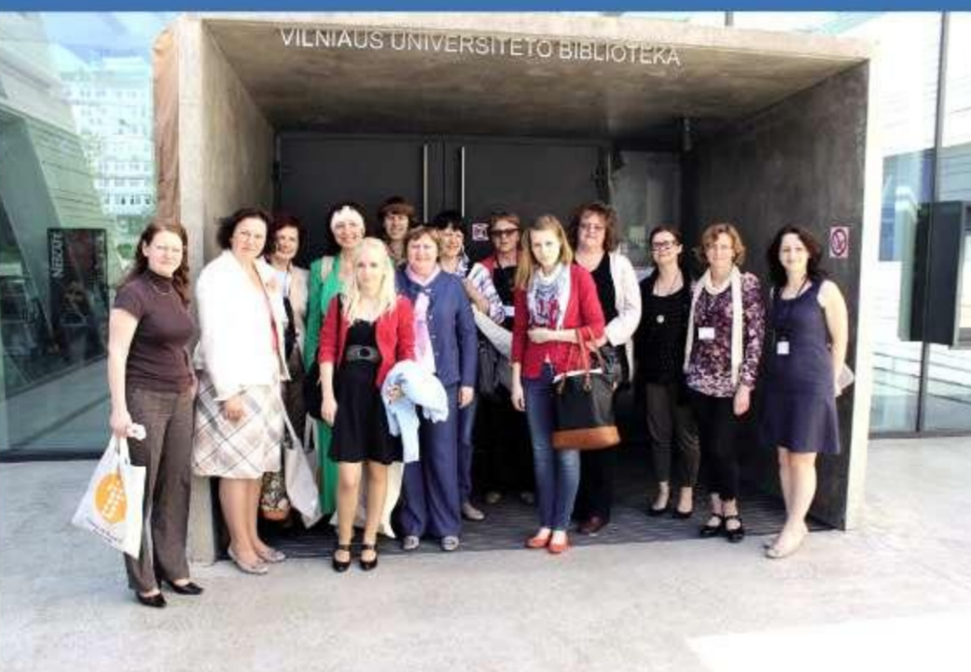
LU Bibliotēkas darbinieku pieredzes apmaiņa Vīļas Universitātes bibliotēkā, 2013. gads.