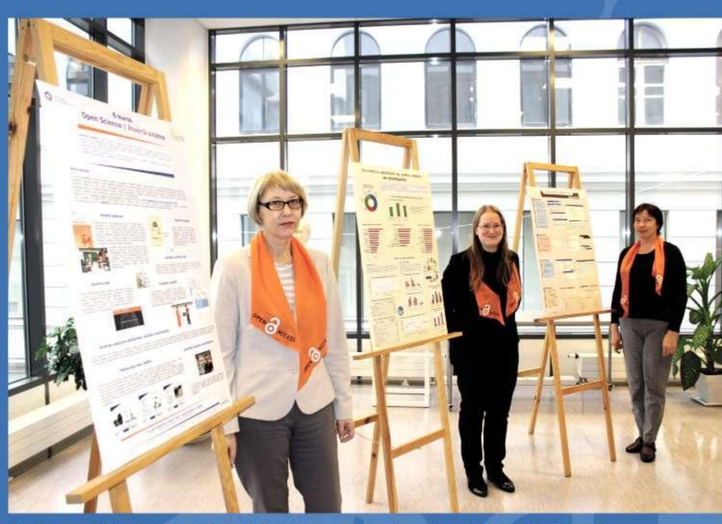
Konference Universitātes zinātniskā darbība un e-estursis, 2016. gads.