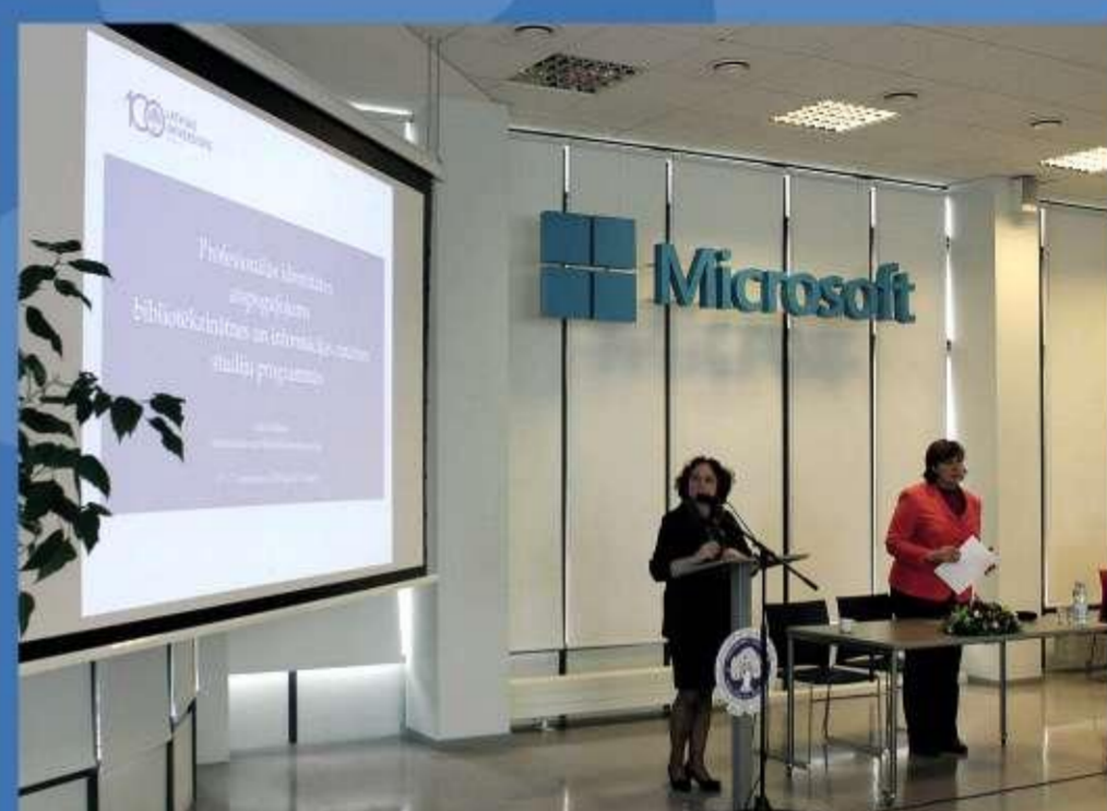
LU Sociālo zinātņu fakultātes un LU Bibliotēkas organizēta LU 77. starptautiskās bibliotēku konferences «Bibliotēkas un informācijas zinātnes sektors», 2010. gads.

Aktīva sadarbība ar Latvijas, starptautiskajām asociācijām un organizācijām – Latvijas Bibliotēku padomi, Latvijas Akadēmisko bibliotēku asociāciju, Kultūras informācijas sistēmu centru, Autoritēšu un komunikācijas konsultāciju aģentūru, Eiropas Zinātnisko Bibliotēku asociāciju. LU Bibliotēka ir OpenAIRE projekta reģionālais pārstāvis Latvijā.