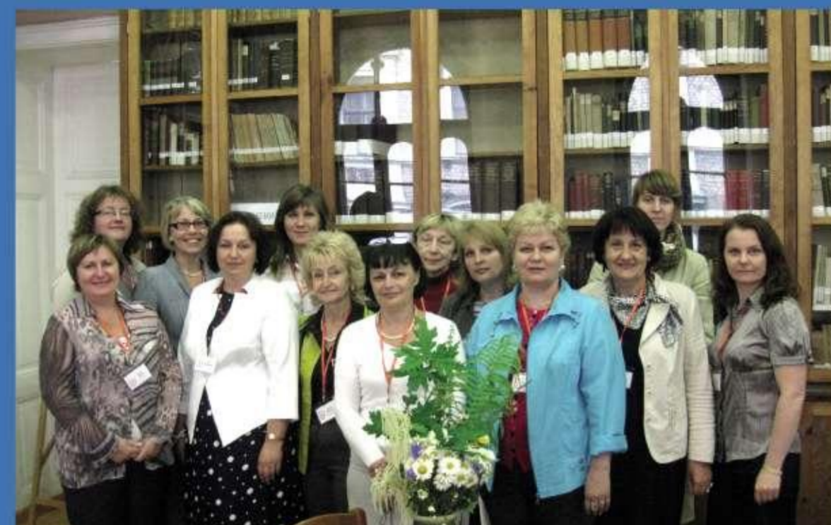
Latvijas - Ukrainas Universitāšu bibliotēku simpozījs, 2013. gads.