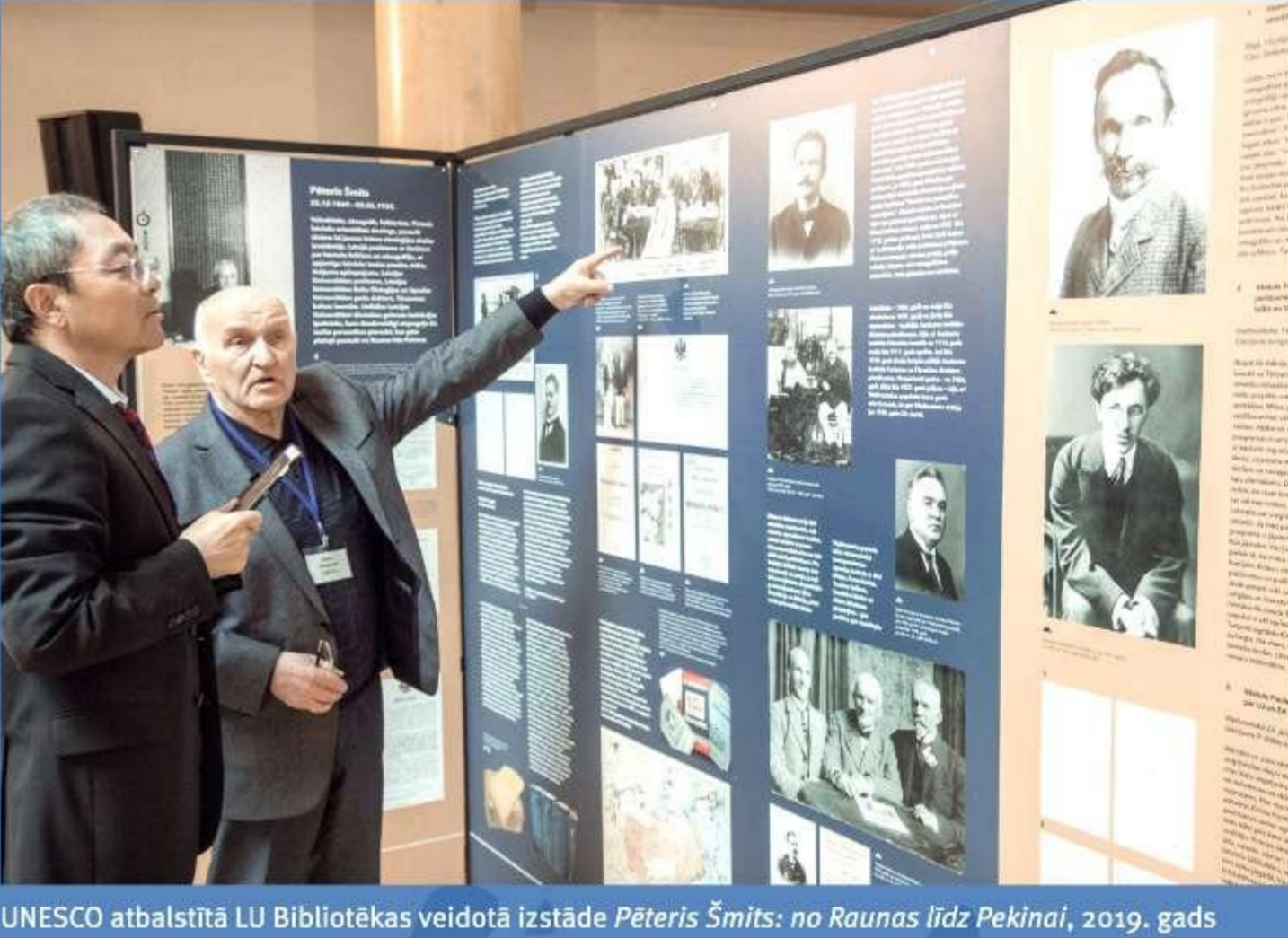
UNESCO atbalstīta LU Bibliotēkas veidotā izstāde Pēteris Šmits: no Raganas līdz Pekīnai, 2019. gads.