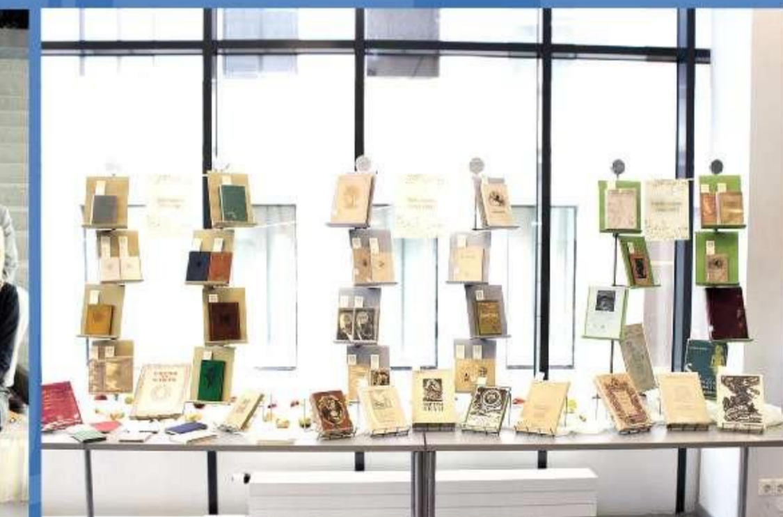
LU Bibliotēkas rīkotā konference Zelta lapaspusē Latvijas gēdniecībā, 2016. gads.