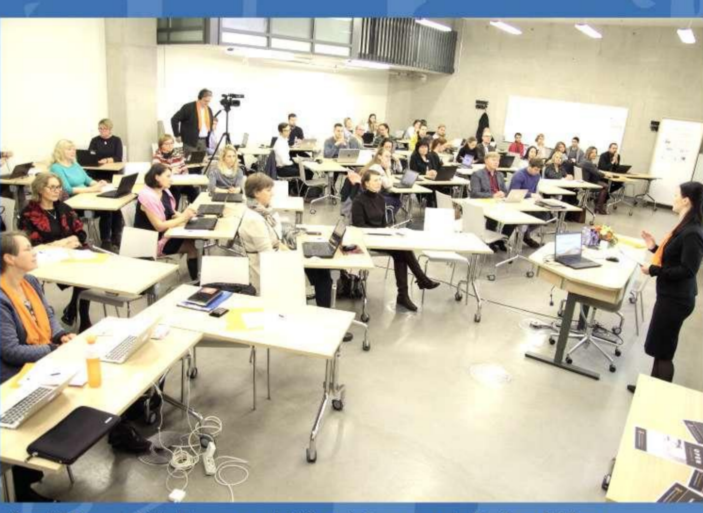
OpenAIRE 2020 projekta ieviešanas organizētais seminārs, 2017. gads.