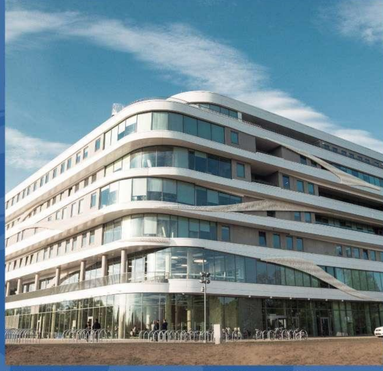
LU Akadēmiskais centrs, Zinātņu māja, kurā atradās Zinātņu mājas bibliotēka