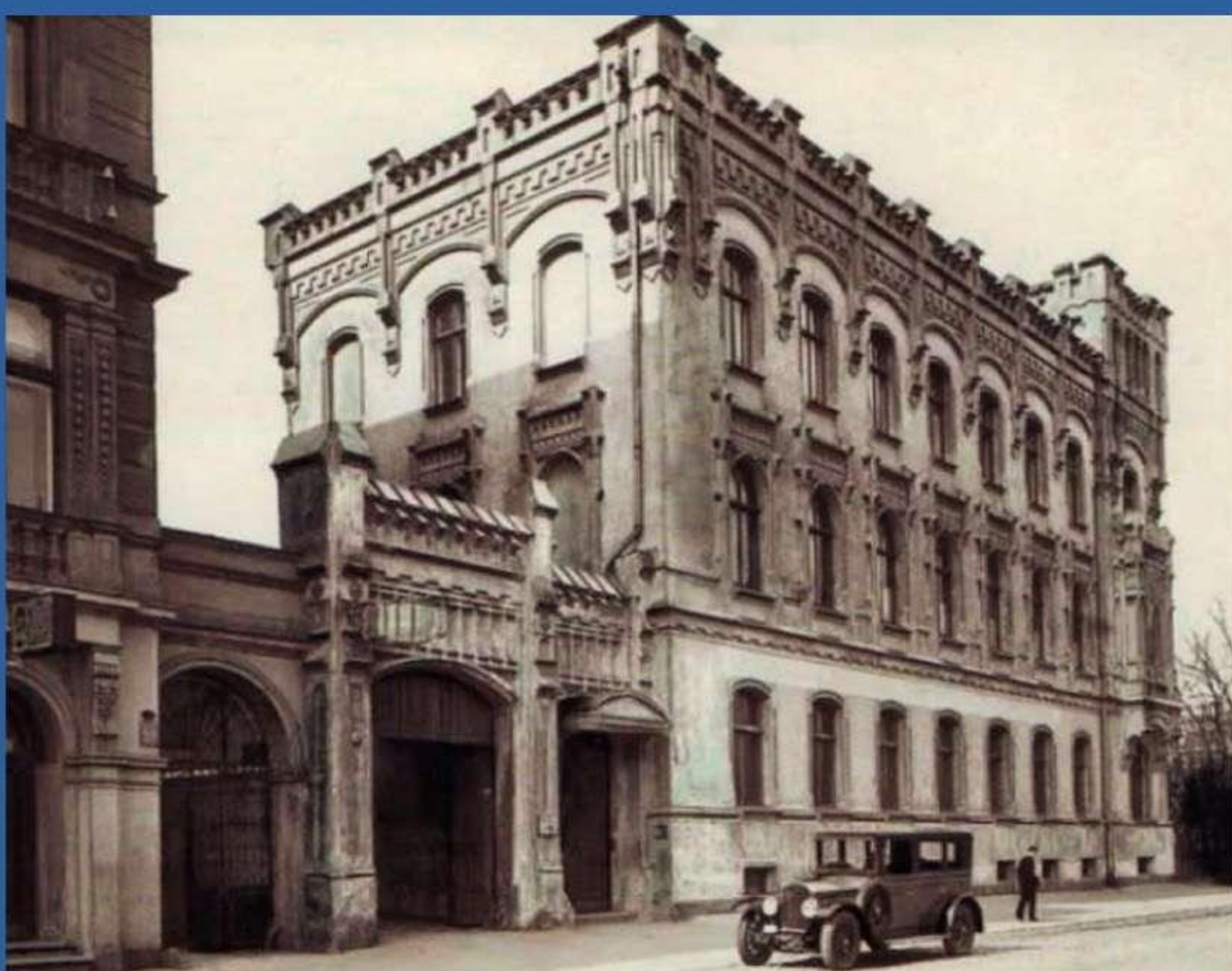
Ēka Kalpaka bulvārī 4, 20. gs. sākums

20. gadsimta 40. gados LU Centrālās bibliotēkas rīcībā tika nodota ēka Kalpaka bulvārī 4, kuru 1874. gadā projektēja Jānis Fridrihs Baumanis. Rīgas mēram Ludvigam Vilhelmam Kerkoviusam un viņa ģimenei paredzētais savrupnams veidots neogotikas stilā. Celtnes neogotisko raksturu veido smailarku logaļādas, dzegļotas jumta dzegzes un stūra rīžlītes, kas atgādina tomi. Interjerā dominē eklektisms. 2012. gada ēka piedzīvoja rekonstrukciju un jau pēc gada, atgūvisi sākotnējo spožumu, vērā durvis lasītājiem kā LU Bibliotēka Kalpaka bulvārī.