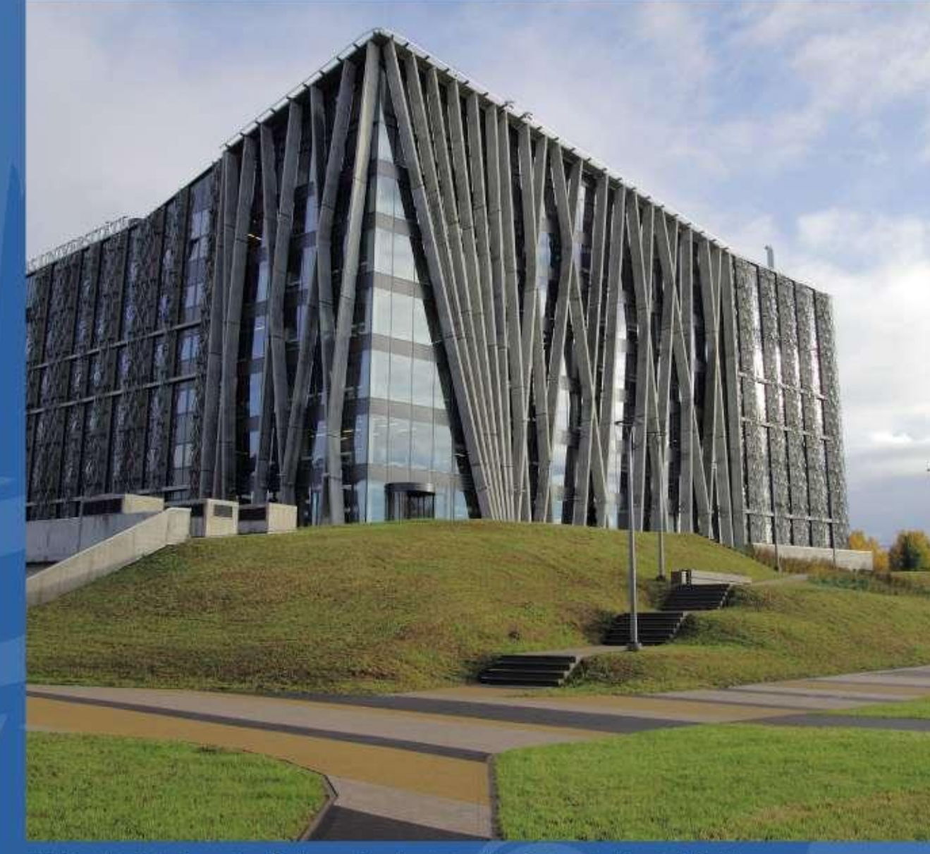
LU Akadēmiskais centrs, Dabas māja, kurā atradās Dabaszinātņu bibliotēka