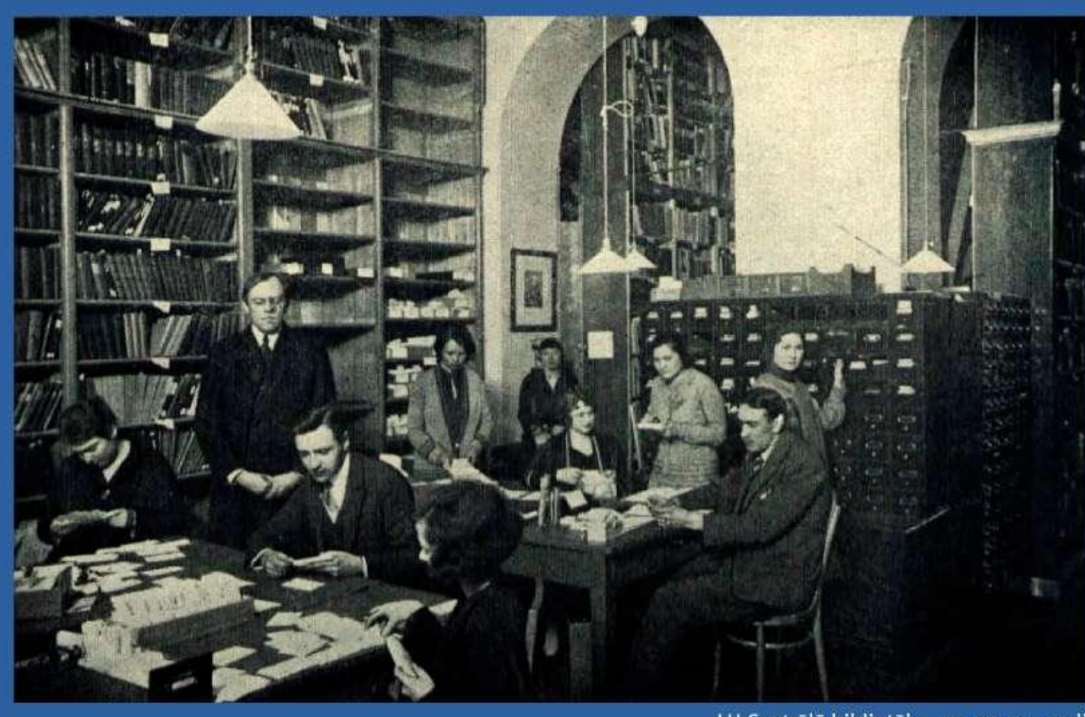
LU Centrālā bibliotēka, 20. gs. 20. gadi

1935. gadā bibliotēkai piešķīra papildus telpas Baznīcas ielā 5. Tomēr jautājums par Centrālajai bibliotēkai paredzētu ēku palika aktuāls.