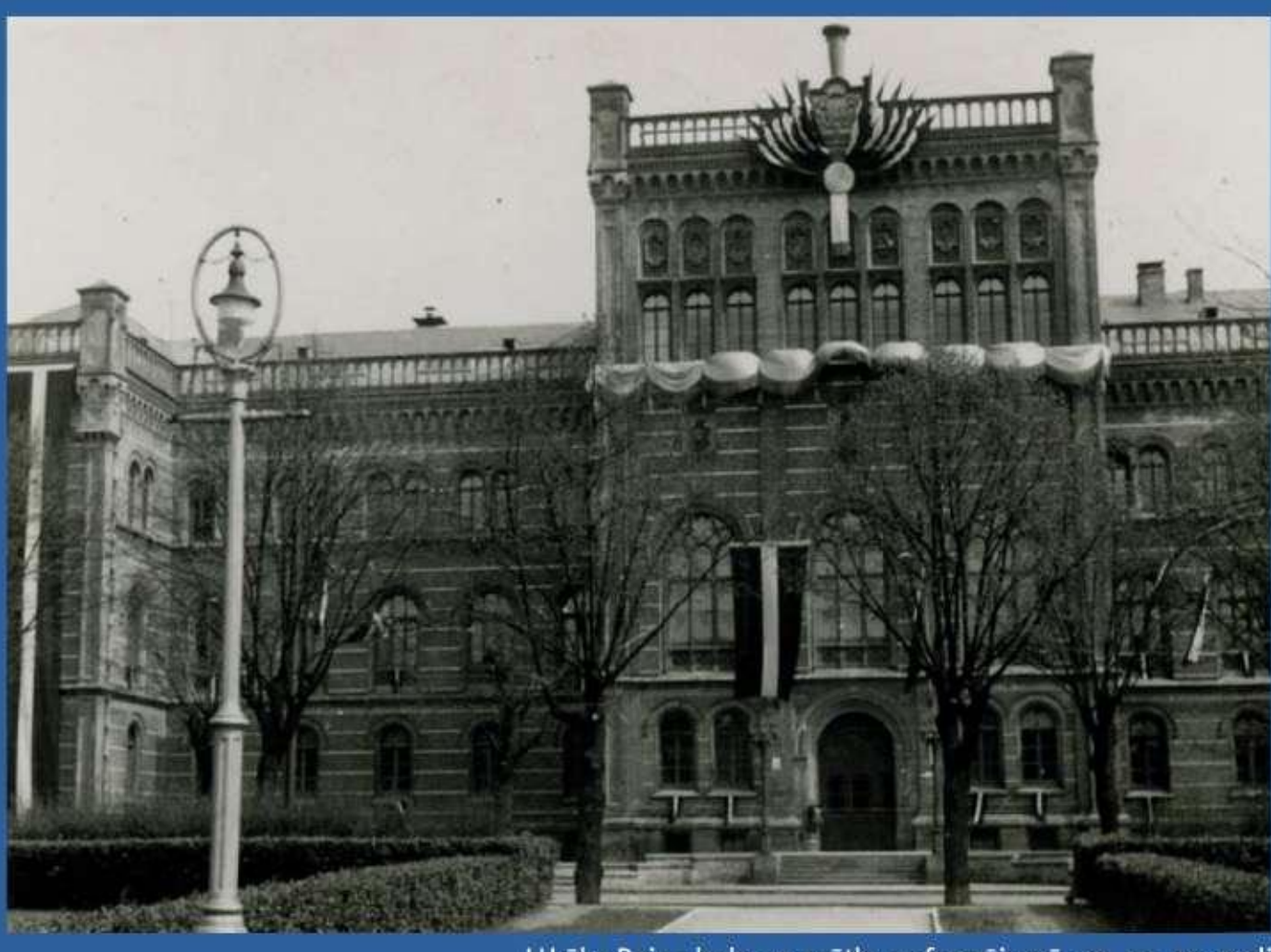
LU ēka Raiņa bulv. 19. svētku nolikuma, 20. gs. 30. gadi