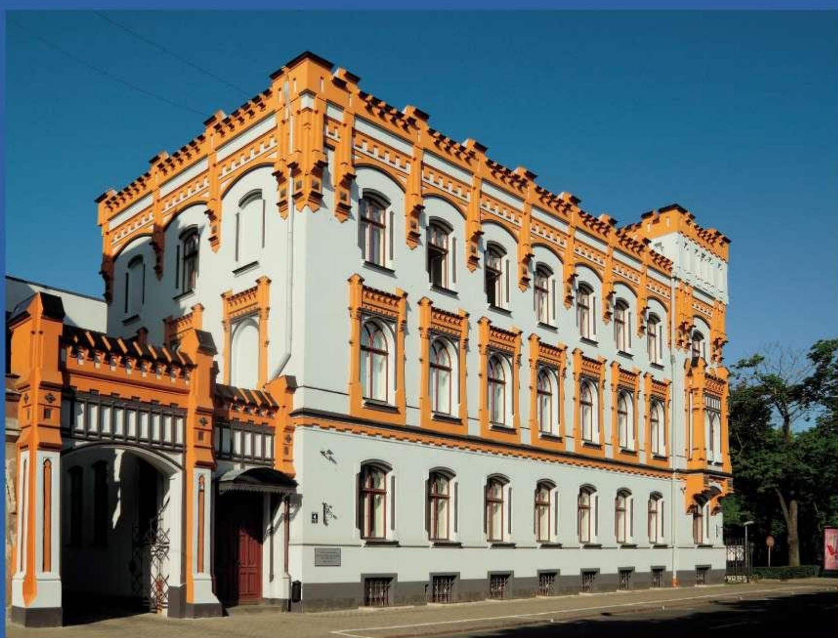
LU Bibliotēkas ēka Kalpaka bulvārī 4 pēc renovācijas