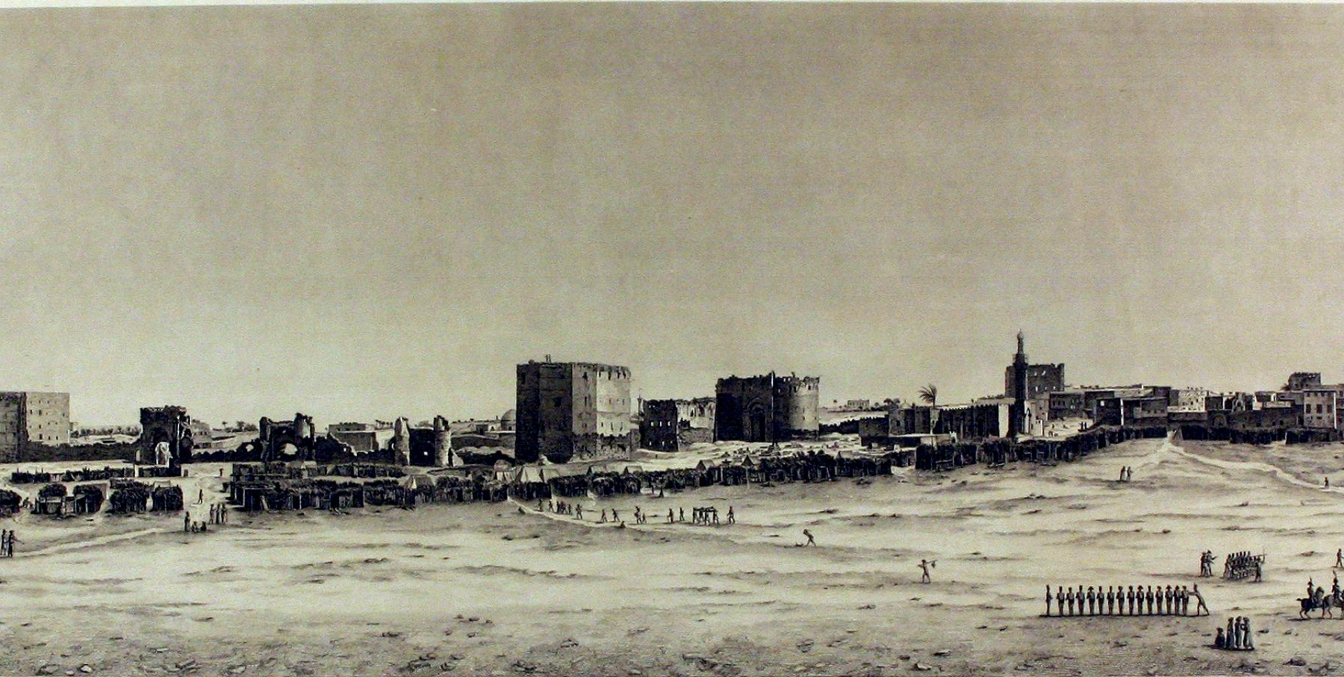
VUE DE L'ESPLANADE OU GRANDE PLACE DU PORT NEUF, ET DE L'ENCEINTE DES ARABES, SECONDE PARTIE.