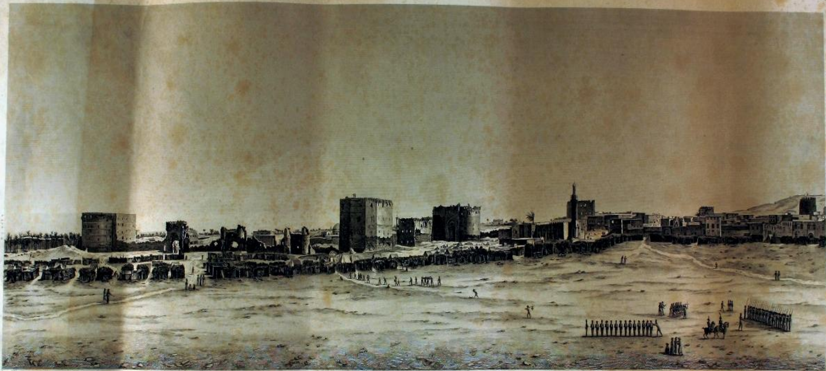
VUE DE L'ESPLANADE OU GRANDE PLACE DU PORT NEUF, ET DE L'ENCEINTE DES ARABES, SECONDE PARTIE.