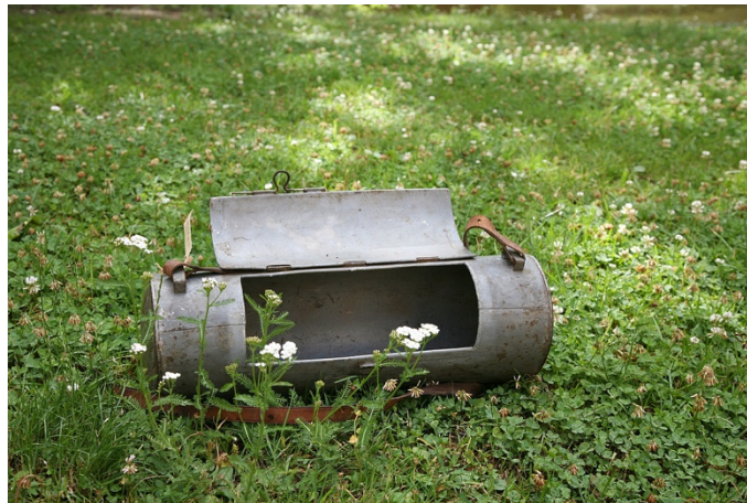
Herbārija uzglabāšanas kamera. Iespējams, 19., 20. gs. mija.

Metāla kamera augu herbāriju ievākšanai un uzglabāšanai (lietots arī nosaukums ‘ vasculum ’), kura, visticamāk, ir piederējusi Rīgas Dabaspētnieku biedrībai (1845 – 1939) vai kādam no tās pētniekiem.