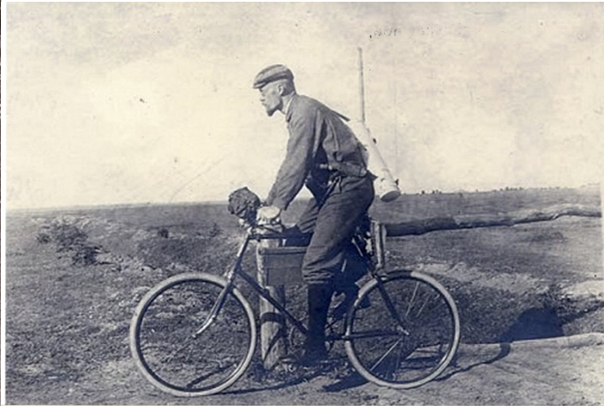
Botāniķis dodas lauka darbos. 20. gs. sāk.

Ne vienmēr gan tika izmantota šāda kamera, bieži herbārijam ievāktu augu lika starp papīra lapām , t.s. “kreklā”, ko, savukārt, ievietoja blīva kartona vākos, kur tos stingri nosēja.