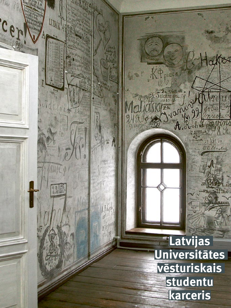
Latvijas Universitātes vēsturiskais studentu karceris