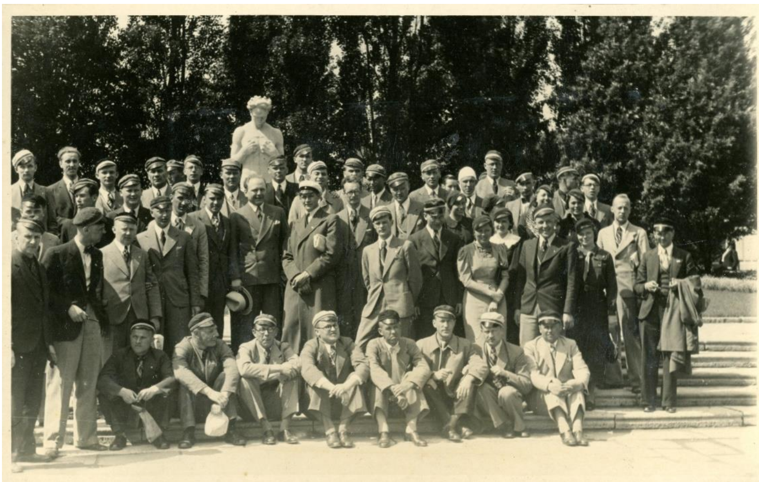
Stokholmas apstādījumos kopā ar igauņu studentēm