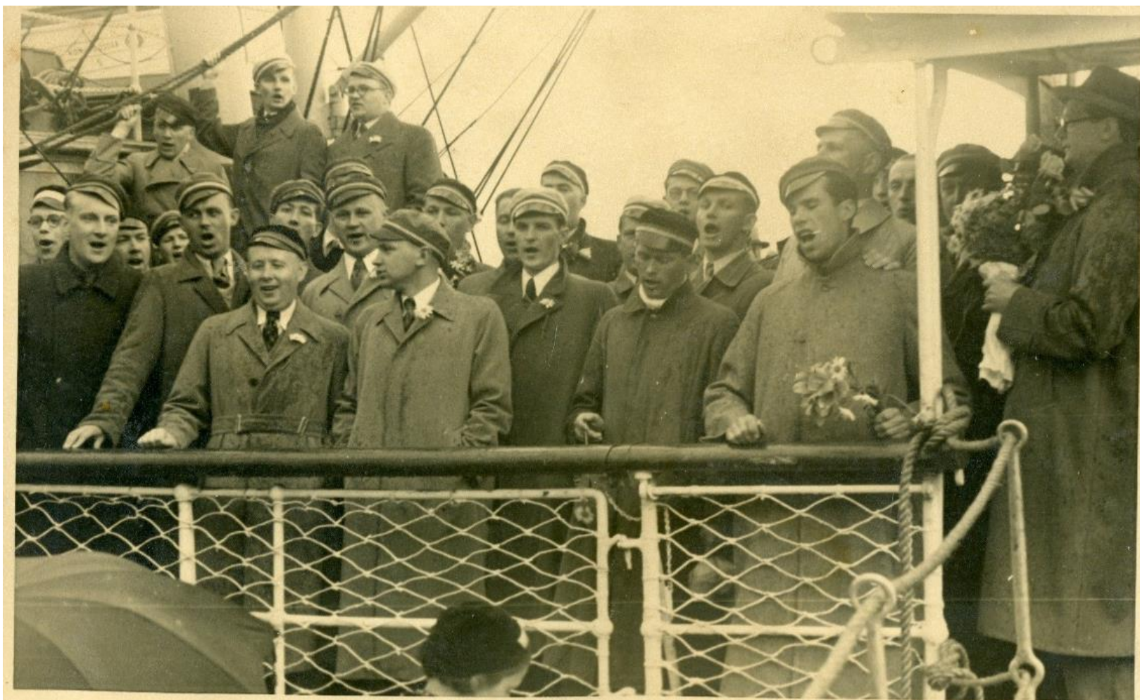
Uz kuģa "Konung Oscar", izbraucot no Rīgas ostas