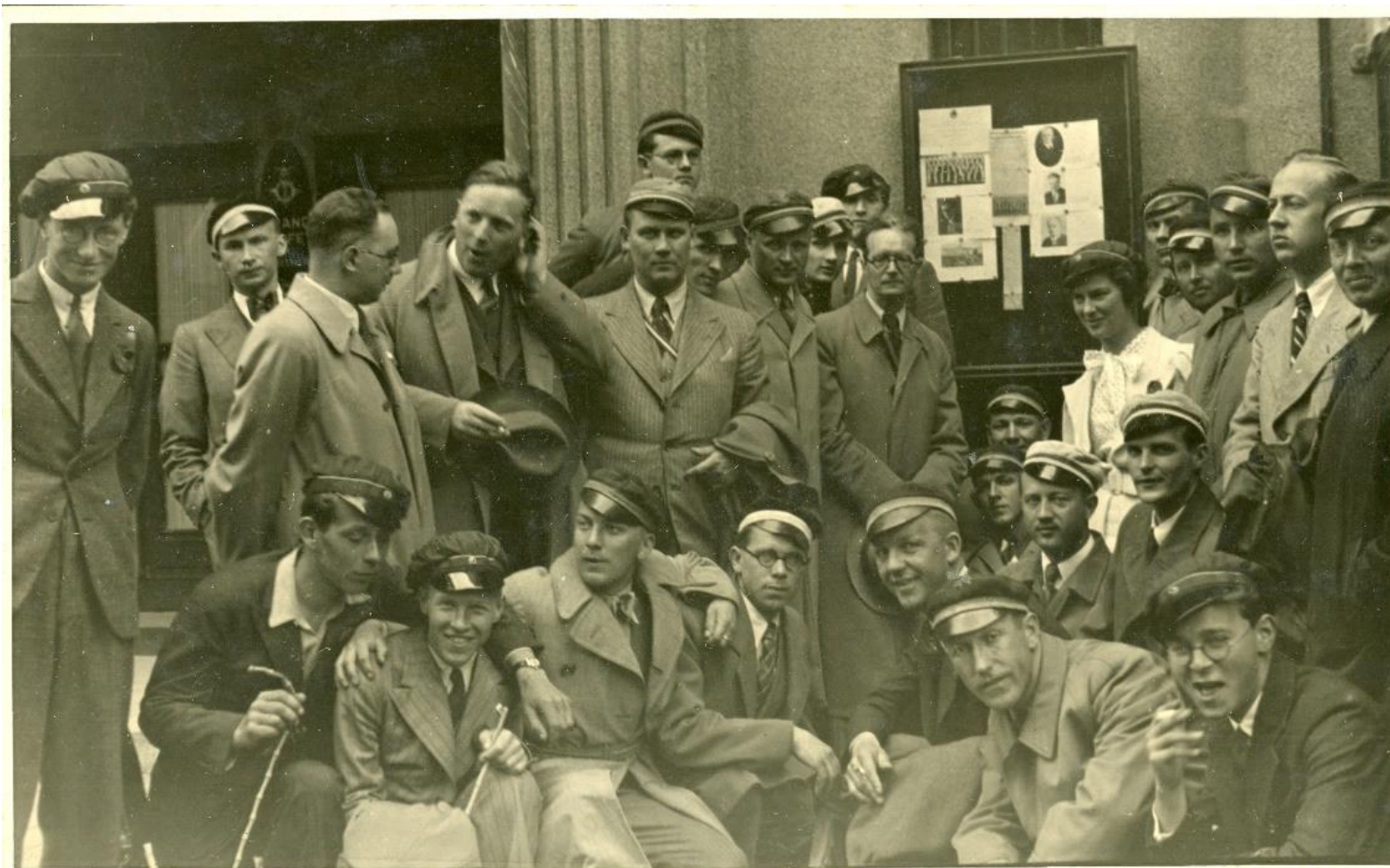
Pirms koncerta Bergenā