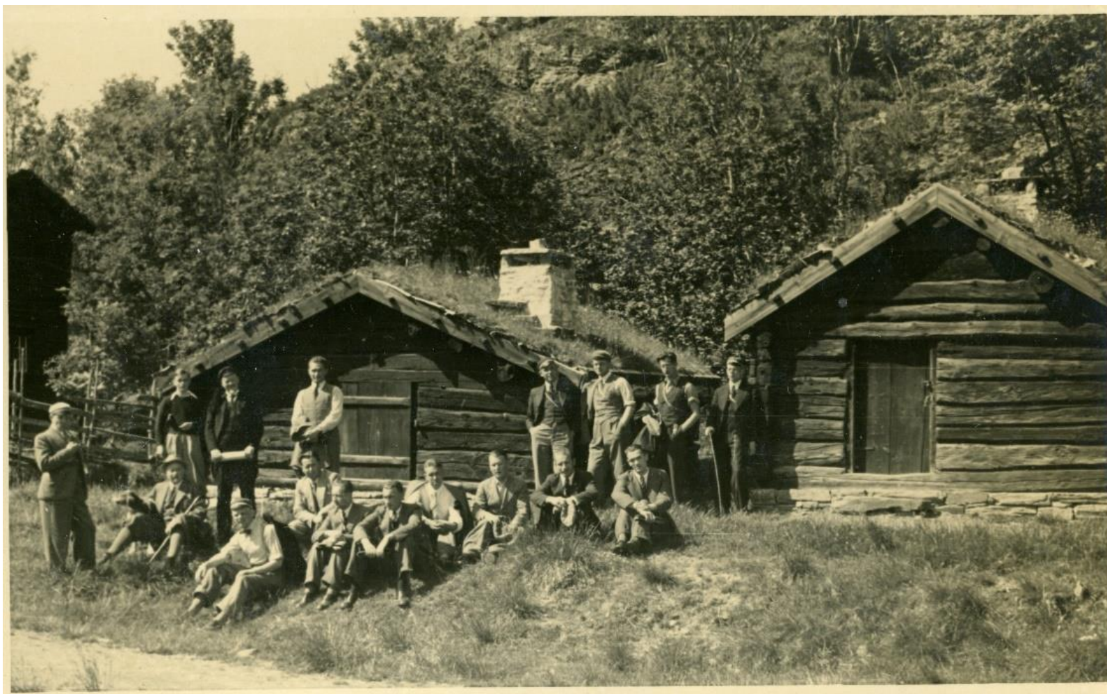
Prezidiju konventa vīru kora dalībnieki Oslo brīvdabas muzejā