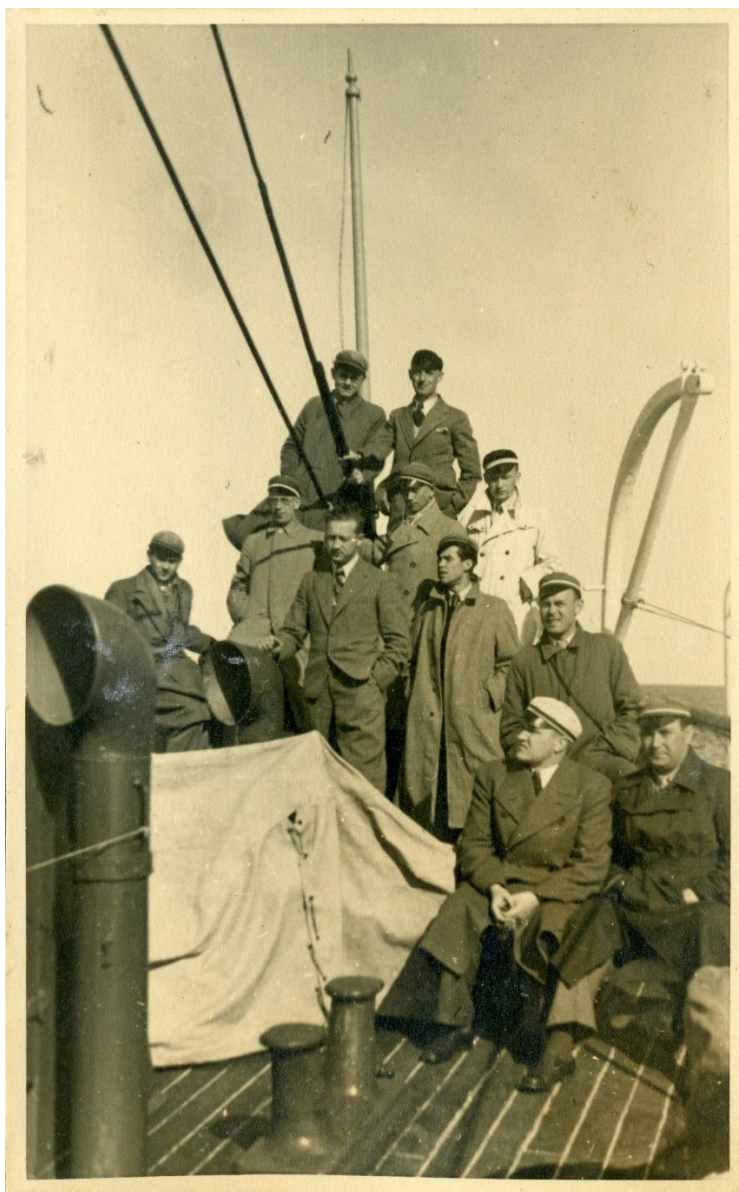
Uz kuģa "Konung Oscar", vērojot Zviedrijas klinšainās saliņas