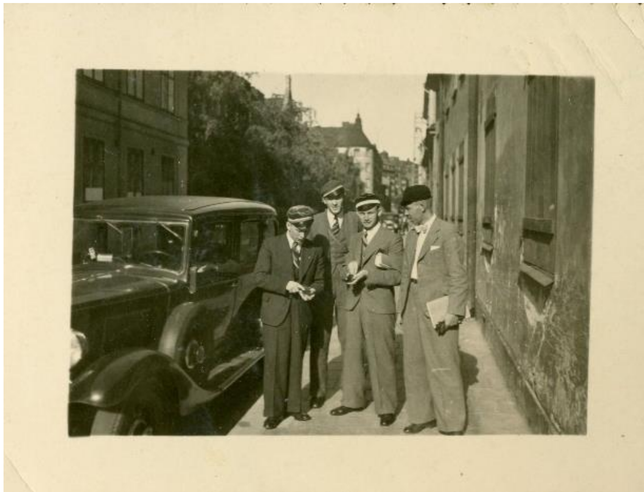
Prezidiju konventa vīru kora dalībnieki Stokholmā