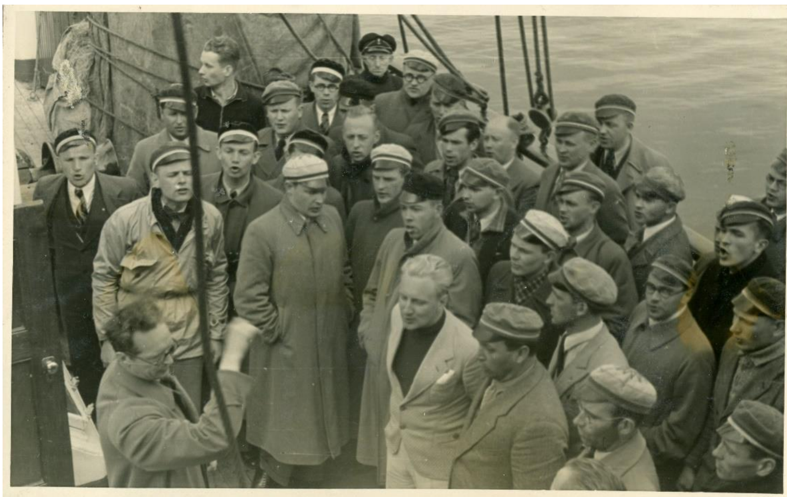
lebraucot ar dziesmu Stokholmas ostā