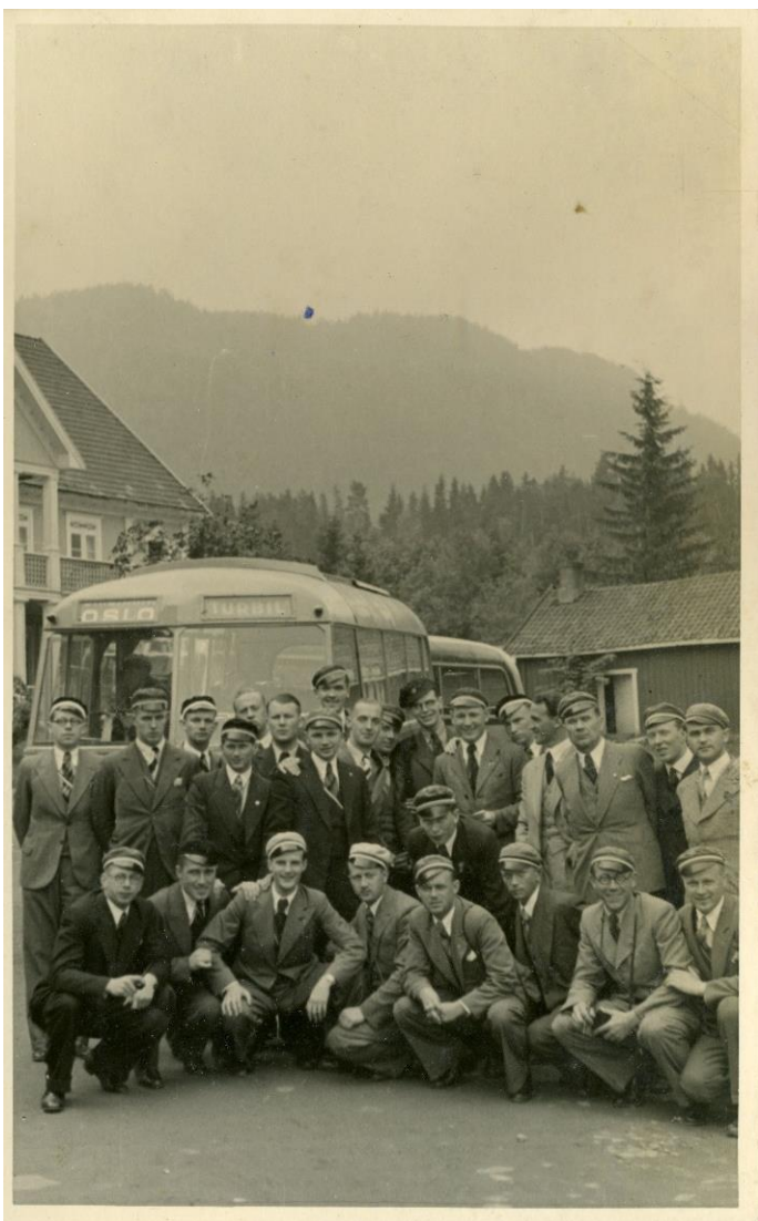
Izbraucienā uz kalniem pie Oslo