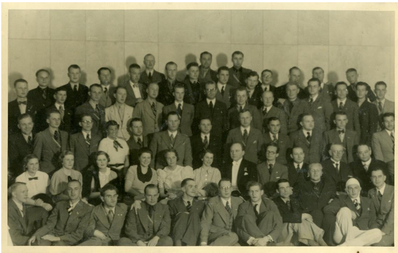
Atvadoties no zviedru studentiem