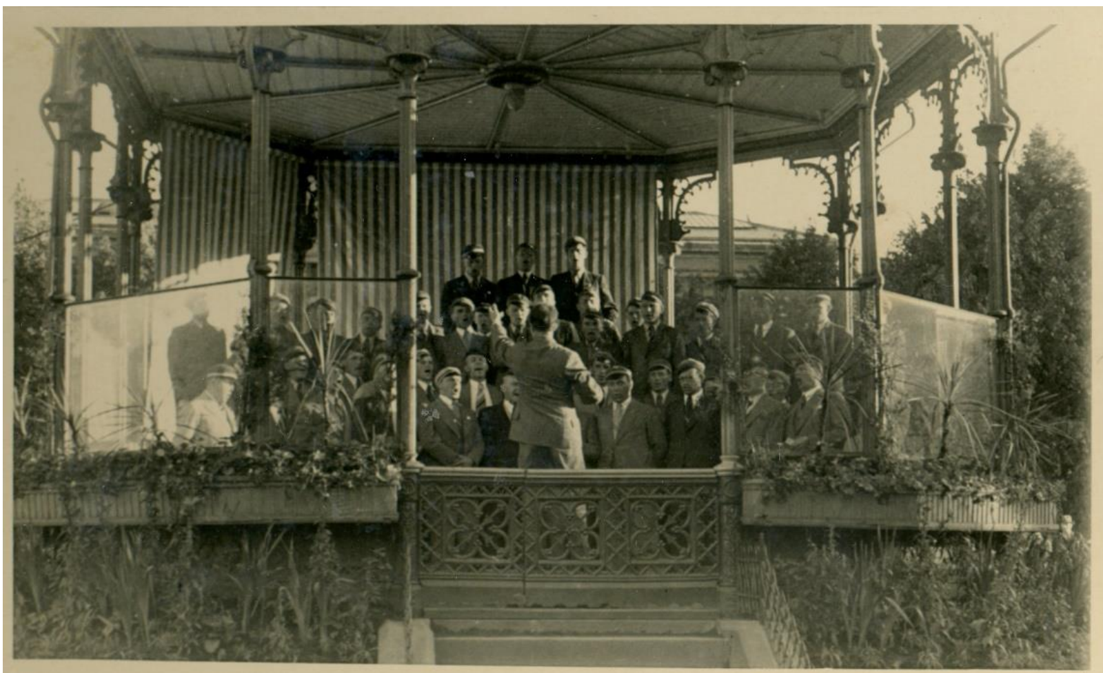
Prezidiju konventa vīru kora koncerts Bergenas pils dārzā