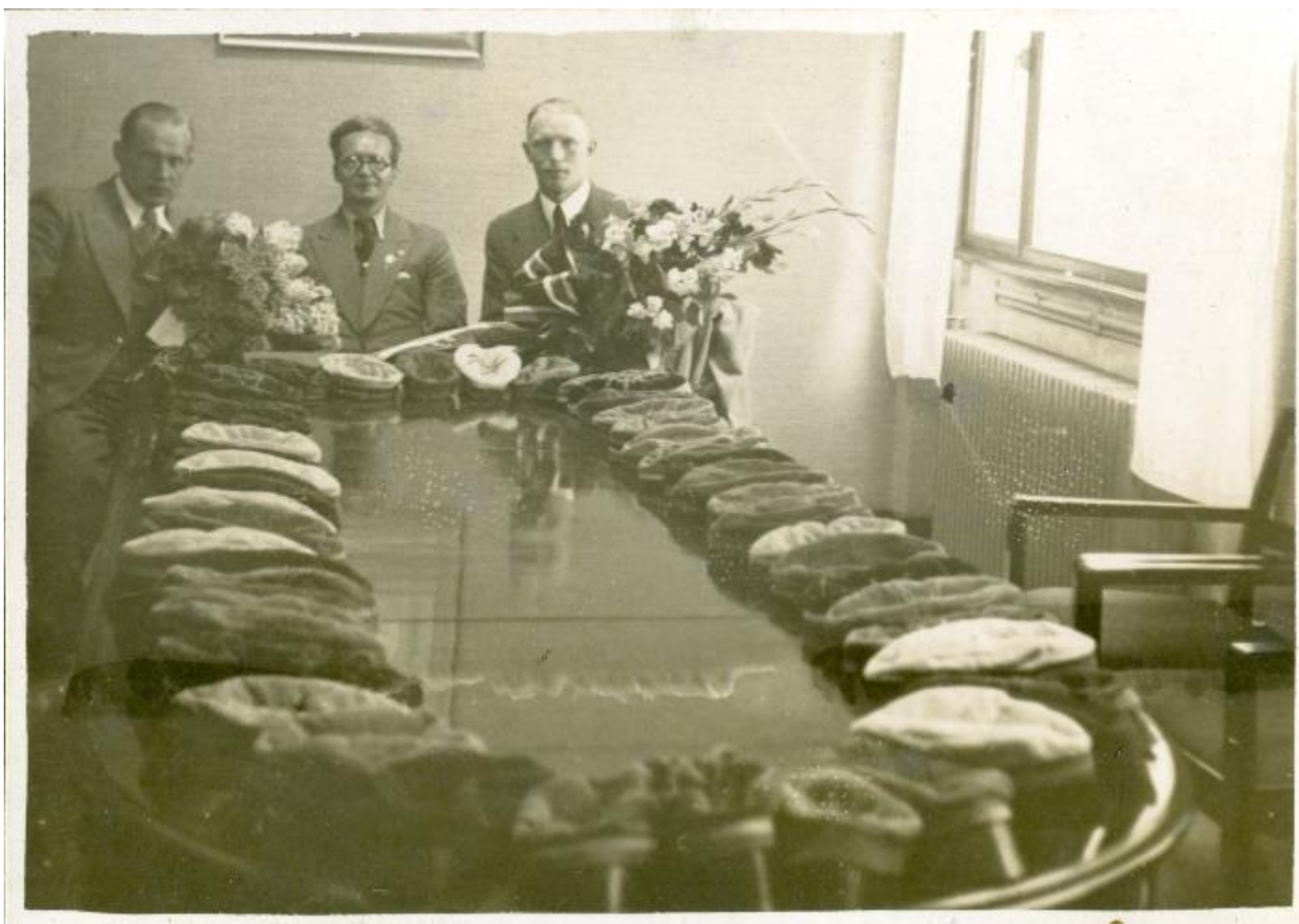
Pirms koncerta Oslo Universitātes aulā