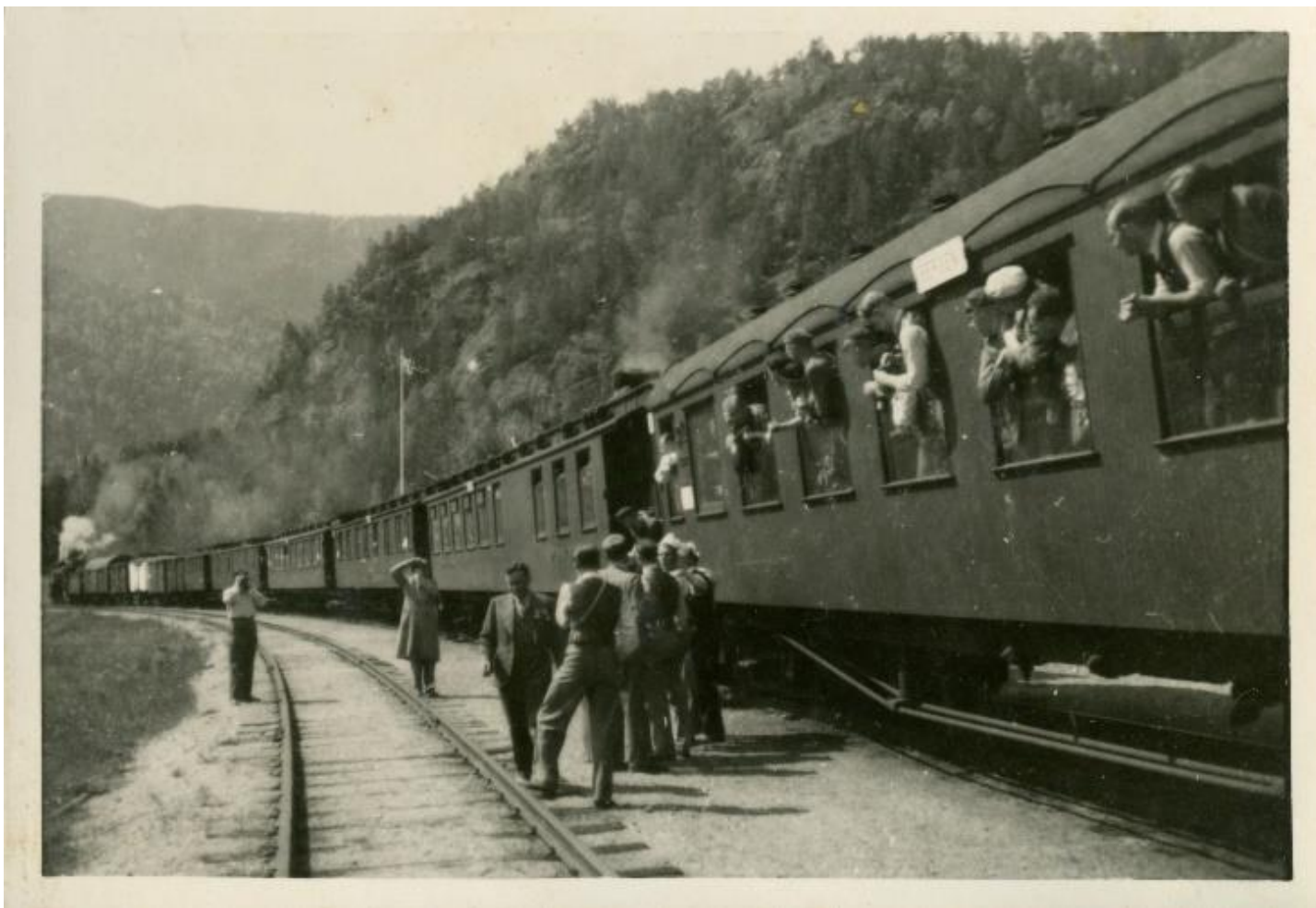
Dodoties ceļā ar vilcienu uz Bergenu