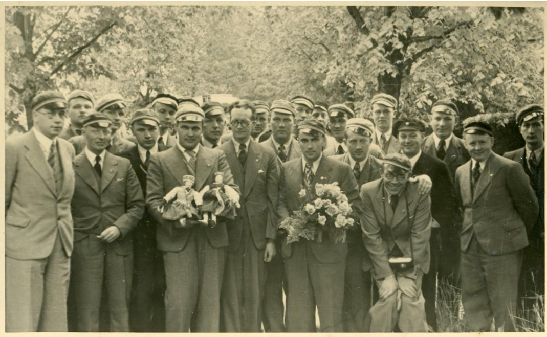
Vīru koris gatavo dāvanu Norvēģijas kronprincesēm – Astrīdai un Ragnildei