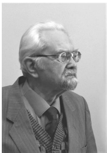
Ēvalds Mugurēvičs

Pēc tam, kad 2. pasaules kara laikā daudzi arheologi bija devušies trimdā, vai padomju režīma politikas ietvaros tika represēti, Latvijas arheoloģijas nozarē sāka ienākt jauna arheologu paaudze, kurai bija nepieciešams iekļauties jaunās sistēmas ideoloģiskajos rāmjos. 1 Viens no jaunajiem arheologiem bija Ēvalds Mugurēvičs, kurš vēlāk kļuva par vienu no Latvijas arheoloģijas nozares stūrakmeņiem, gan lokālā, gan starptautiskā mērogā. Viņš ir autors vairāk nekā 700 publikācijām un ir bijis viedokļu līderis virknē ar arheoloģiju un viduslaiku vēsturi saistītu jautājumu. 2