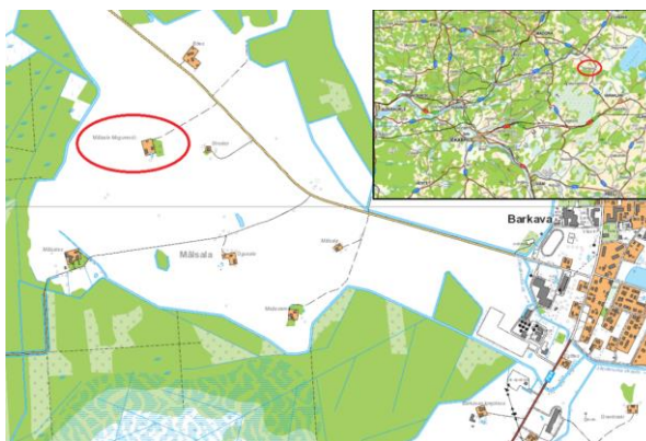
Mālsalas “Mugurēviči” – Ē. Mugurēviča dzimtās mājas (Karte: LĢIA Kartes)

Barkavas pamatskolā. Šis laiks sakrita ar 2. pasaules kara norisi (1939-1945). 3 Gan kara laikā, gan arī pēc kara situācija saglabājās nedroša – vietējā apkārtnē norisinājās cīņas par varu, kā arī mežos darbojās partizāni.