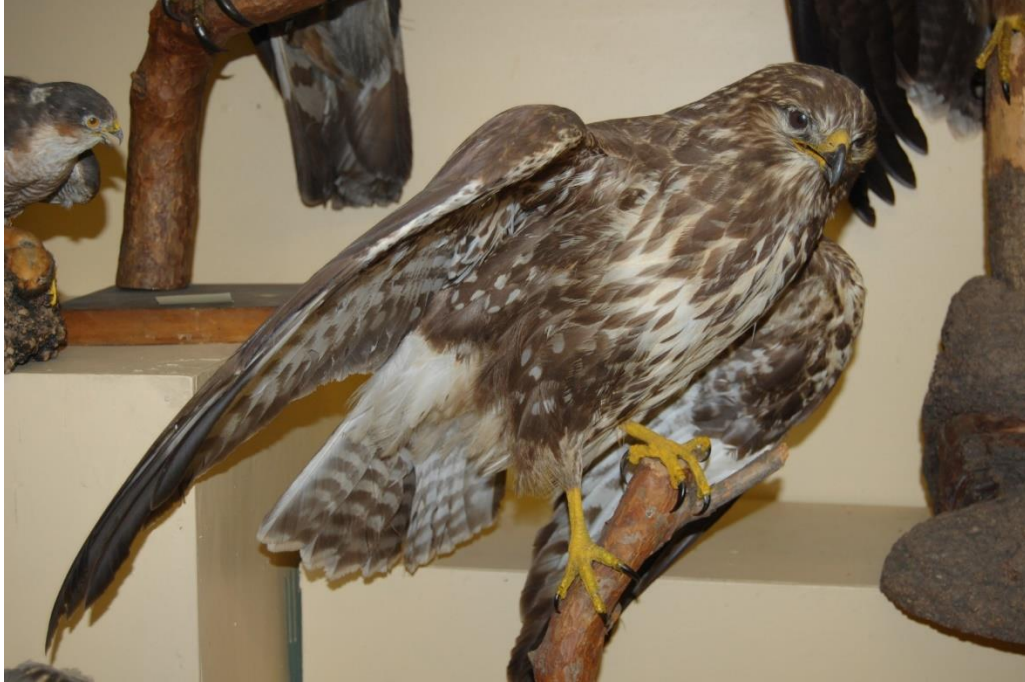
Peļu klijāna izbāzenis.