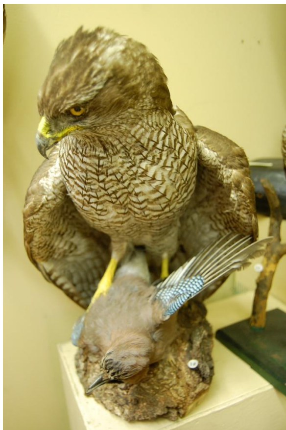
Vistu vanaga izbāzenis ar sīli nagos.

Šie un citi kartotēkas kastītē esošajiem aprakstiem atbilstošie putnu un zīdītāju izbāzeņu paraugi ir kvalitatīvi, mūsdienīgā taksidermijas gaumē izstrādāti un lieliski papildina Zooloģijas kolekciju ekspozīciju. Lai arī inventarizācijas uzskaitē ir datorizēta un šīm kartiņām praktiskas vērtības vairs nav, tās ir kļuvušas par muzeja priekšmetiem, un ir interesanti ielūkoties glīti noformēto, rūpīgi aprakstīto datu krājumā un meklēt šiem aprakstiem atbilstošos īpatņus muzeja vitrīnās.