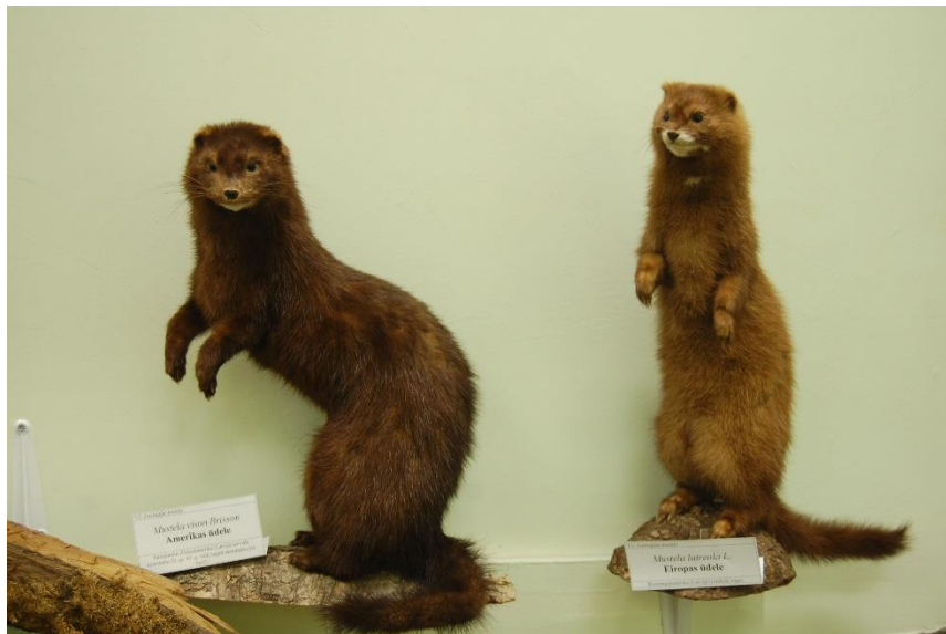
Eiropas ūdeles izbāzeņis (pa labi).

No zooloģiskā dārza LU Muzeja Zooloģijas kolekcijās nokļuvuši ir pārsvarā eksotiski putni. Teju nevienā no inventarizācijas kartotēkas aprakstiem gan nav minēts konkrēts zooloģiskais dārzs, tomēr, iespējams, tas varētu būt Rīgas Nacionālais zooloģiskais dārzs. 1988. gada 16. janvārī Rīgas Nacionālajā zooloģiskajā dārzā (vienīgā kartiņa, kurā fiksēts konkrēts zooloģiskais dārzs) mira sarkankakla valabija ( macropus rufogriseus ) mātīte. Tagad šī dzīvnieka