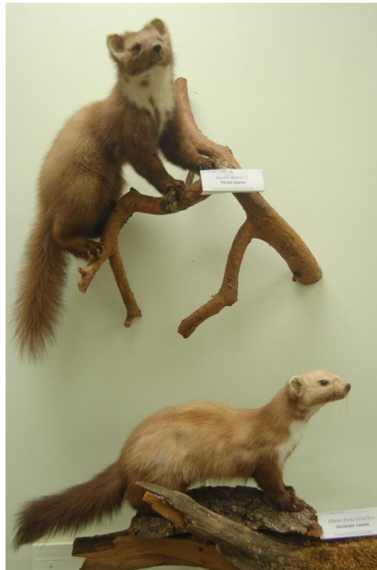
Meža caunas izbāzenis (augšā).