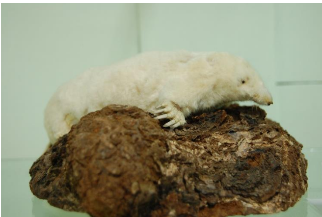
Eiropas kurmja izbāzenis.