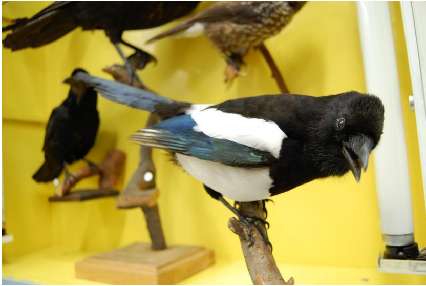
Žagatas izbāzenis.