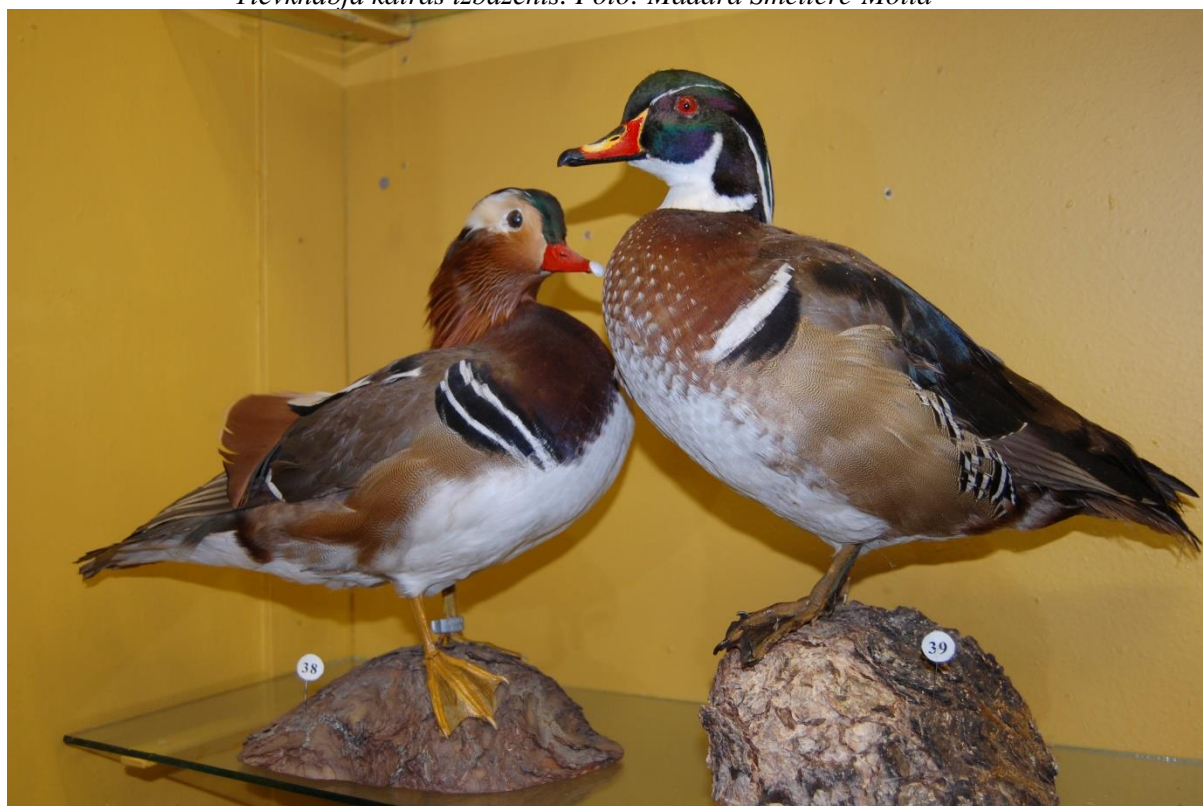
Koku pīles izbāzenis (pa labi) un mandarīnpīles izbāzenis (pa kreisi).