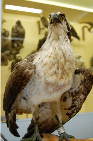
Zivjērgļa izbāzenis ar gredzenu.