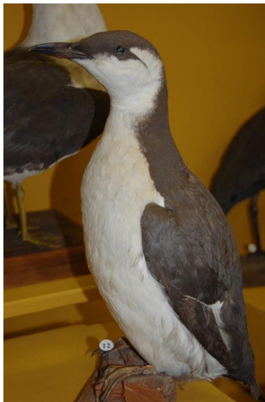
Tievknābja kairas izbāzenis.