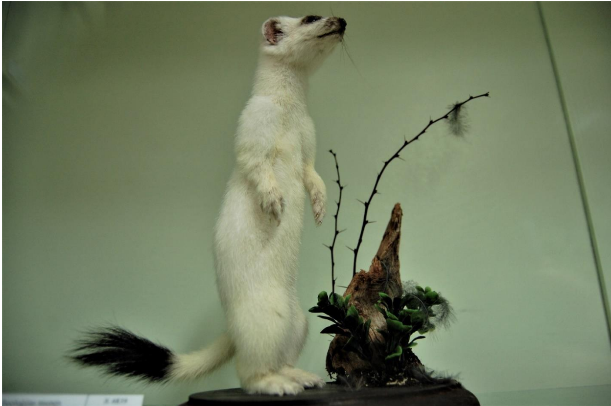
Sermuļa izbāzenis.