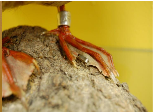
Platknābja izbāzenis ar gredzenu un pleznu zīmi.

2001. gadā muzejā nonākušais dižraibā dzeņa ( dendrocopos major ) izbāzenis vērojams jauna putna tērpā, mednis ( tetras urogallus ) ekspozīcijas vitrīnā izrāda savu riesta pozu, savukārt ziemas žubīšu ( fringilla montifringilla ) izbāzeņu vidū vērojama dažādība, kas fiksēta kartotēkā – 1998. gada maijā mirušo, tajā pat gadā izgatavoto un 1999. gadā muzejā nogādāto putnu, tēviņa un māfītes, pāris tēpies pavasarim raksturīgā tērpā, savukārt 1998. gada rudenī Papē iegūts šīs pašas sugas tēviņš rudens tērpā. Ievēribas cienīgs ir Eiropas kurmja ( talpa europaea ) izbāzenis. To izgatavojis Valdis Roze, tomēr nav zināms, cik sen, jo par tā iegūšanu kartotēkā minēta tikai ieguves vieta – Rucavas apkārtnē. Īpaša ievēriba gan pievēršama kurmja kažoka dēļ. Tas ir sniegbalts jeb albīns.