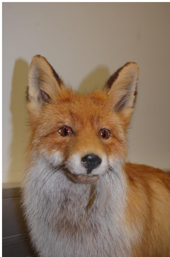
Rudās lapsas izbāzenis.