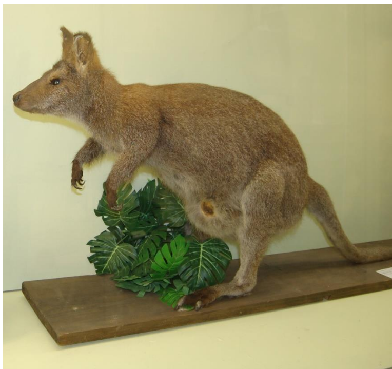
Sarkankakla valabija izbāzenis.

izbāzenis vērojams kā viens no nedaudziem ekspozīcijā izstādītajiem eksotiskajiem zīdītājiem. Kartiņā atrodama detalizēta informācija par dzīvnieka izmēriem. Interesantā kārtā dzīvnieka suga gan vispirms konstatēta kā pelēkais ķengurs, bet vēlāk veikti labojumi.