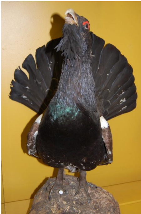
Medņa izbāzenis.