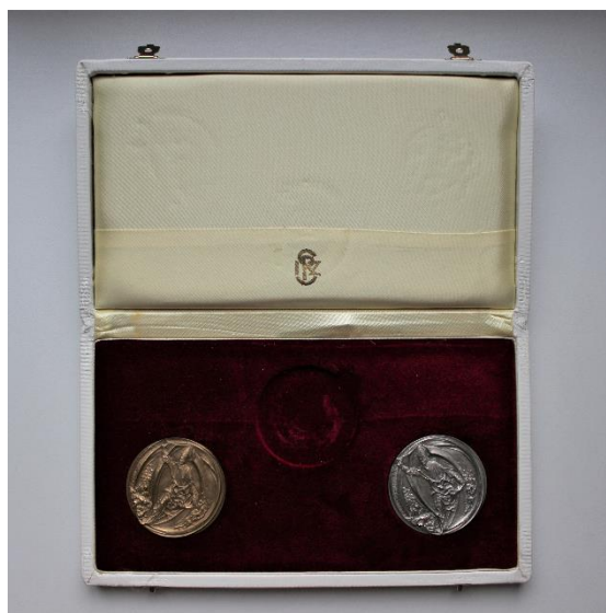
Pāvesta Jāņa Pāvila II medaļu komplekts.

gada 10. jūnijā Svētais Krēsls atzīst Latvijas Republiku de iure . Pēc Latvijas Republikas neatkarības atgūšanas 1991. gada 29. augustā Vatikāns atzina Latvijas atjaunošanu un jau 1. oktobrī Vatikāns un Latvija atjaunoja diplomātiskās attiecības, parakstot kopīgu deklarāciju. 6