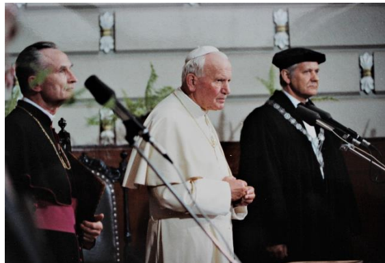
Vizīte LU - no kreisās-Rīgas arhibīskaps-metropolīts Jānis Pujats, pāvests Jānis Pāvils II, LU rektors Juris Zaķis

Latvijas un Romas katoļu baznīcas pāvesta diplomātiskās attiecības jau kopš pašiem valsts pirmsākumiem bijušas labas. Jau pirms Latvijas Republikas pasludināšanas 1918. gada 18. novembrī Latvijas teritorijā dzīvojošie kristieši tika apvienoti Rīgas bīskapijā, pirms tam esot sadalītiem starp vairākām bīskapijām. Tādā veidā Latvija un Vatikāns uzsāka savas diplomātiskās attiecības pirmo reizi. 1920. gada martā, kad norisēja intensīvas miera sarunas starp Latviju un Padomju Krieviju, Rīgā ierodas pirmais nuncijs 4 arhibīskaps Akille Rati. Šīs vizītes laikā tika ievadītas sarunas par konkordāta 5 noslēgšanu starp Latviju un Svēto Krēslu. Nedaudz kā gadu vēlāk 1921.