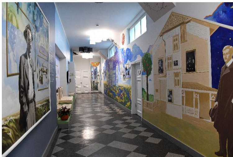
Jaunā ekspozīcija „Frīdrihs Canders Rīgā”, 2023.

2022. gadā Latvijas astronomijas ekspozīcija pārcēlās uz jaunu vietu – bijušajām LU Astronomiskās observatorijas telpām, kur veselus 100 gadus strādāja astronomi. F. Candra ekspozīcija bez šiem priekšmetiem nu izskatījās pavisam trūcīga, padomju gados veidotie stendi gan dizaina, gan nolietojuma ziņā bija novecojuši un viss kopumā neatstāja labu iespaidu.