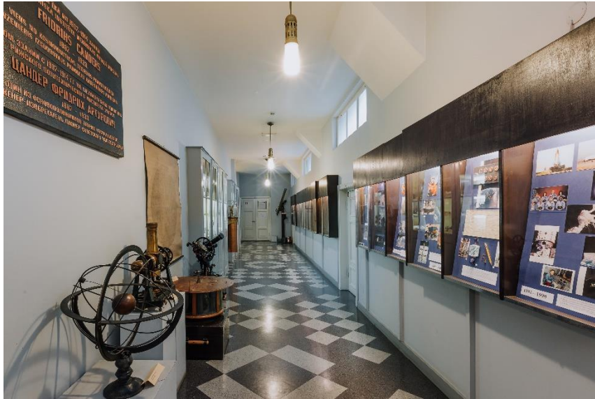
Frīdriha Candra - kosmosa izpētes muzeja ekspozīcija, 2017.

Pārvietošanas dēļ muzejs ļoti daudz ko zaudēja. Pirmkārt jau memoriālo statusu, lai arī muzejs tagad atradās F. Candra Alma mater , tas nebija pietiekoši memoriālā statusa saglabāšanai. Turpmāk tas saucās Frīdriha Candra – kosmosa izpētes muzejs. Otrkārt, muzejs zaudēja daļu ekspozīcijas, bet atlikusī ekspozīcija telpu trūkuma dēļ vēl šobrīd atrodas gaitenī. Bija arī ieguvumi , no tiem galvenais – atrašanās vieta Rīgas centrā, kur jebkurš muzeja organizētais pasākums bija daudz plašāk apmeklēts. Tāpat jāpiemin papildus iespējas, ar ko muzejs tagad varēja ieinteresēt apmeklētājus – uzkāpt Astronomiskajā tornī un ielūkoties teleskopā, iziet uz jumta platformas un noteikt laiku pēc saules pulksteņa, ko muzejs uzstādīja 2009. gadā kā dāvanu Latvijas Universitātei 90 gadu jubilejā, pabūt studentu karcerī, kur F. Candra studiju laikā studentus gan vairs neieslodzīja.