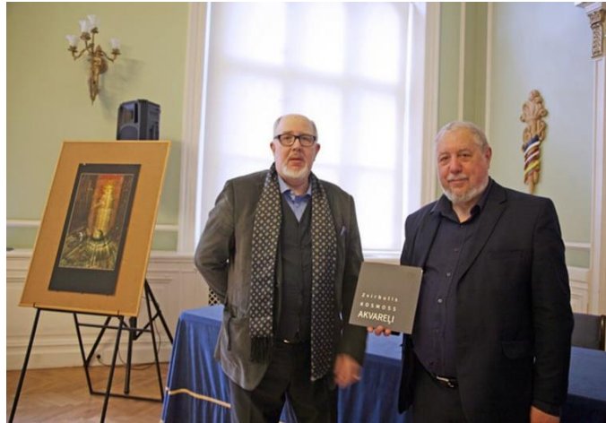
Pirmās muzeja sērijas grāmatas “Zvirbulis. Kosmos. Akvareļi” atklāšana, 2019.

2017. gadā tika mainīta LU Zinātnes un tehnikas vēstures muzeja struktūra. Tagad LU paspārnē vairs nav septiņi atsevišķi muzeji, kas sastādīja ZTVM, bet viens – LU Muzejs, kurā ir 7 kolekcijas, tai skaitā Frīdriha Candra un Latvijas astronomijas kolekcija.