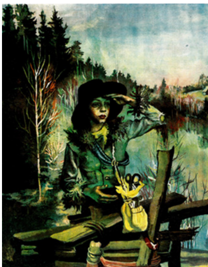
4. attēls. Ilustrācijas un teksta sasaiste. M. Tabakas ilustrācija (Plūdons 1980, 47).

„Mīļo, labo krusttēv! piedod, piedod man! es uz priekšu nevienam putniņam vairs pāri nedarišu!” (Plūdons 1980, 56)