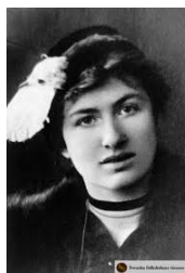
1. attēls. Edīte Sēdergrāna 1917. gadā (Treimane 1995).