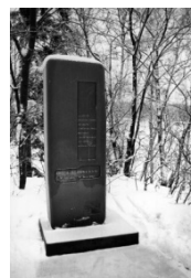
3. attēls. Dzejniecei veltītais piemiņas akmens Raivolā (Roščino).

Dzejniece sāk radošo publikāciju gaitas ar krājumu Dikter (1916; „Dzejoļi”). Viņas pašas dzīves laikā publicēti vēl trīs dzejas krājumi zviedru valodas oriģinālos izdevumos – Septemberryran (1918; „Septembra lira”), Rosenaltaret (1919; „Rožu altāris”) un Framtidens skugga (1920; „Nākotnes ēna”), kā arī jau pieminētais aforismu apkopojums Brokiga iakttagelser (1919; „Raibie novērojumi”), savukārt autorei vēlīnos liriskas sacerējumus pēc viņas nāves krājumā Landet som icke är („Zeme, kuras nav”) 1925. gadā izdod H. Ulsone.