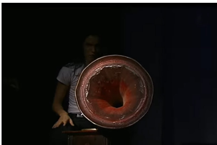
5. attēls. Performances ievaddaļā iedarbinātais gramofons, kurš it kā atskaņo vēstījumu (Cosmos 2005).

Mūzikas grupas Cosmos radītā performance „Rūķīši un Mežavecis” (Cosmos 2005) prezentē asprātīgu un humorpilnu 1913. gadā pirmpublicēto V. Plūdoņa dzejojuma „Rūķīši un Meža vecis” (Plūdons 1974, 373–374) recepciju, kurā senais savijas ar mūsdienīgo. Jau priekšnesuma sākumā vecā gramofona tēlā (5. attēls) un tā čerkstoņā ietverts mājiens uz sen radīta teksta atskaņojumu. Notikuma dramaturģijas pamatu veido grupas daudz balsīgā skanējuma radīti mūzikas stilu sapludinājumi, ritmikas un intonāciju maiņas no izčukstētām frāzēm līdz marša imitācijai, no pikošanās kulminācijas trauksmes līdz maigi liriskai izskaņai, bet ēnu teātra formāts (6. attēls), kurā dominē mūziķu personību un viņu radīto tēlu saspēle, piedāvā arī tādas vēstījuma nianšes, kuras vairāk uztveramas pieaugušajiem skatītājiem, tādējādi būtiski paplašinot mērķauditoriju.