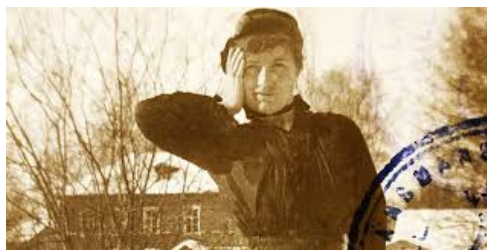
2. attēls. Edīte Sēdergrāna savā dzīvesvietā Raivolā – fotokartiņa ar pasta zīmogu.