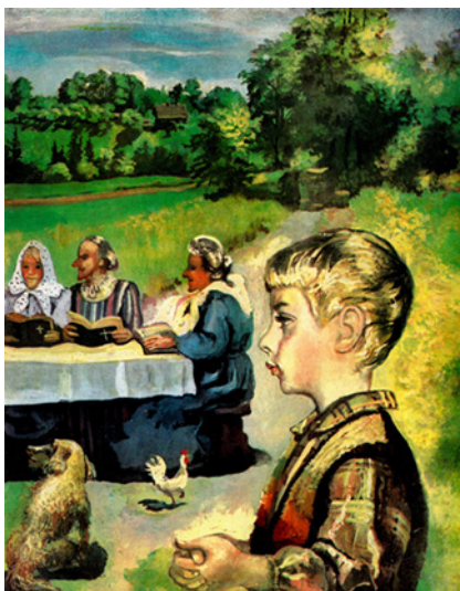
2. attēls. Lauku ainava vasarā. M. Tabakas ilustrācija (Plūdons 1980, 23–24).