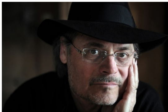
Abbildung 1 (links). Deckblatt der Buchausgabe – Zoderer, Joseph. 2012./2018. Die Walsche . Innsbruck-Wien: Haymon Taschenbuch.

zudem wird ihr schon seit ihrer Kindheit die Bezeichnung „die Walsche“ 25 zugeschrieben, als ein Klassenkamerad