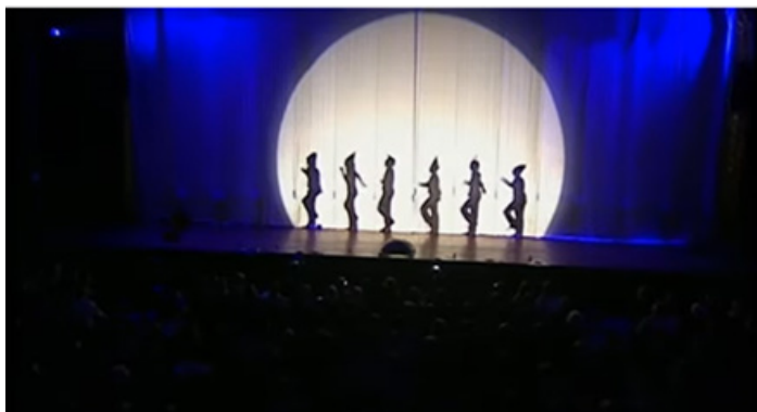
6. attēls. Ēnu teātra spēle (Cosmos 2005).

Šo tikai dažu atsevišķu recepcijas piemēru analīze ļauj secināt, ka V. Plūdoņa daiļradei dažādās mūsdienu mākslas jomās ir īpaša pievilcība, ko sekmē tādas dzejnieka daiļrades kvalitātes kā orientēšanās uz cilvēkvērtībām, spilgtas redzes gleznas, izteiksmīga valoda,