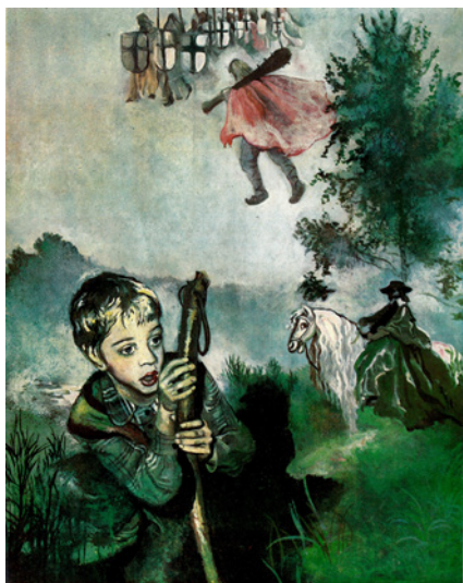
1. attēls. Bērņa emociju niansēta atklāsmē un sapludinātās īstenības un iztēles robežas. M. Tabakas ilustrācija (Plūdons 1980, 15–16).